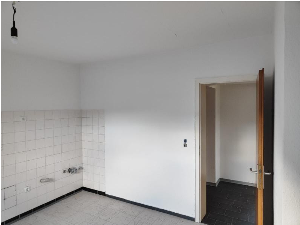
Küche mit Fliesenspiegel