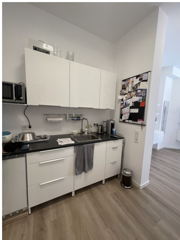
KÜCHE - MIT ABSTAND