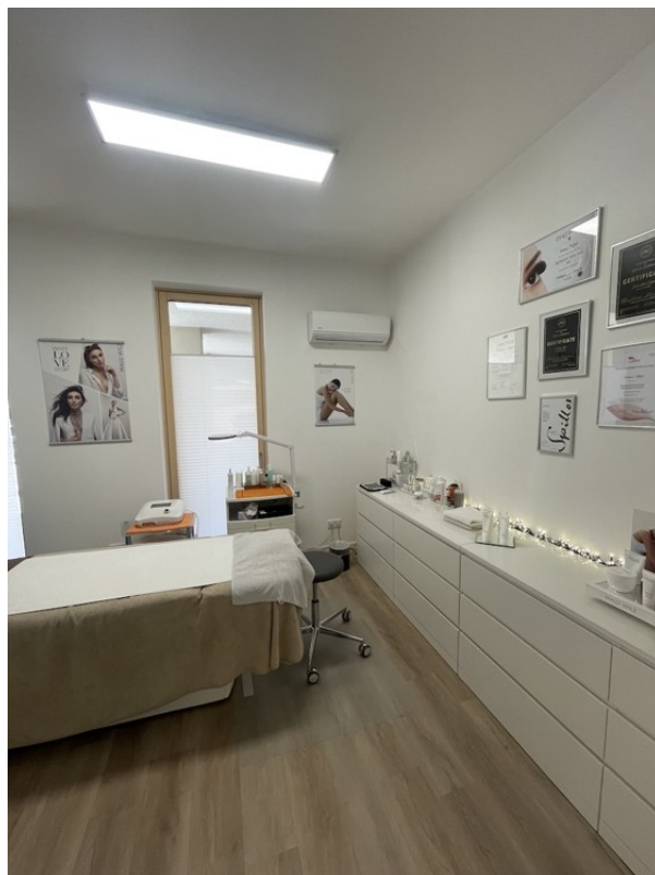
BEHANDLUNGSRaum / BÜRO