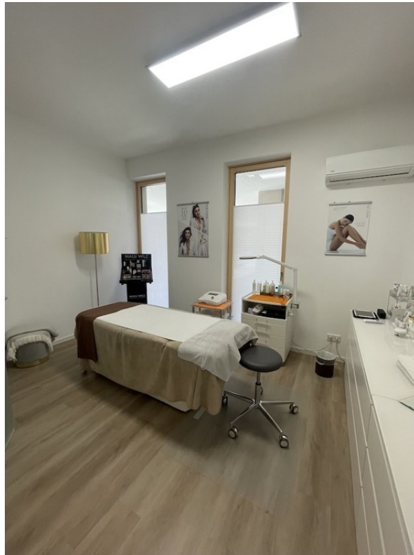
BEHANDLUNGSRAUM / BÜRO