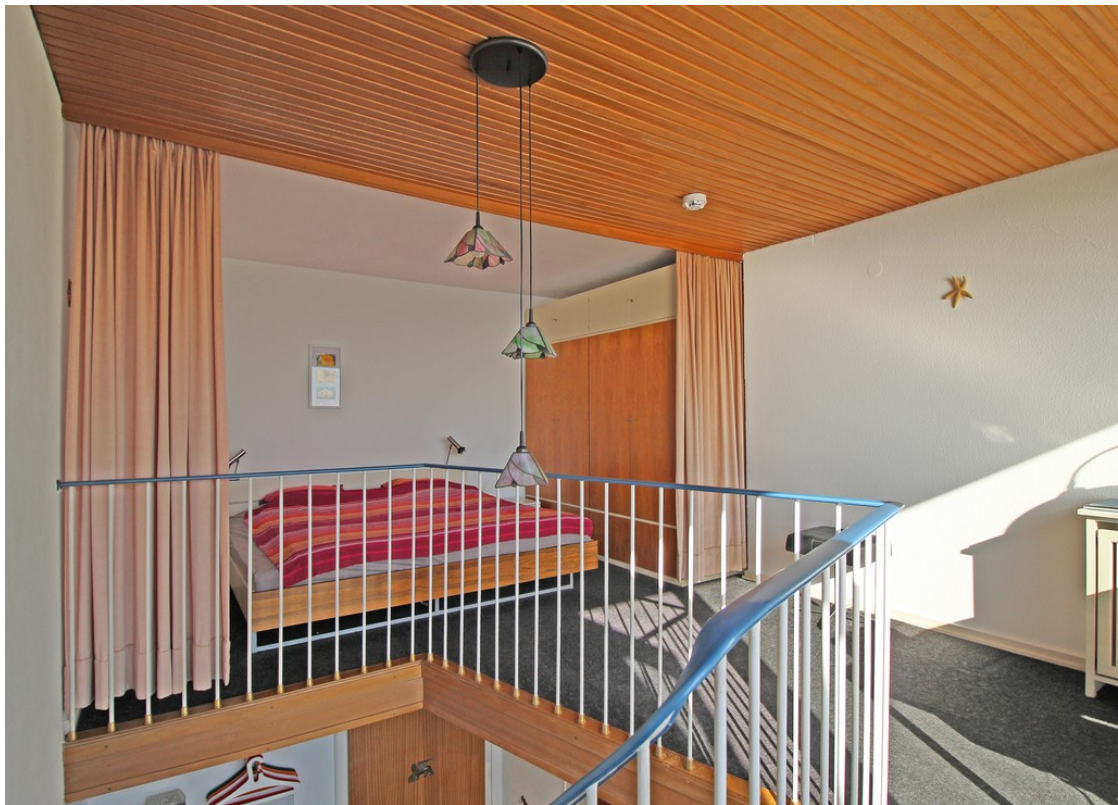
Schlafbereich in der 2. Wohneb