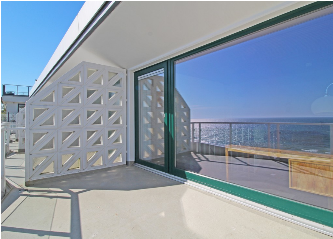
Balkon der 2. Wohnebene