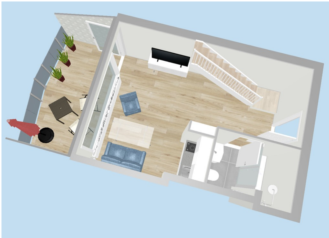
Grundriss 3 D Etage I