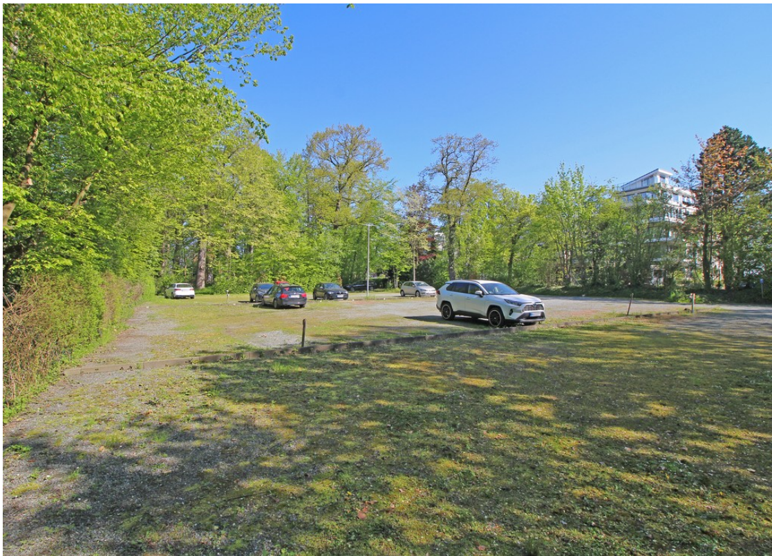
Parkplatz des Hauses