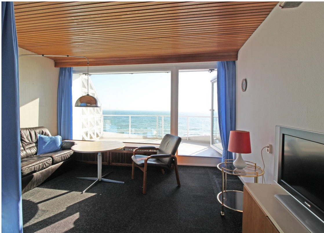
Wohnbereich + Balkon in der 1.