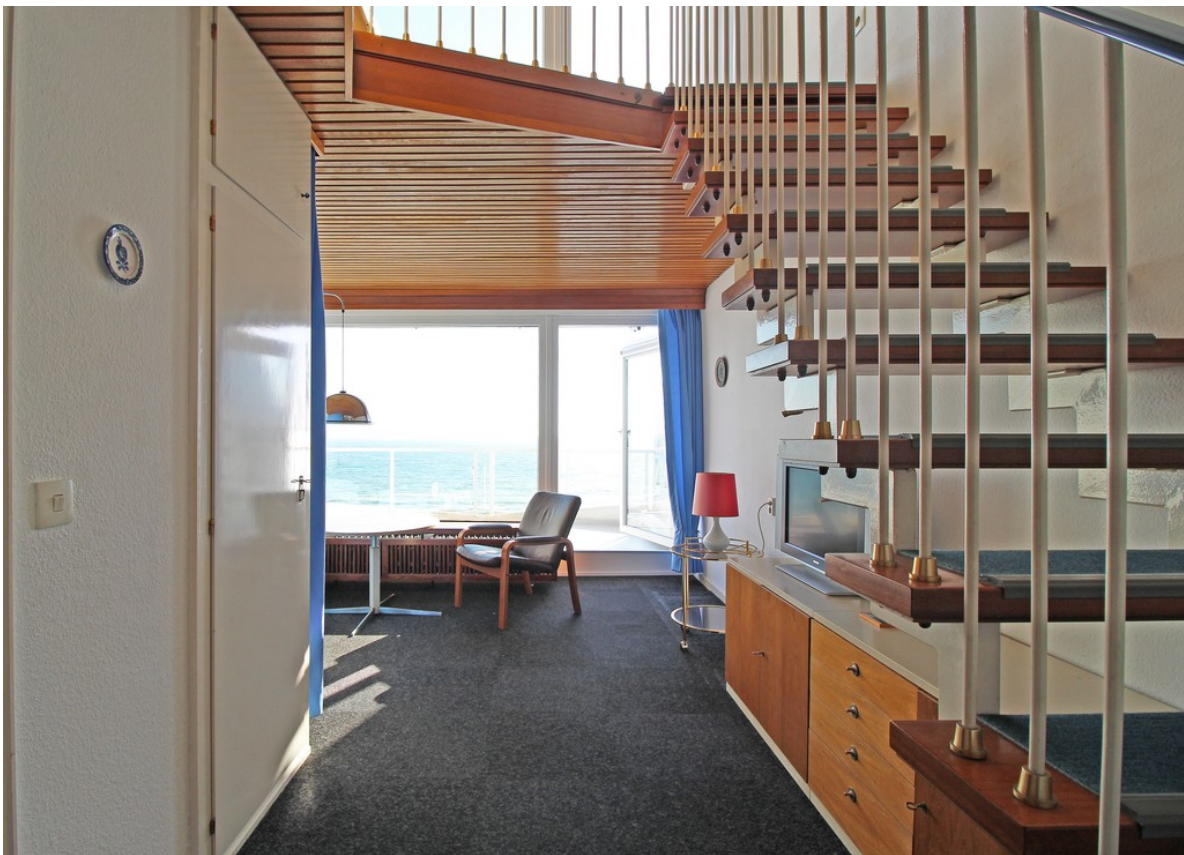
Eingangsbereich in der 1. Wohn