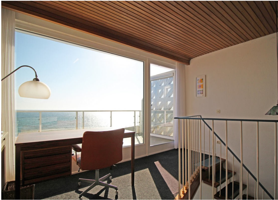
Arbeitsbereich + Balkon der 2.