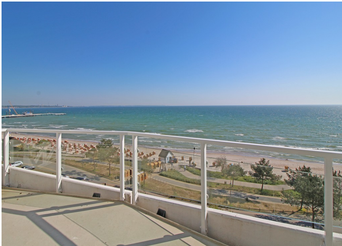
Blick vom Balkon der 1. Wohneb