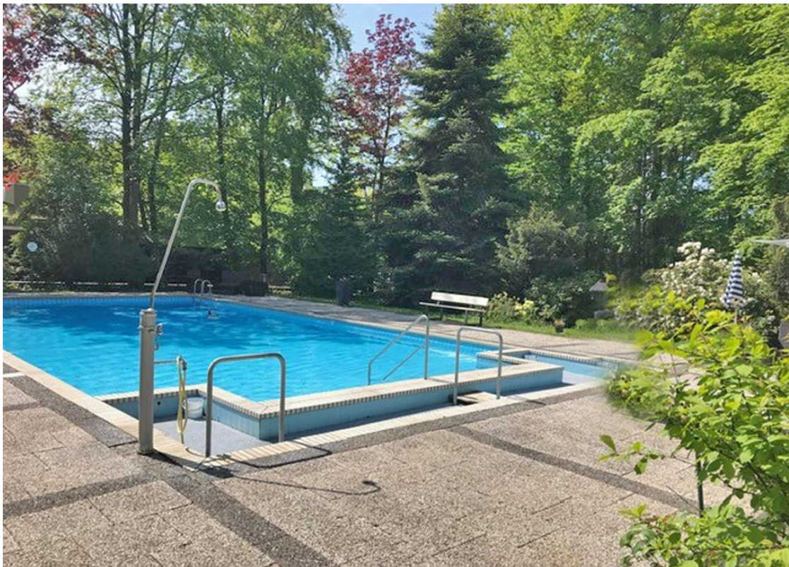
Swimmingpool im Garten