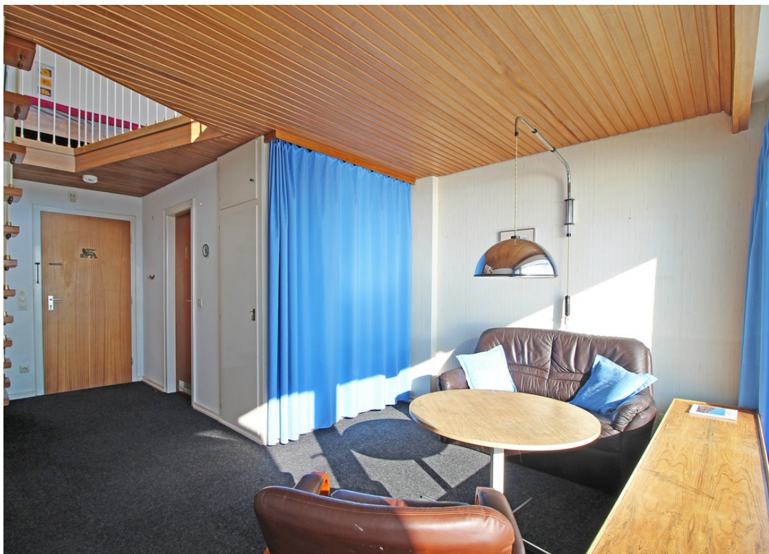
Wohnbereich in der 1. Wohneben