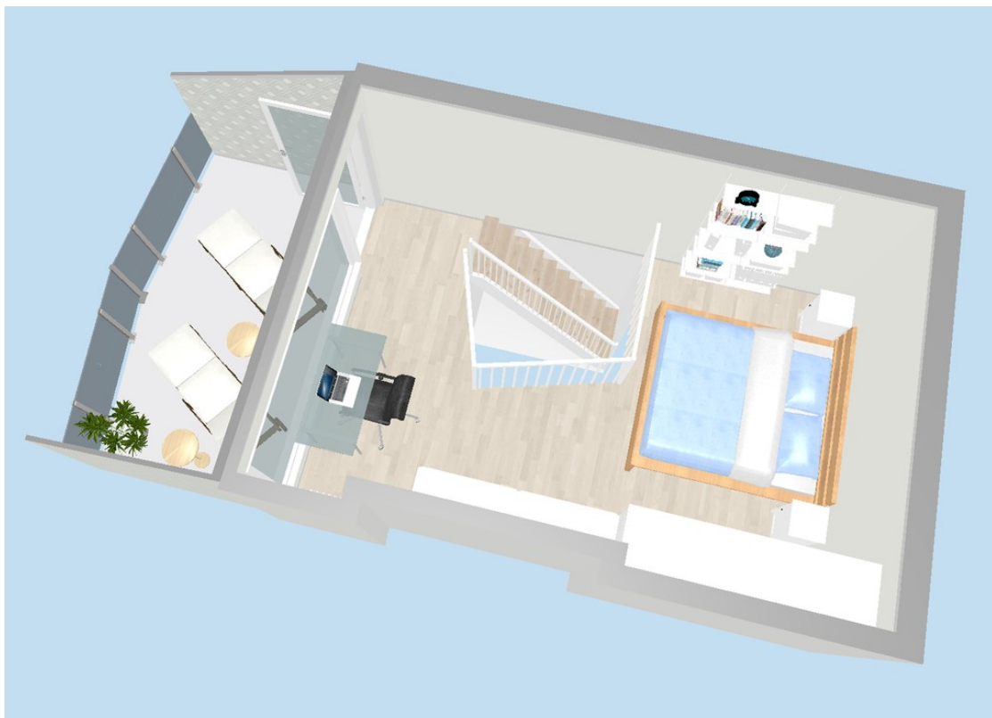
Grundriss 3 D Etage II