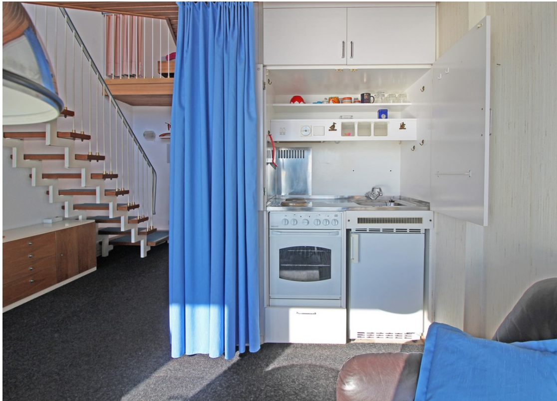
Pantry-Küche in der 1. Wohnebe