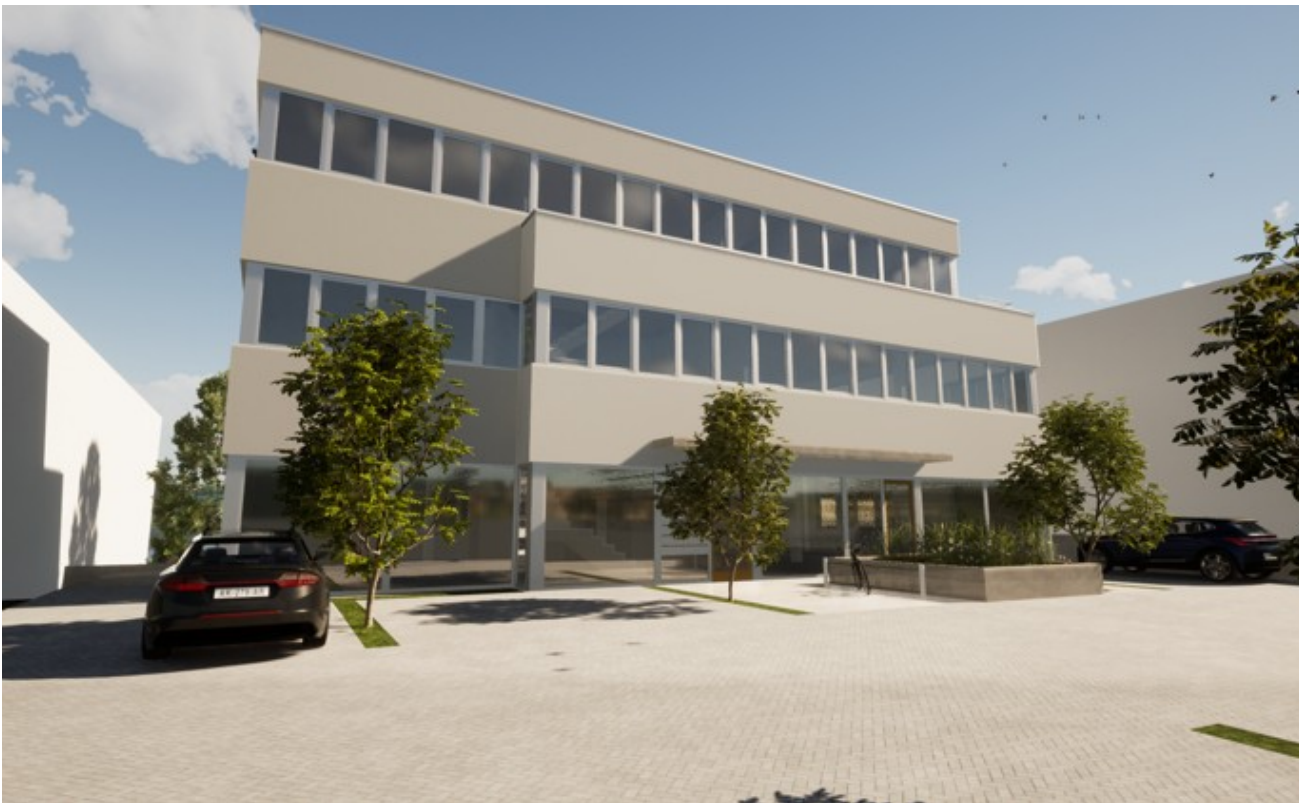
ANSICHT 2 (1)