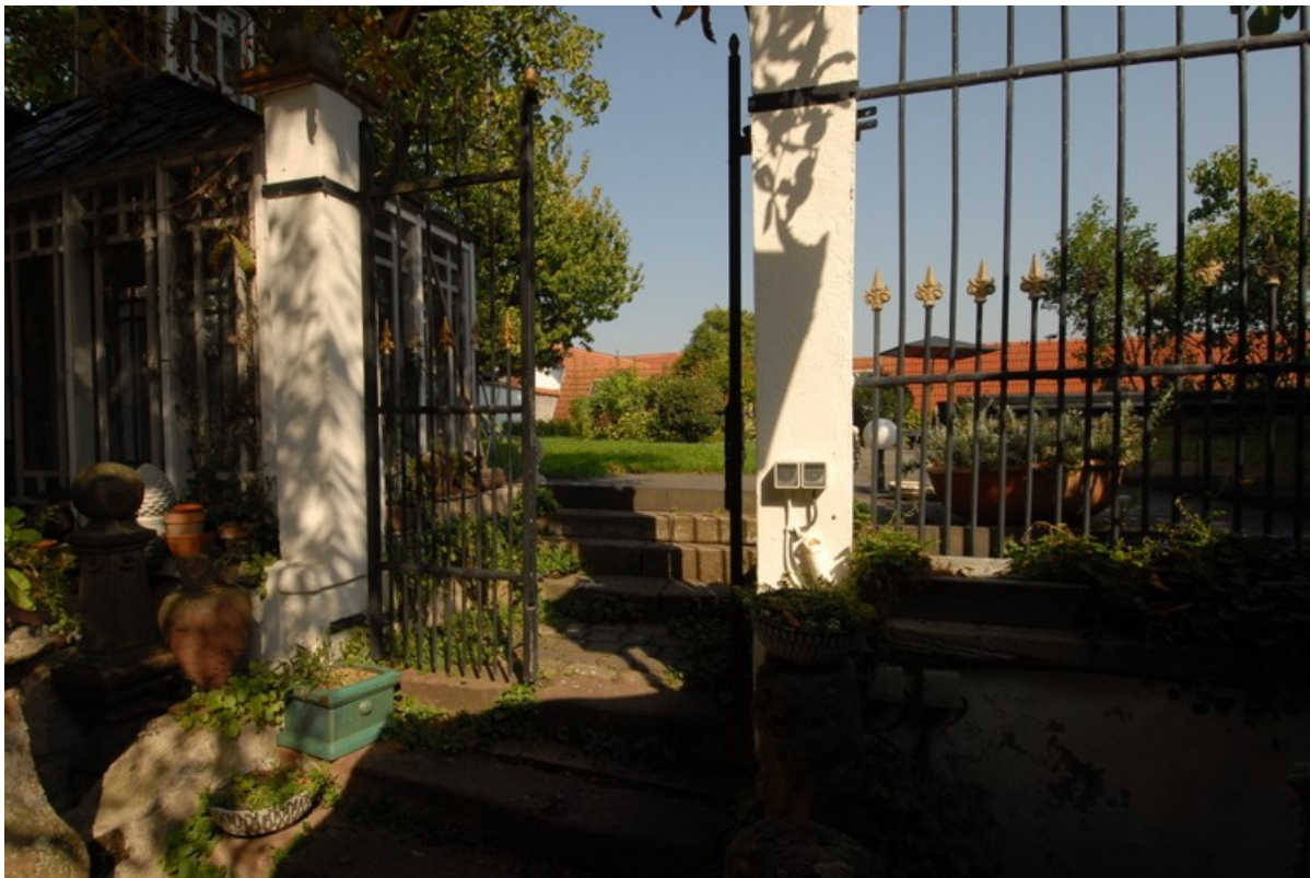
TOR ZUM GARTEN