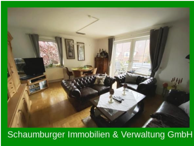
Schaumburger Immobilien & Verwaltung GmbH