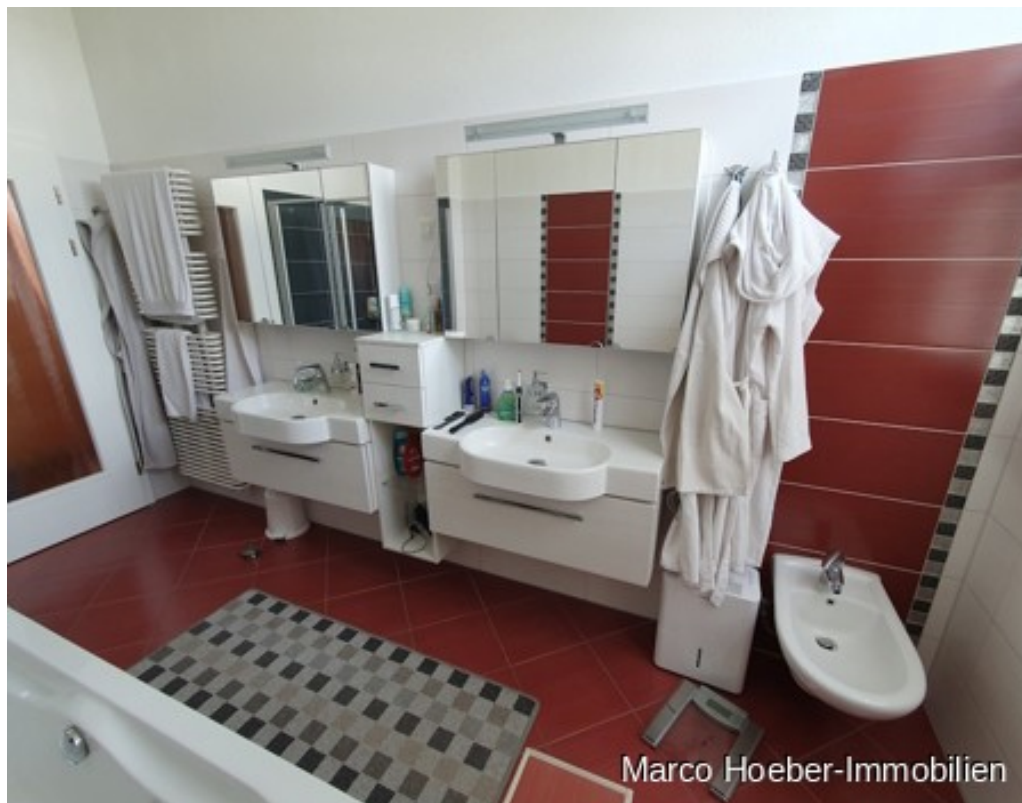
EG Bad WT