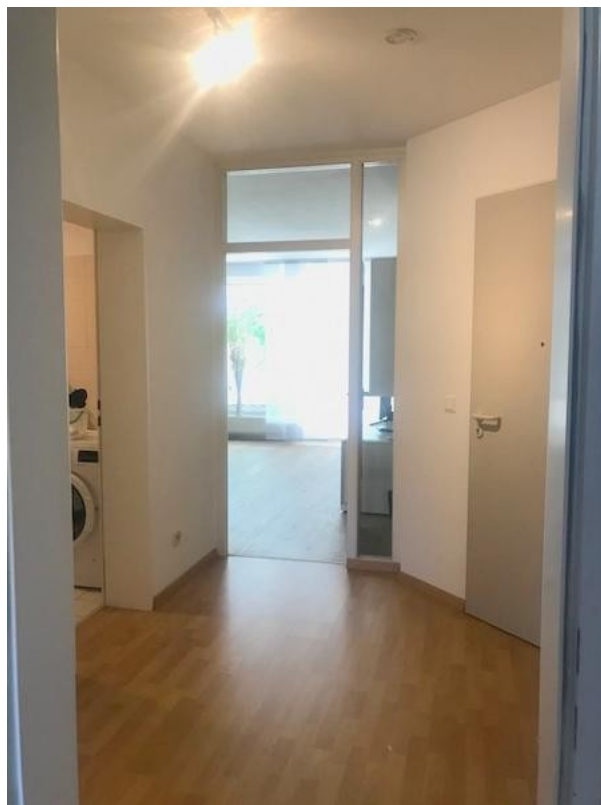
Zentraler Flur mit Abstellraum