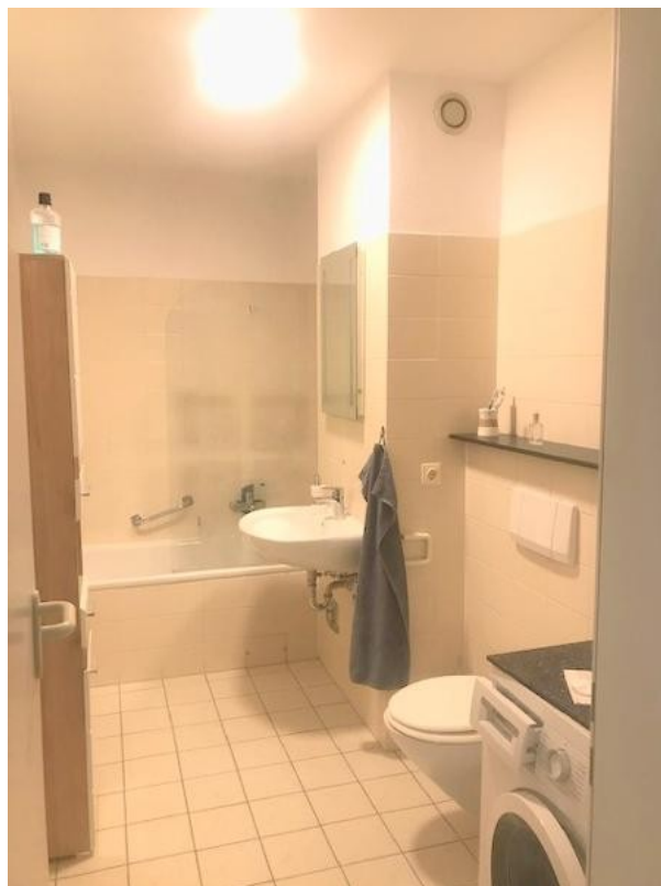
Bad mit Wanne und Stellplatz für