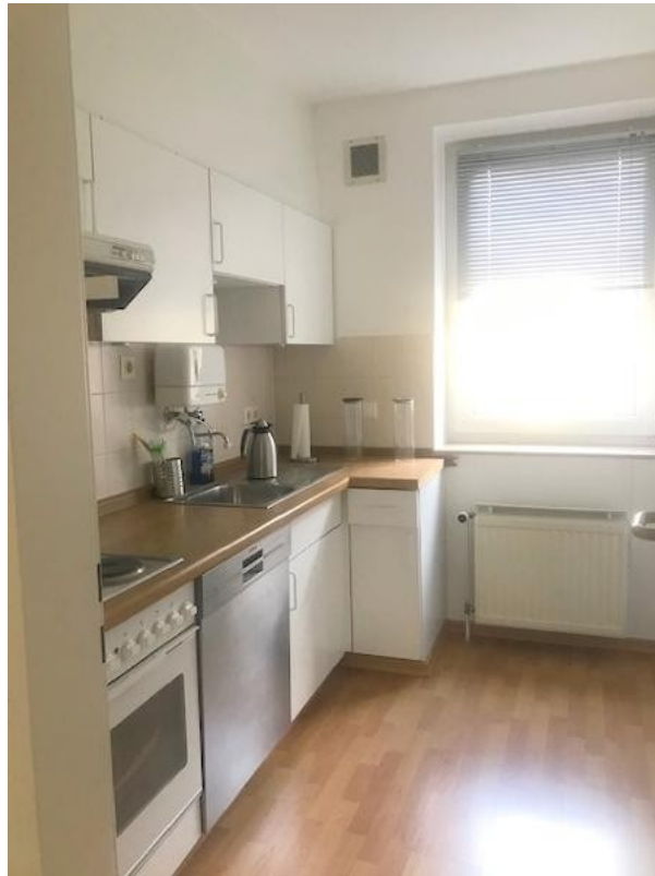
Küche mit Abluftoption