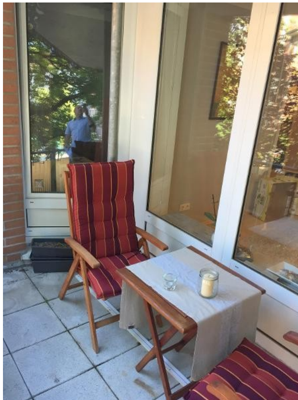
Platz für entspannten Kaffee z