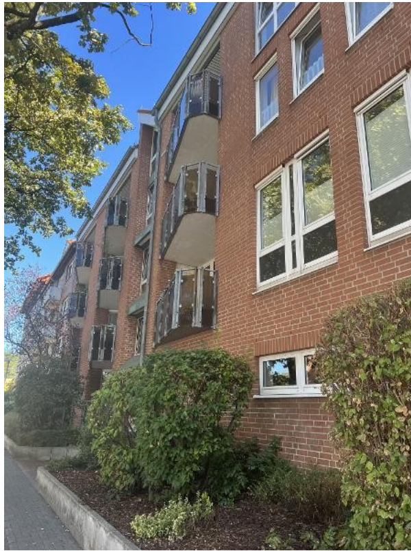
Ruhige Seitenstraße mit Nahver