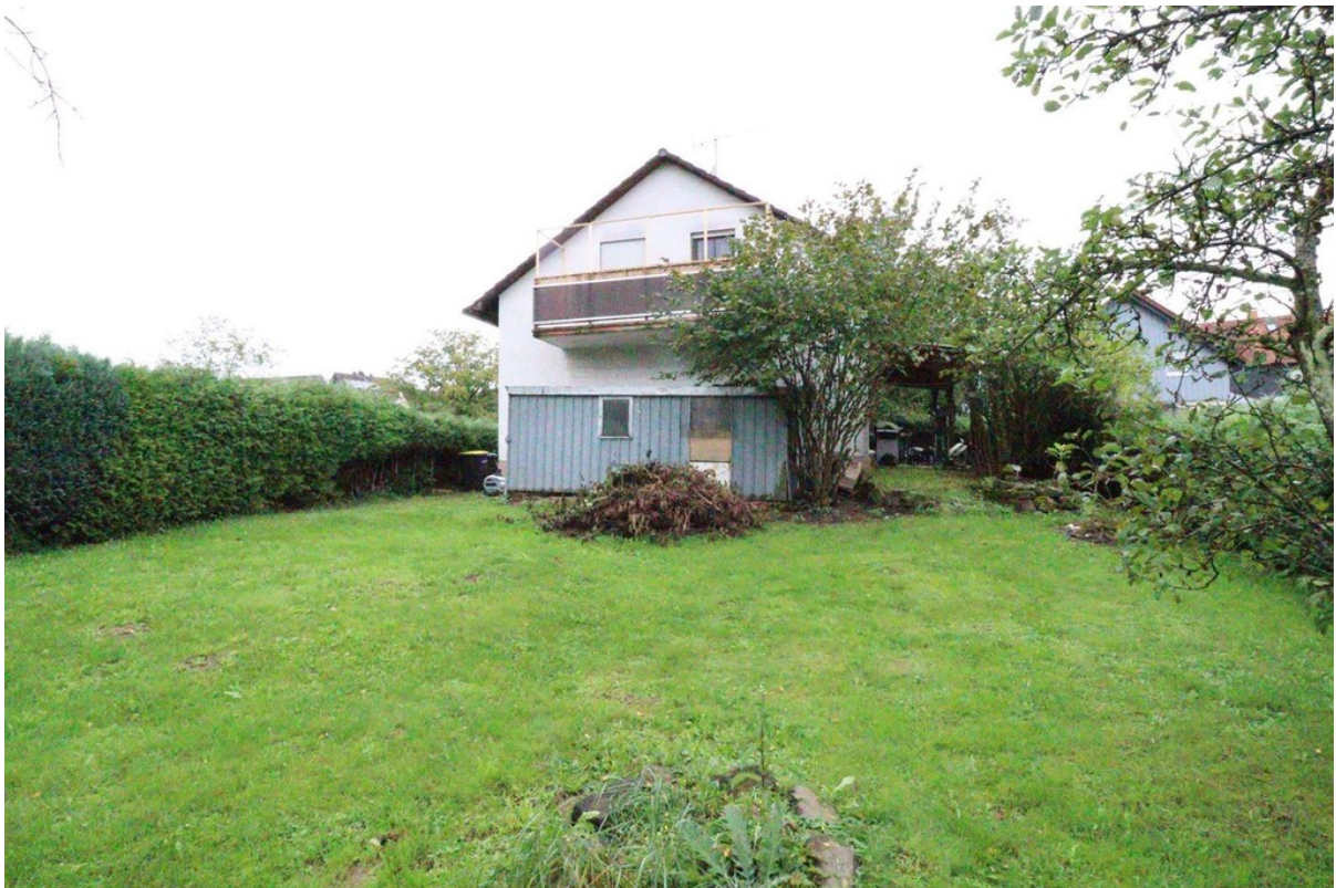
Hausrückseite - Garten