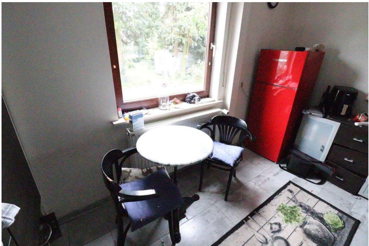
Küche - Bild 2