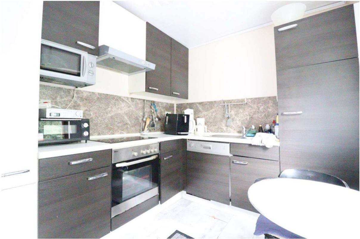
Küche - EBK