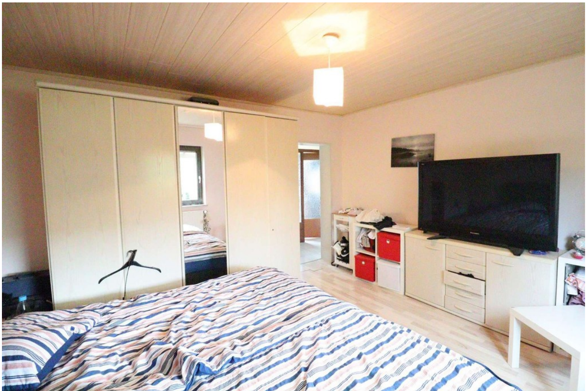
Schlafzimmer - Bild 2