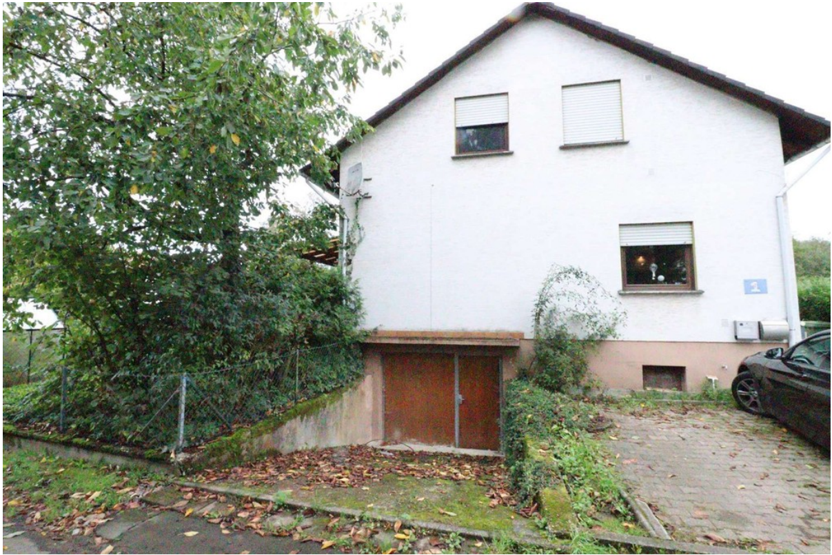
Abfahrt in die Garage