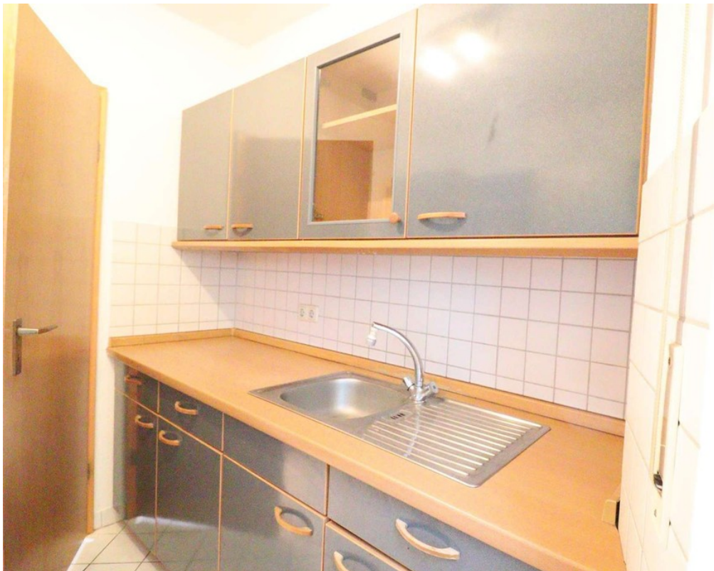
Küche - EBK - Bild 2