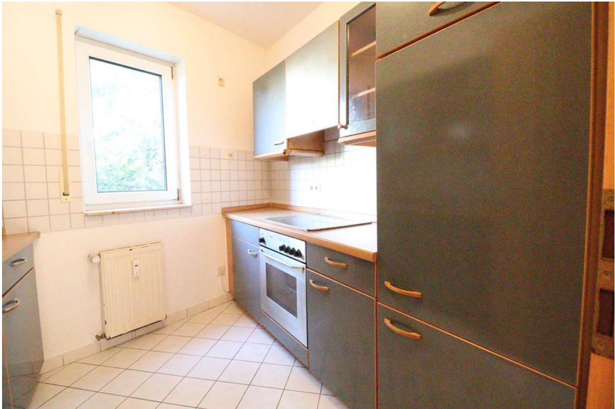
Küche - EBK - Bild 1