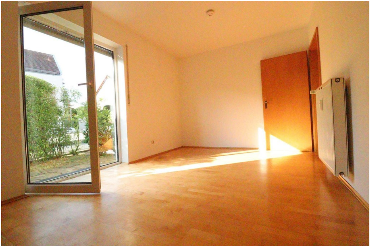
Wohnzimmer - Bild 2