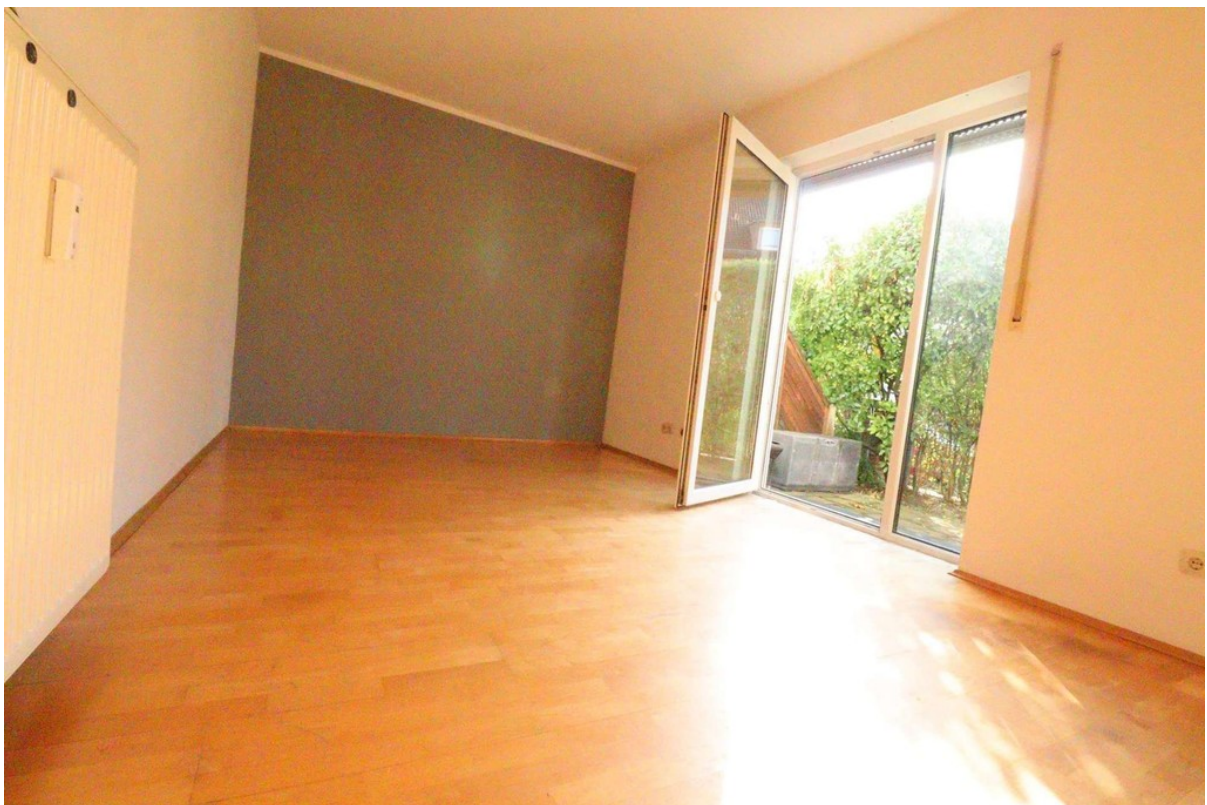
Wohnzimmer - Bild 1