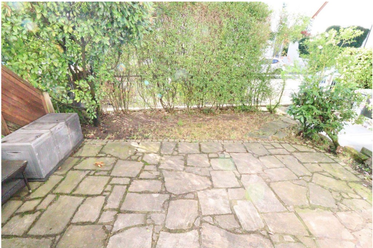
Terrasse - Gartenanteil