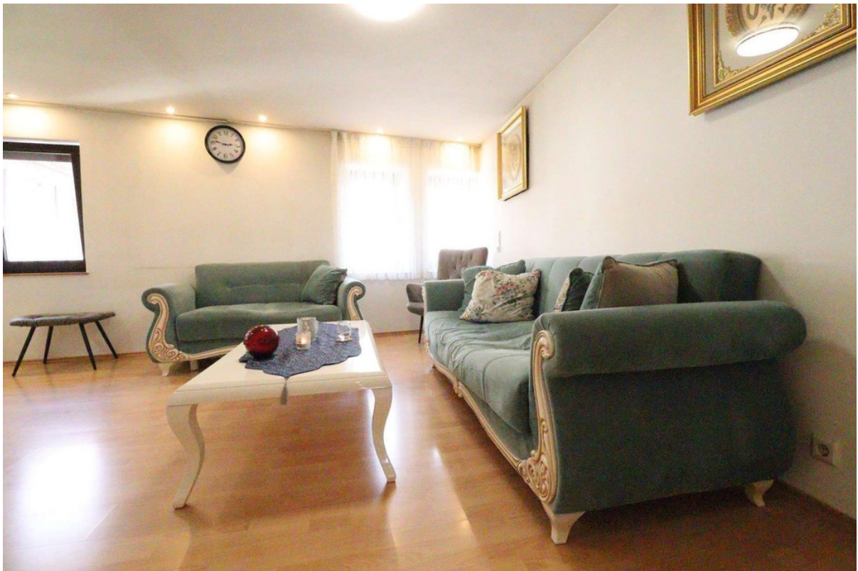
Wohnzimmer - Bild 1 - OG