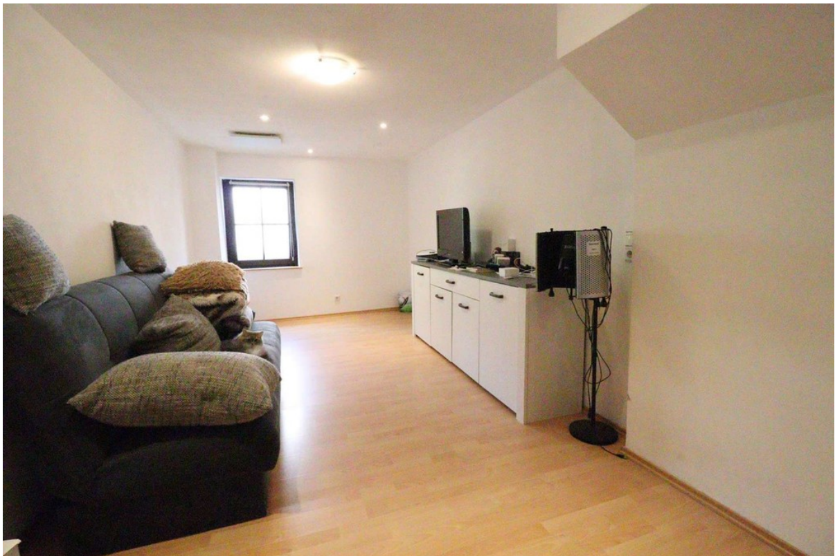
Zimmer - EG