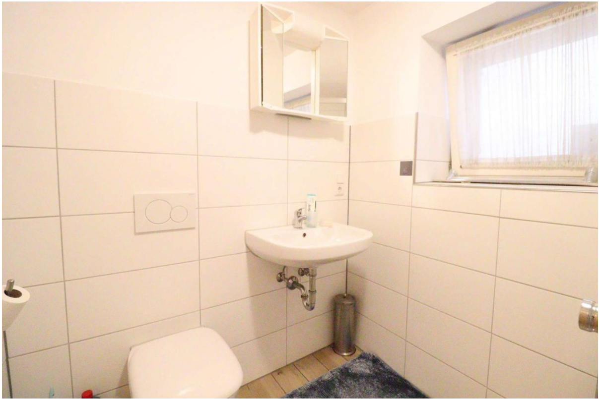
Duschbad - Bild 2 - EG