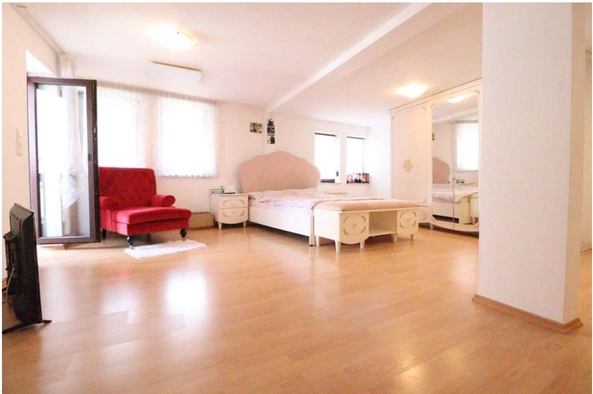
Schlafzimmer - Bild 1 - 2. OG