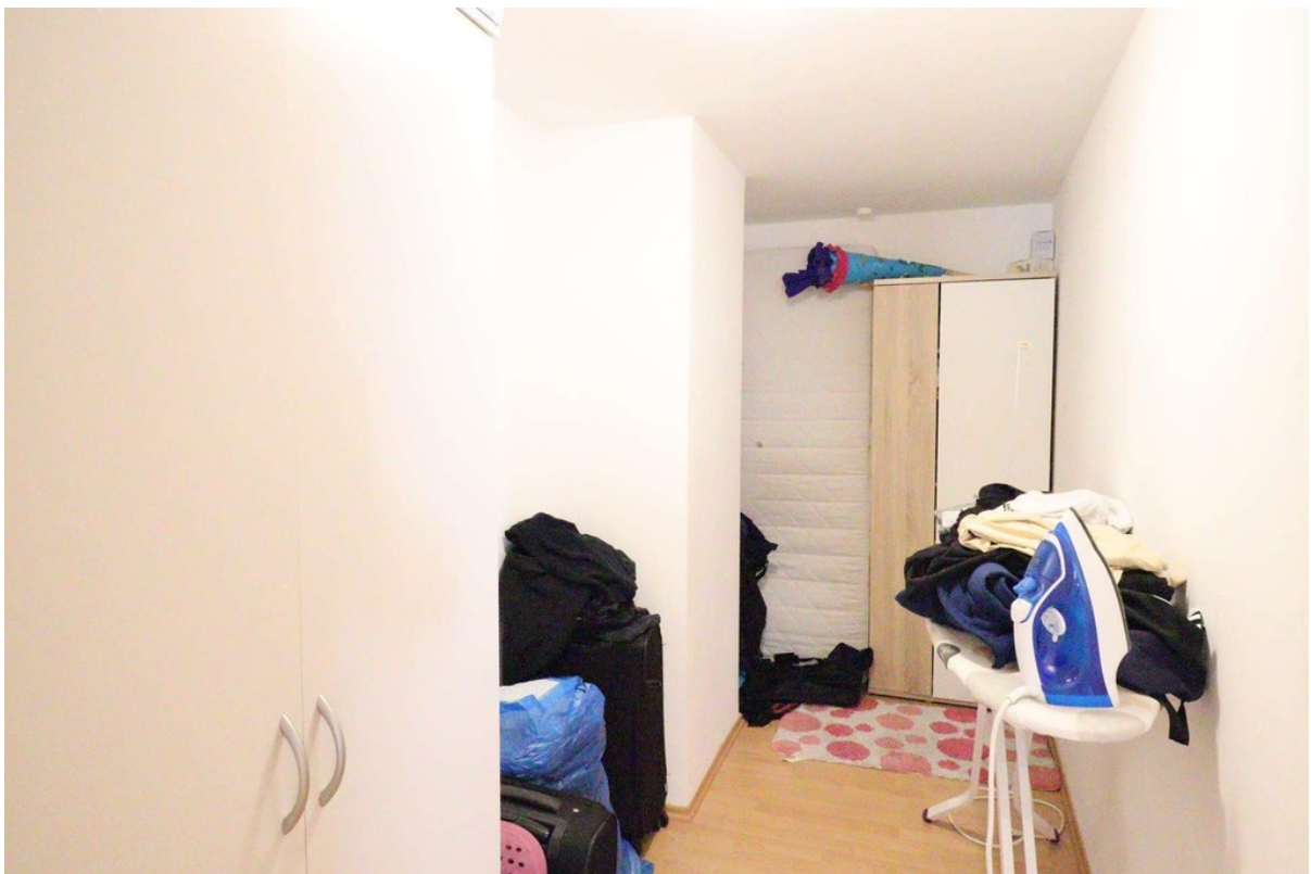
Ankleidezimmer - DG