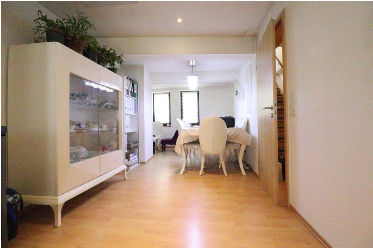
Esszimmer - OG