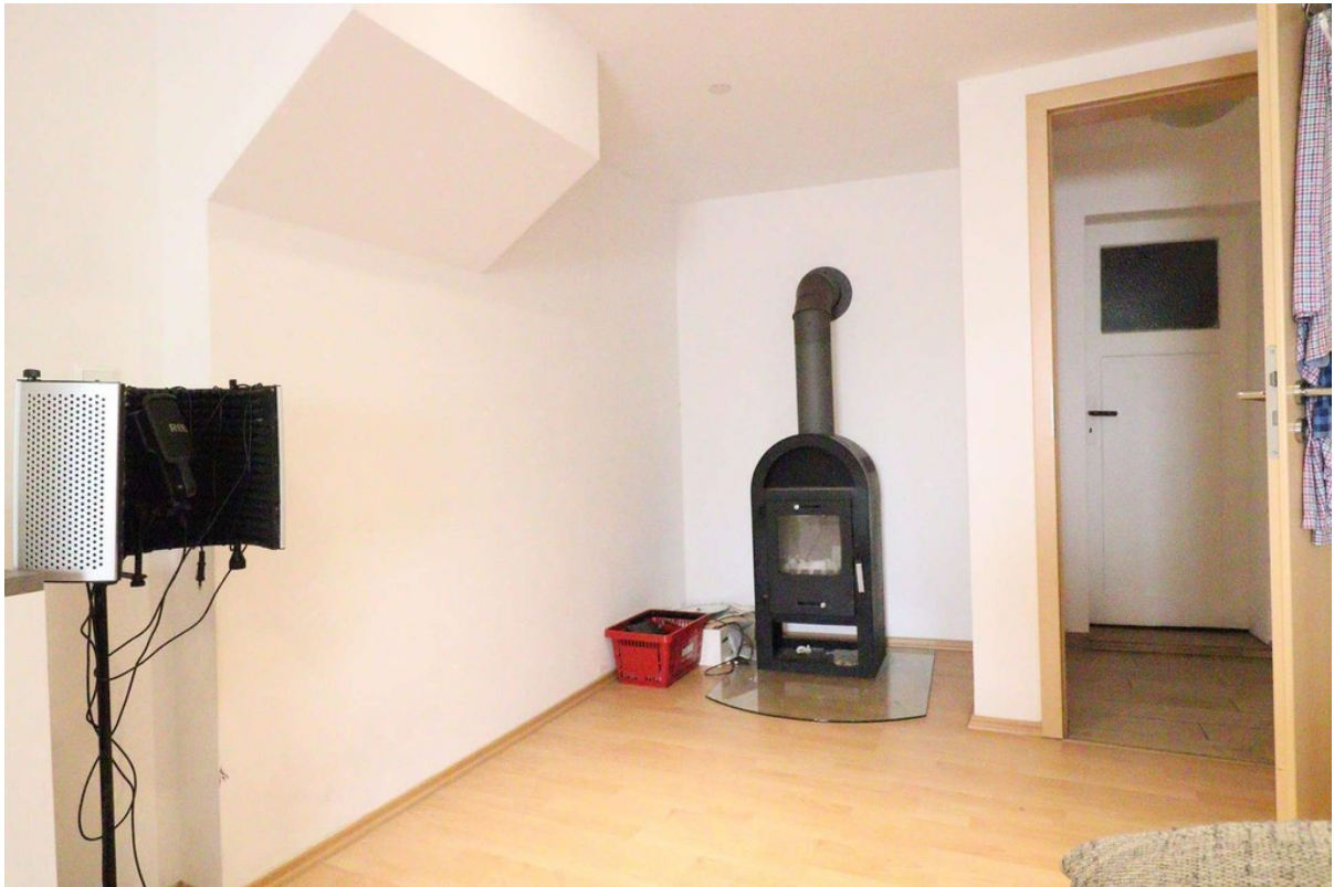
Zimmer - Bild 2 - EG