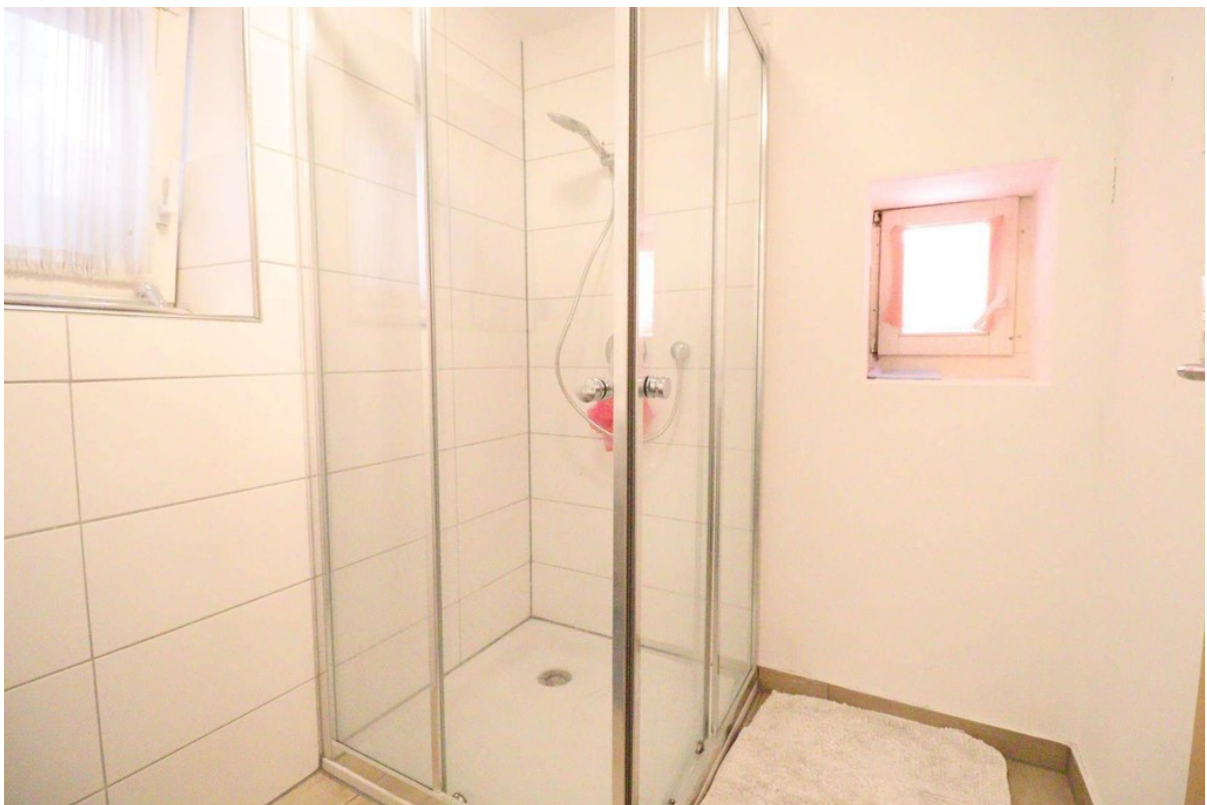
Duschbad - EG