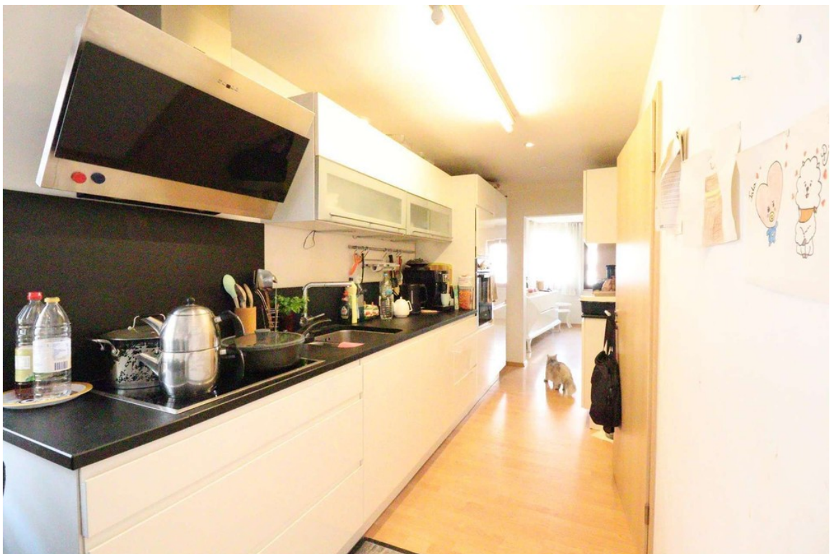
Küche - EBK - OG