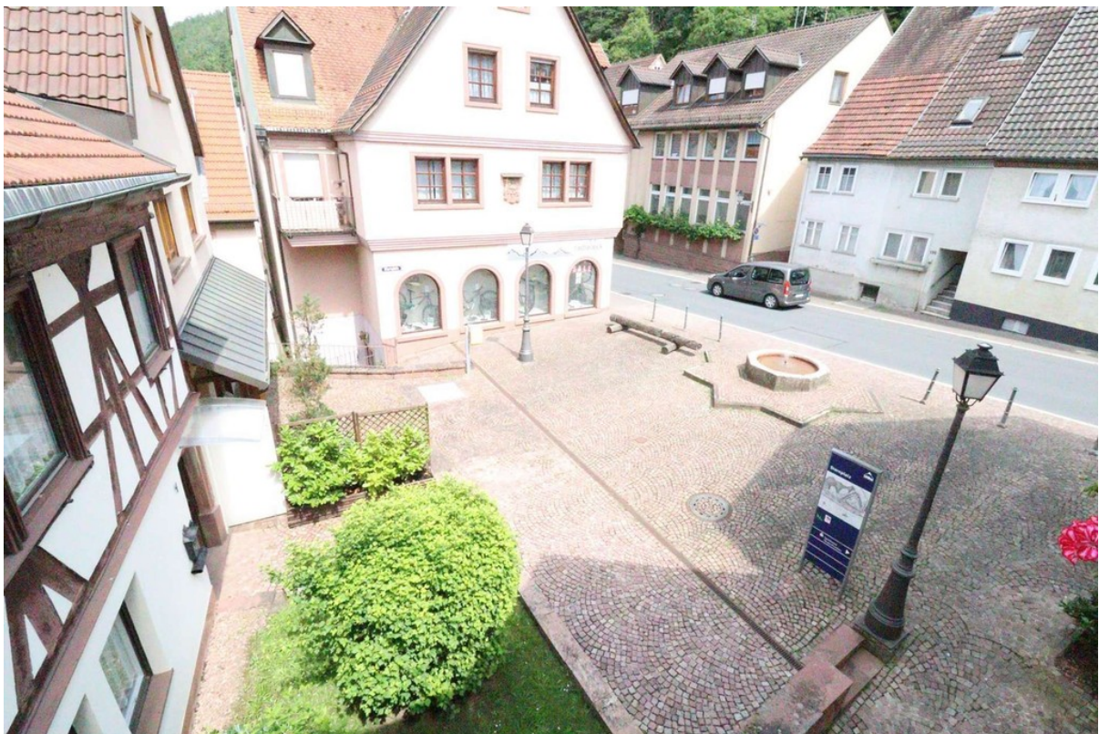
Blick auf den Dorfplatz - vom