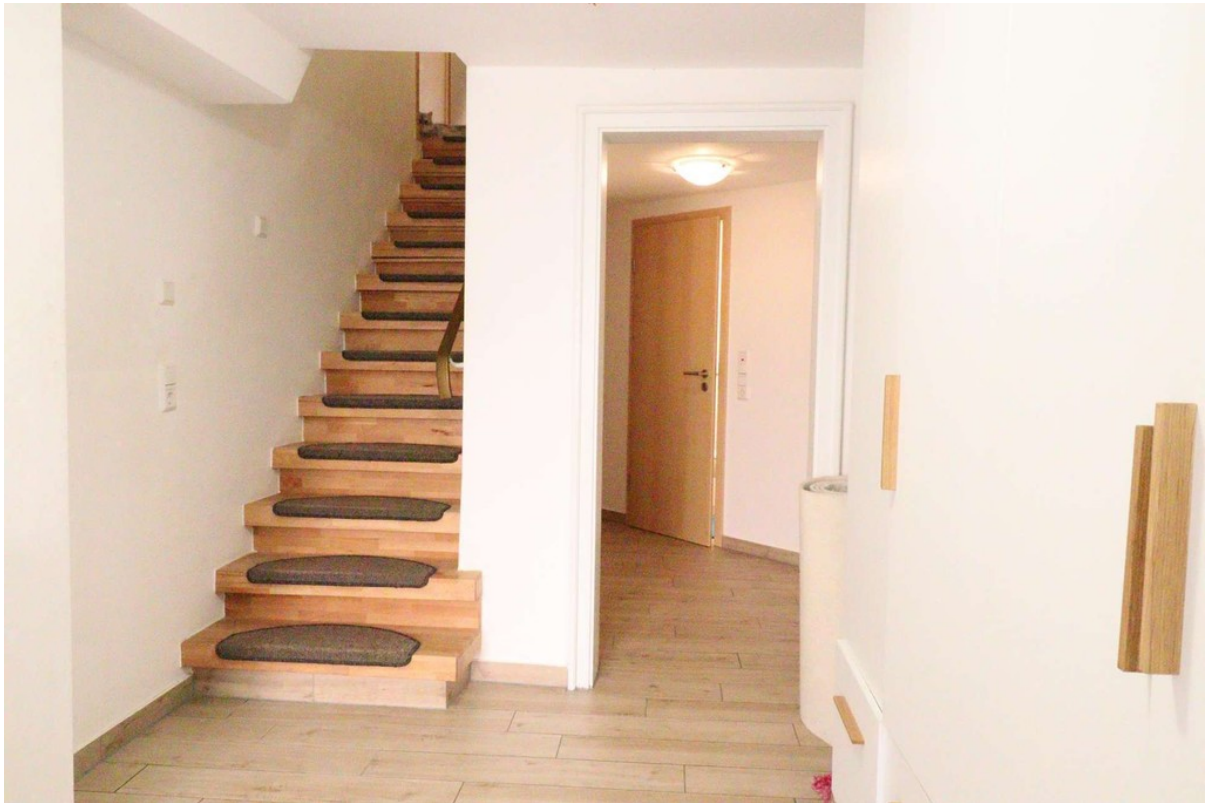
Flur 1 - EG