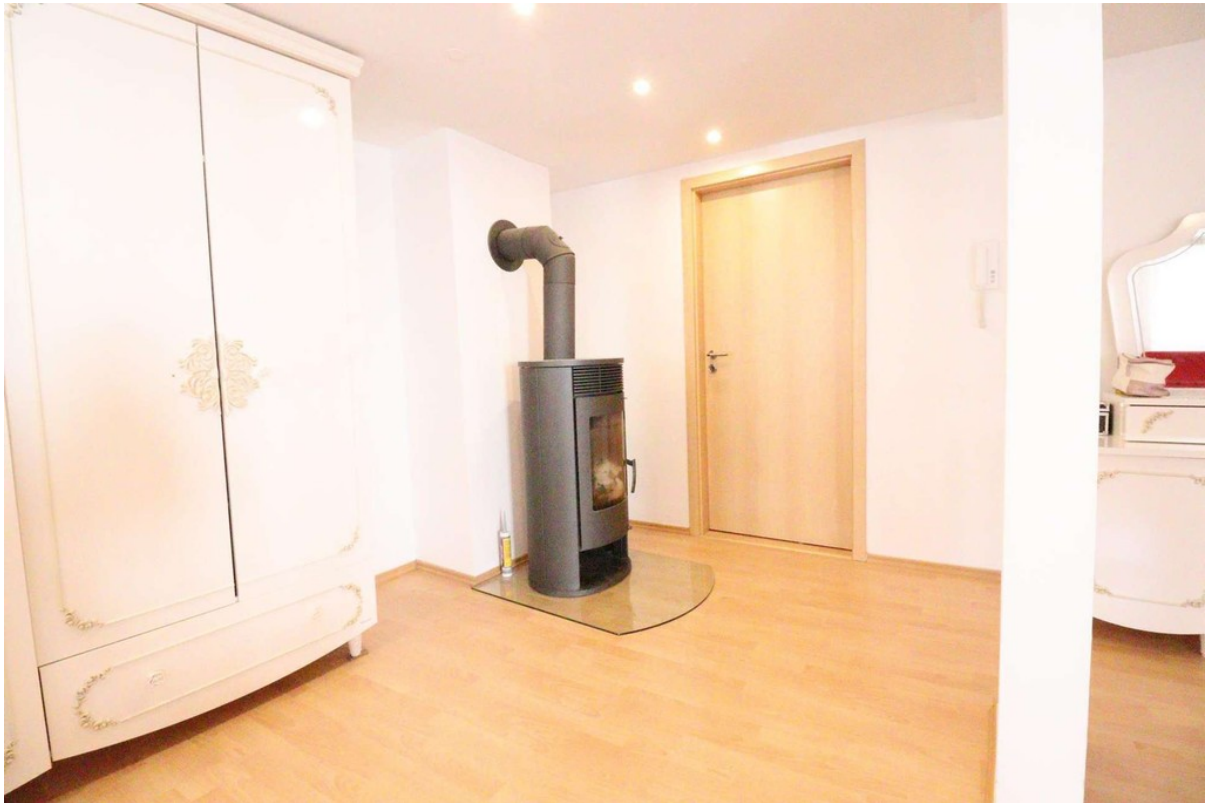
Schlafzimmer - Bild 2 - 2. OG