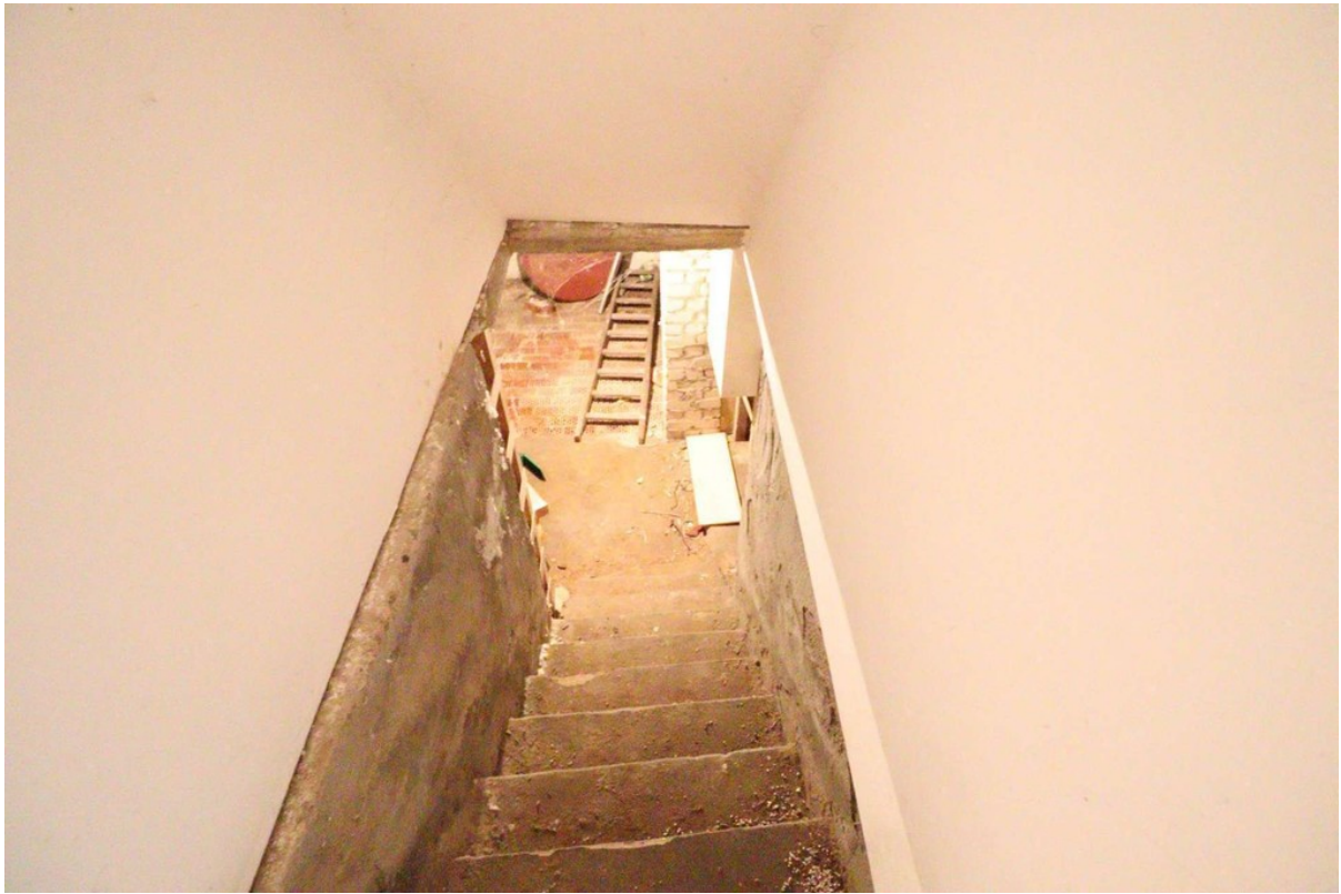
Kellerabgang - Gewölbekeller