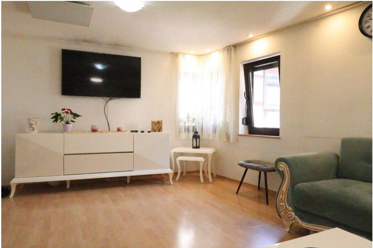
Wohnzimmer - Bild 2 - OG