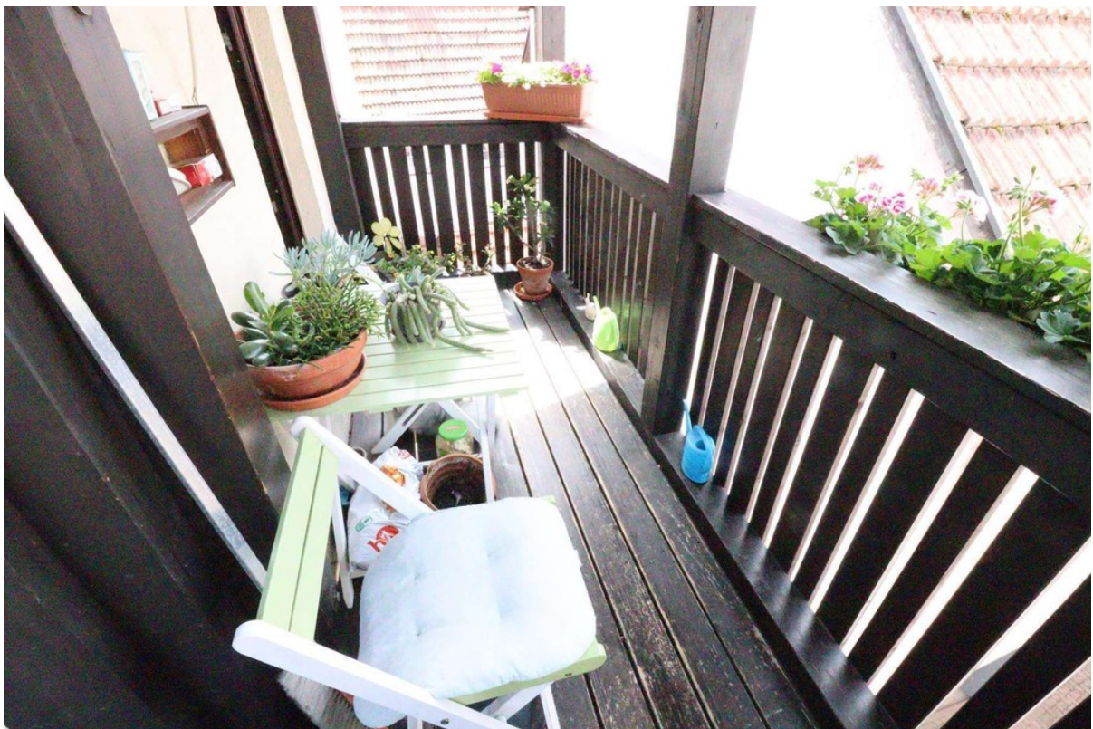
Balkon - Bild 2