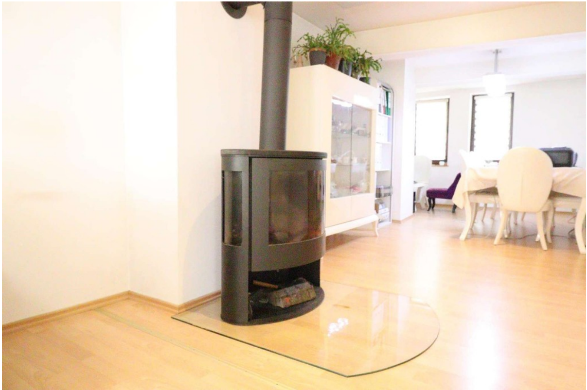
Kamin - Wohnzimmer - Esszimmer