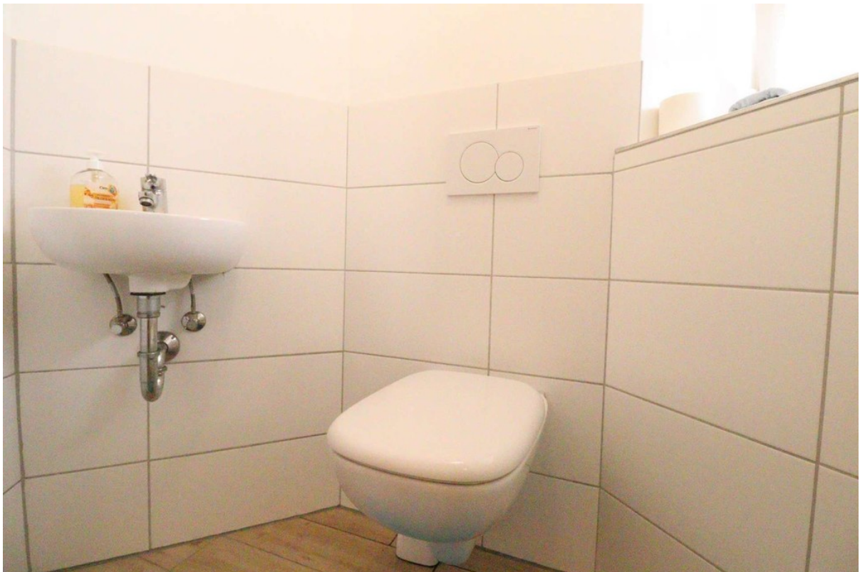
Gäste-WC - EG