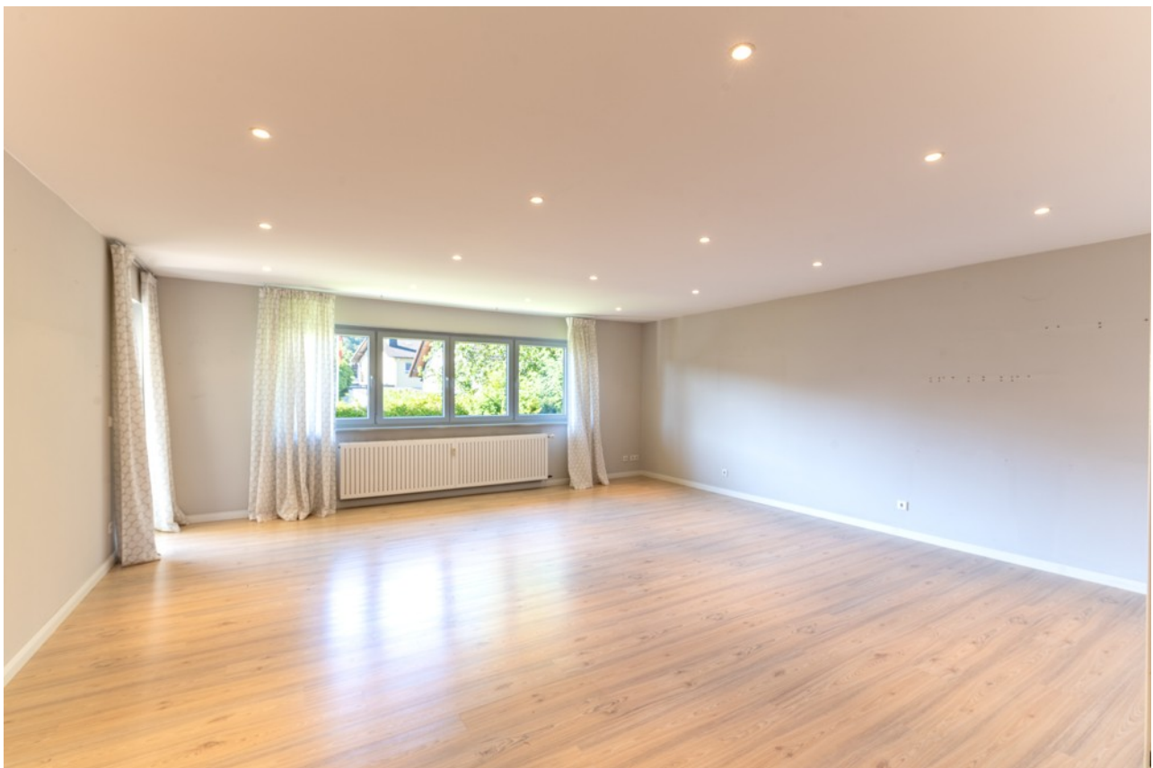
Raum 2 (Wohnzimmer)