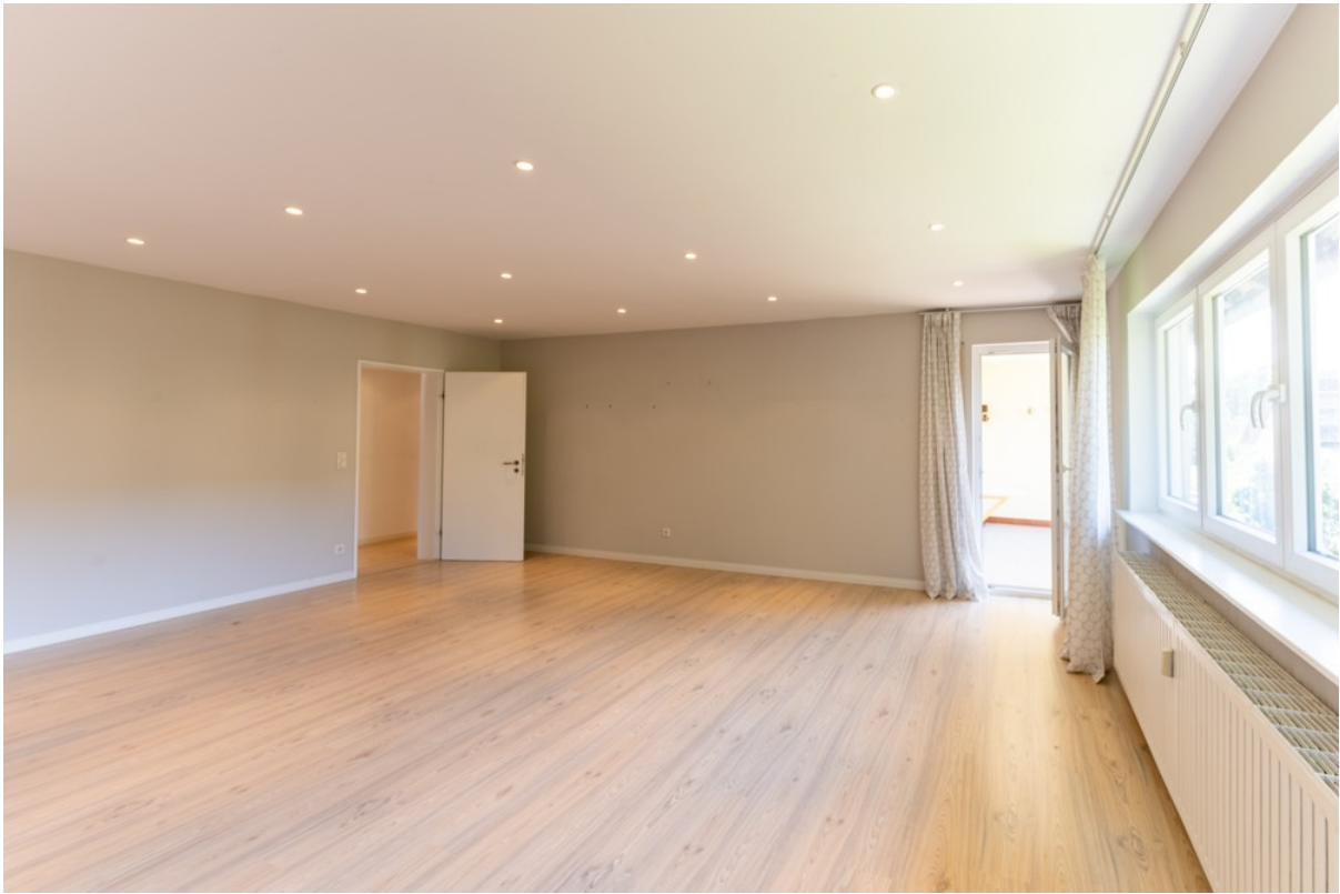
Raum 2 (Wohnzimmer)