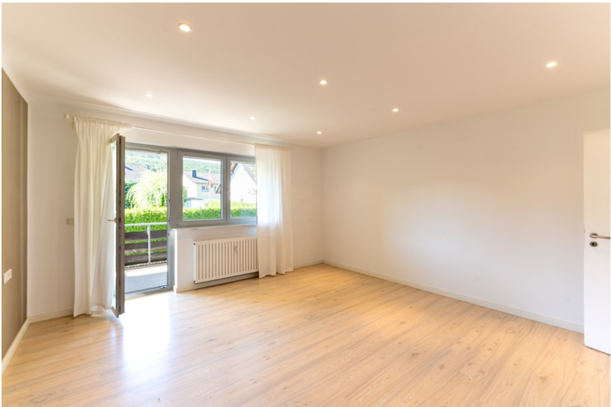
Raum 1 (Schlafzimmer)