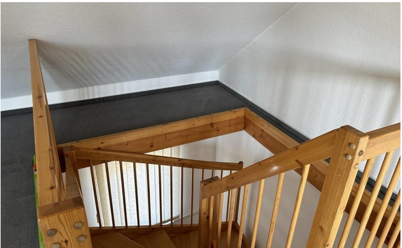
Treppe vom Obergeschoss uns Da