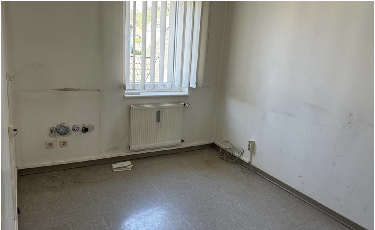
Obergeschoss: kleineres Büro