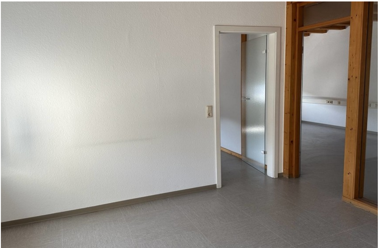
Obergeschoss: Empfang mit Wand