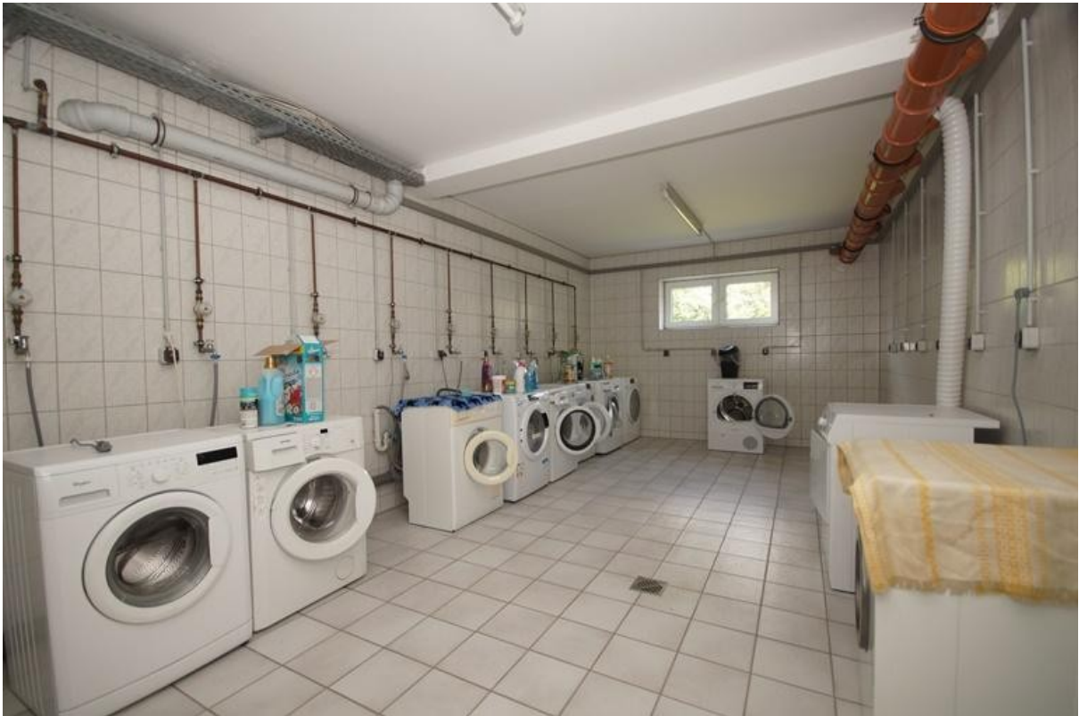
Waschküche im Keller