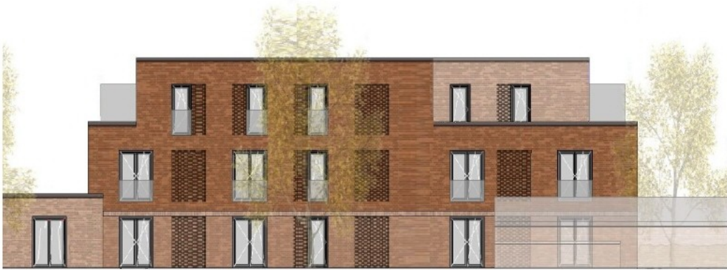
Südansicht, Block I