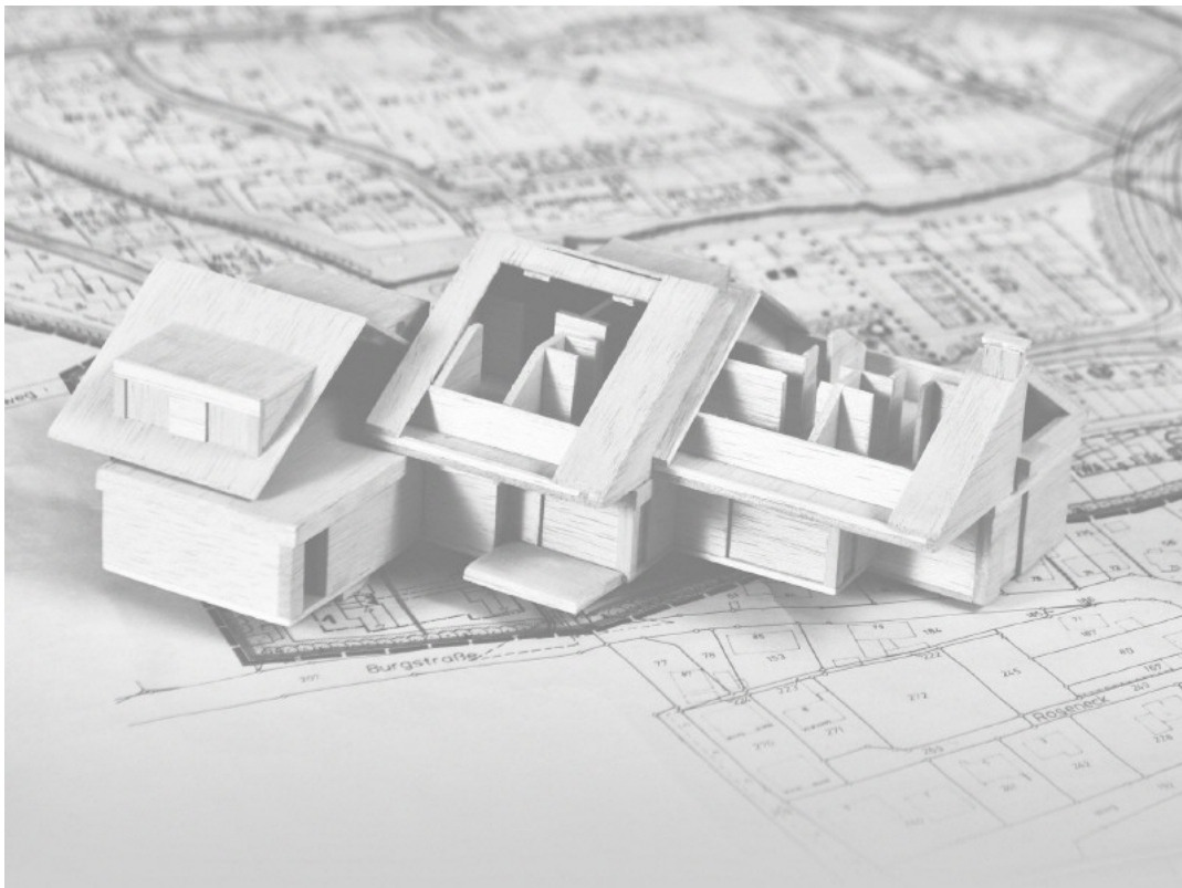
ein spannendes Neubauprojekt