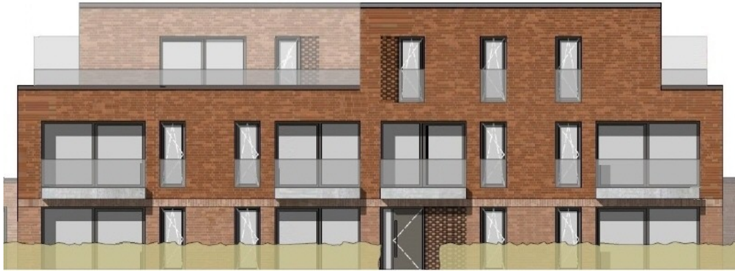
Nordansicht, Block II