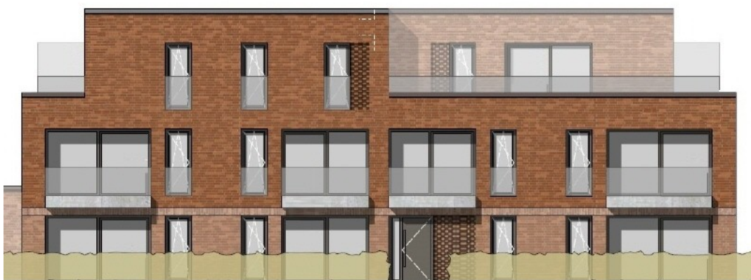
Nordansicht, Block III