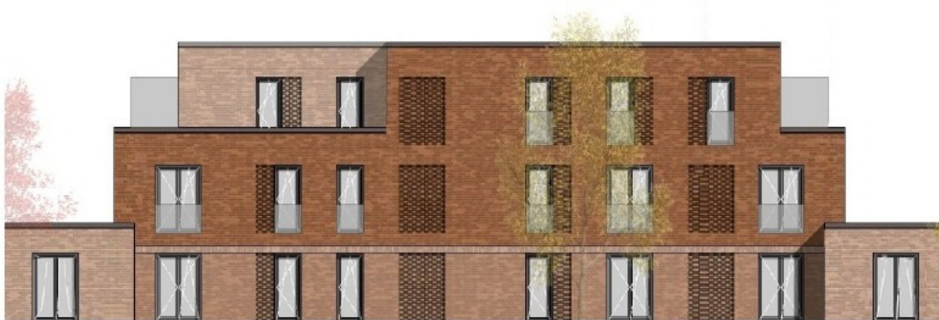
Südansicht, Block II