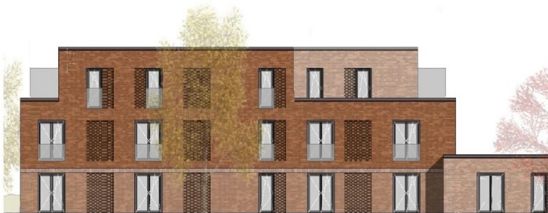
Südansicht, Block III