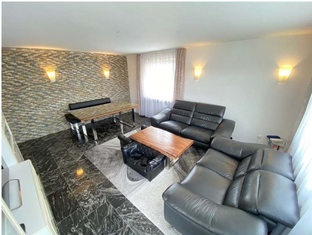
Wohn- u. Essbereich