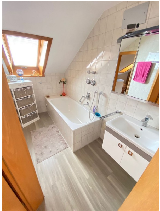
Bad mit Wanne