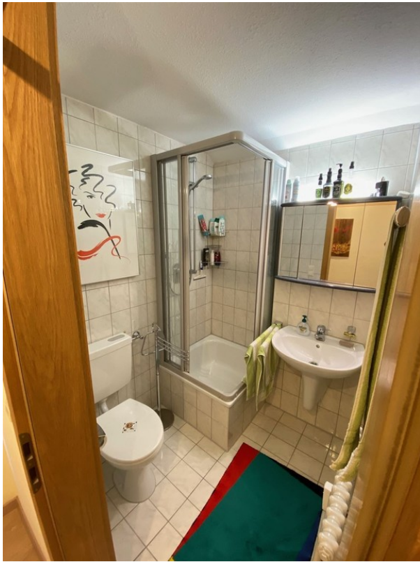
Duschbad / WC