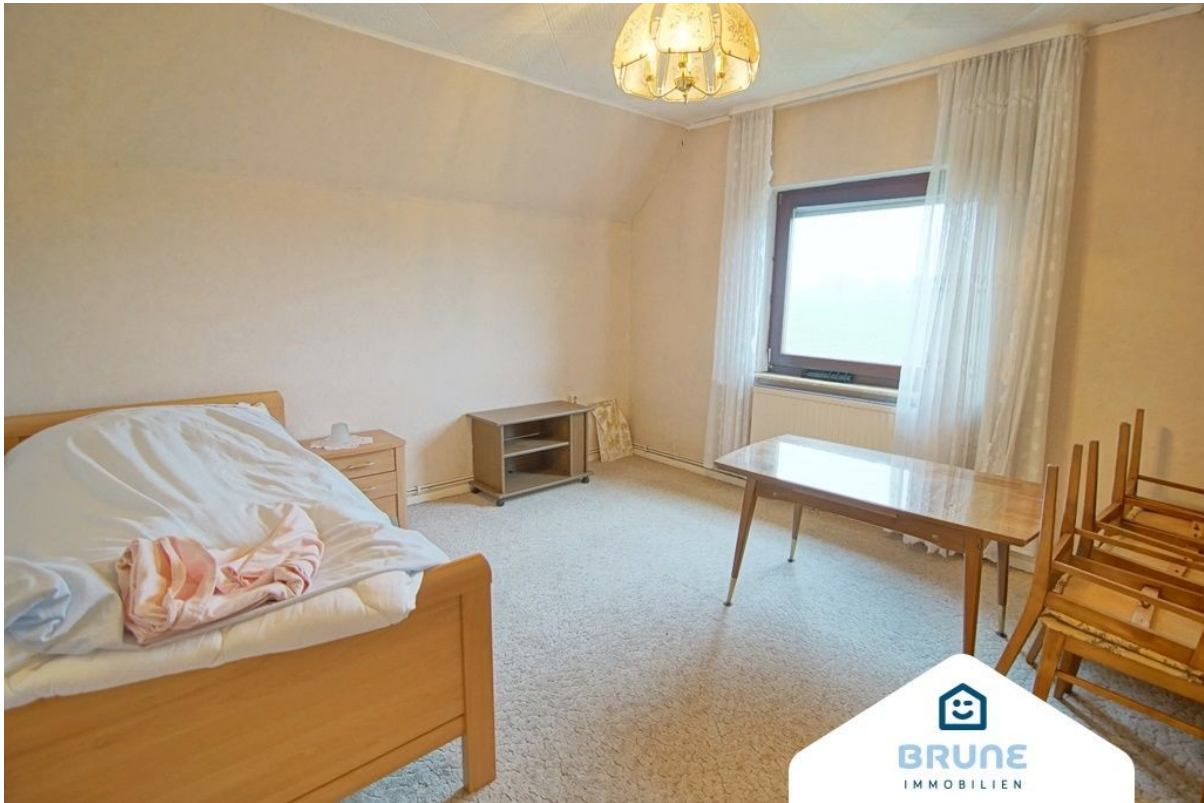
Zimmer im OG