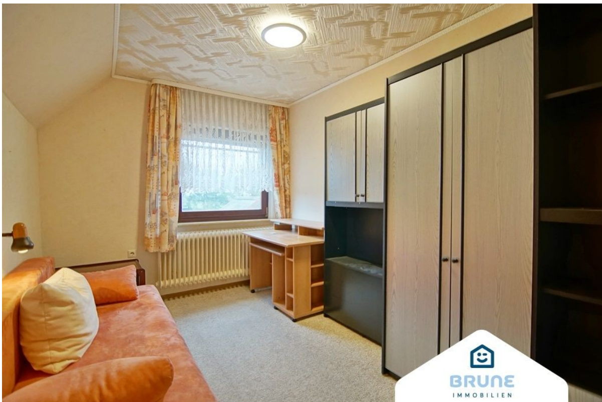
Zimmer im OG