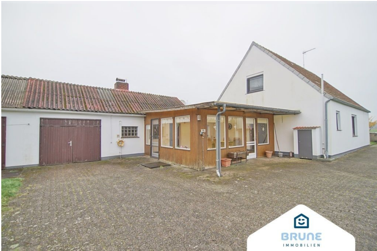
Aussenansicht - Wintergarten