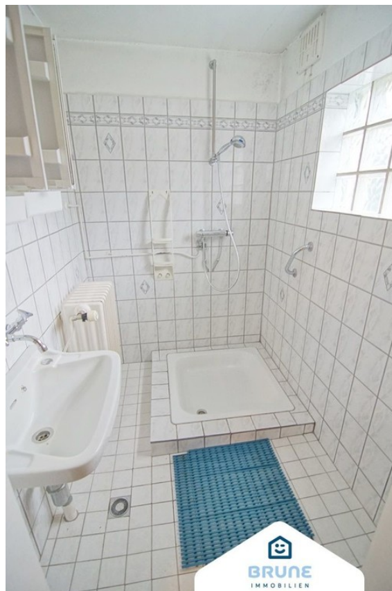
Bad im Nebengebäude