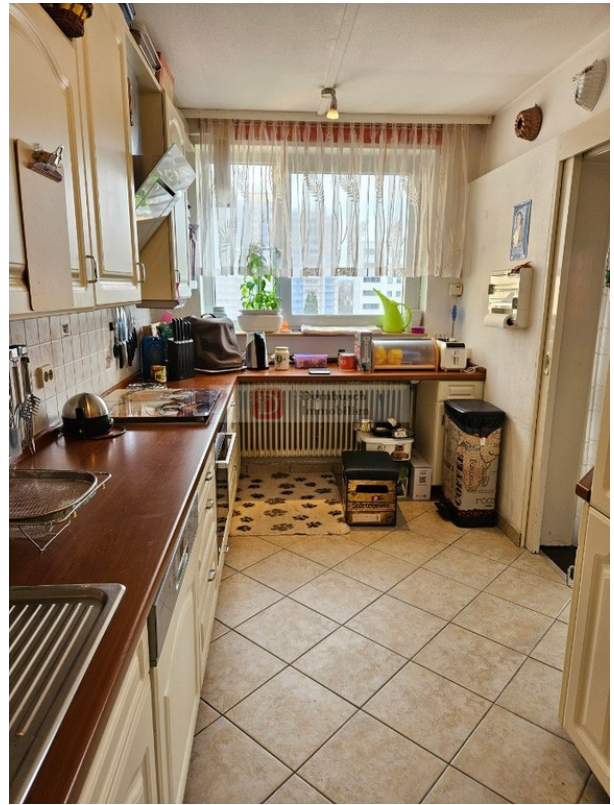
Küche Bild 2