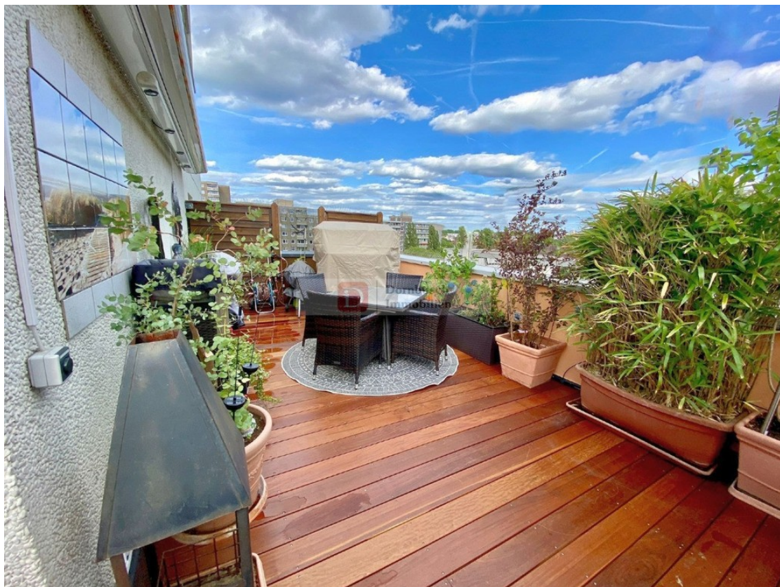
Dachterasse Bild 1