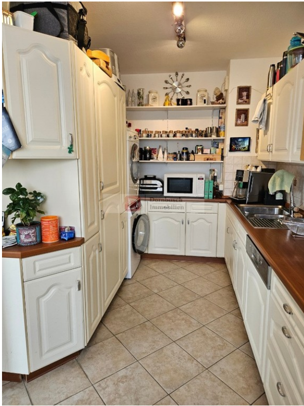
Küche Bild 1