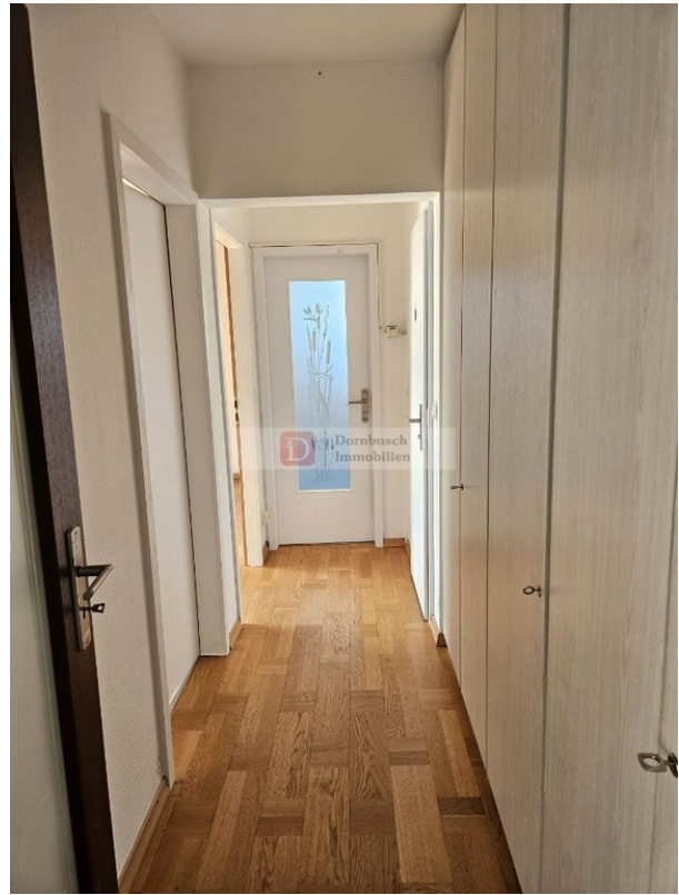
Vorraum - Flur 2