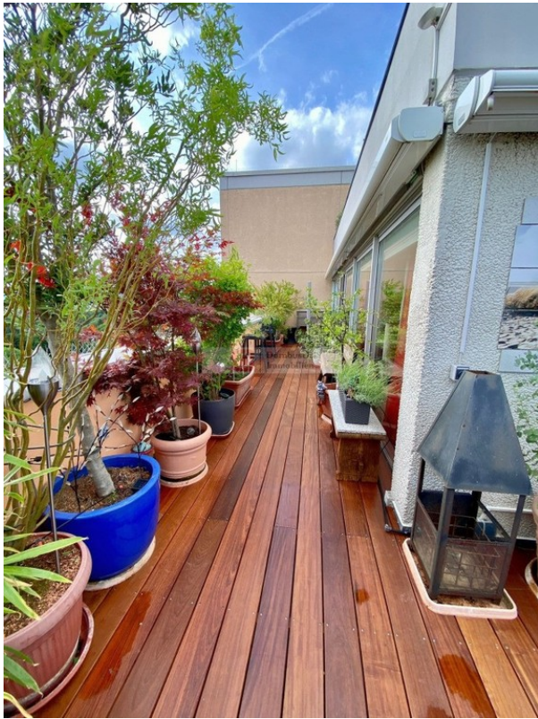
Dachterrasse Bild 3