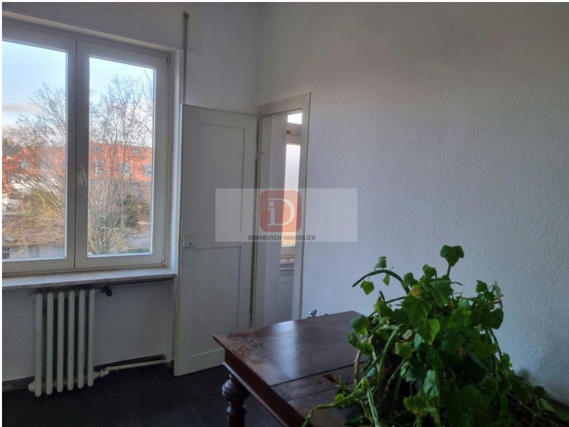
Küche mit Abstellkammer