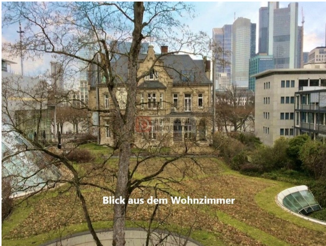
Blick aus dem Wohnzimmer