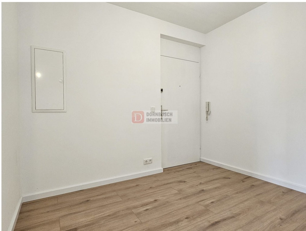
Eingangsbereich Bild 1