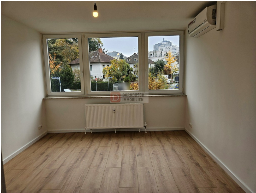
Schlafzimmer Bild 1