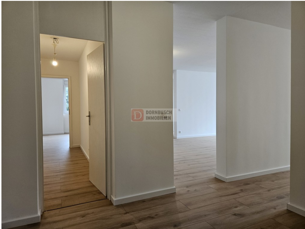
Eingangsbereich Bild 2