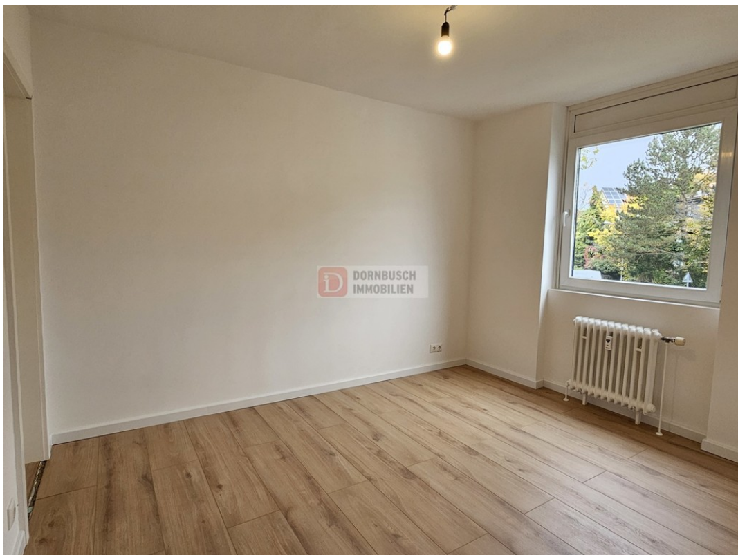
Schlafzimmer Bild 2