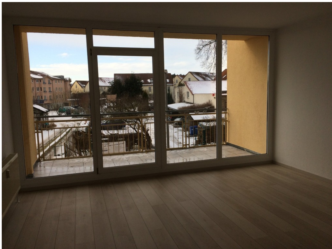
Zimmer mit Balkon