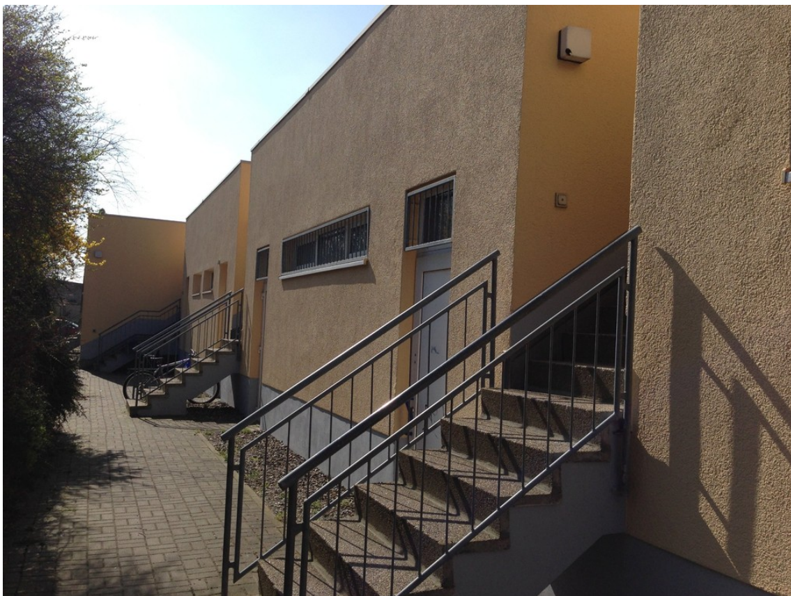
Treppen zu den Wohnungen