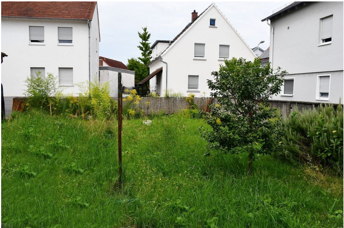
Grundstück (weiter bebaubar)