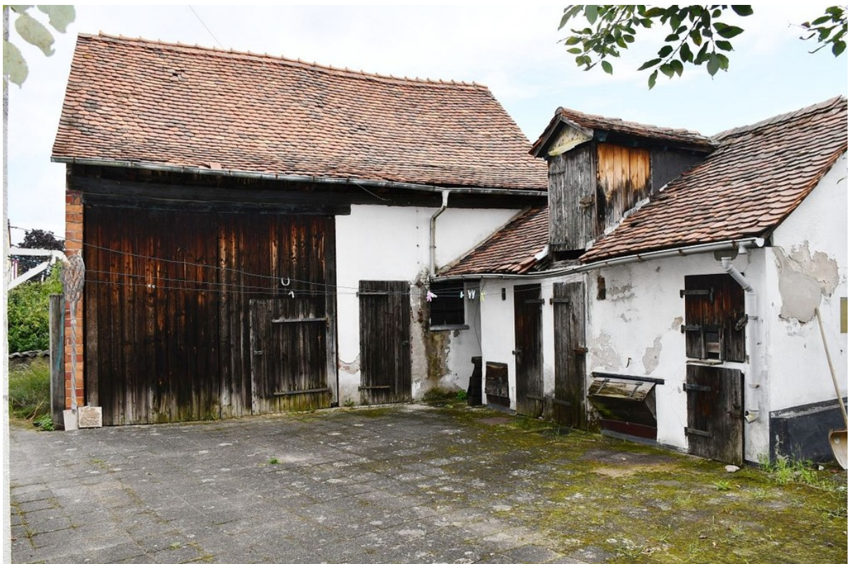
ausbaubare Scheune + Nebengebä