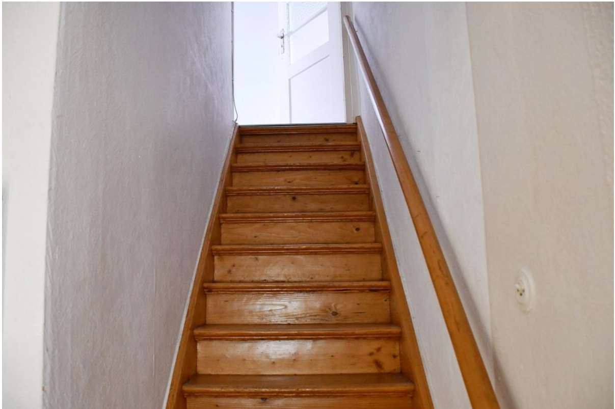
stilvolle Treppe zum Dachgesch