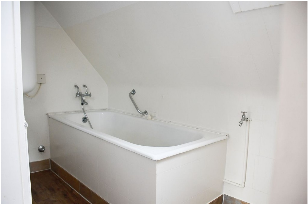
... mit Wanne Dachgeschoss