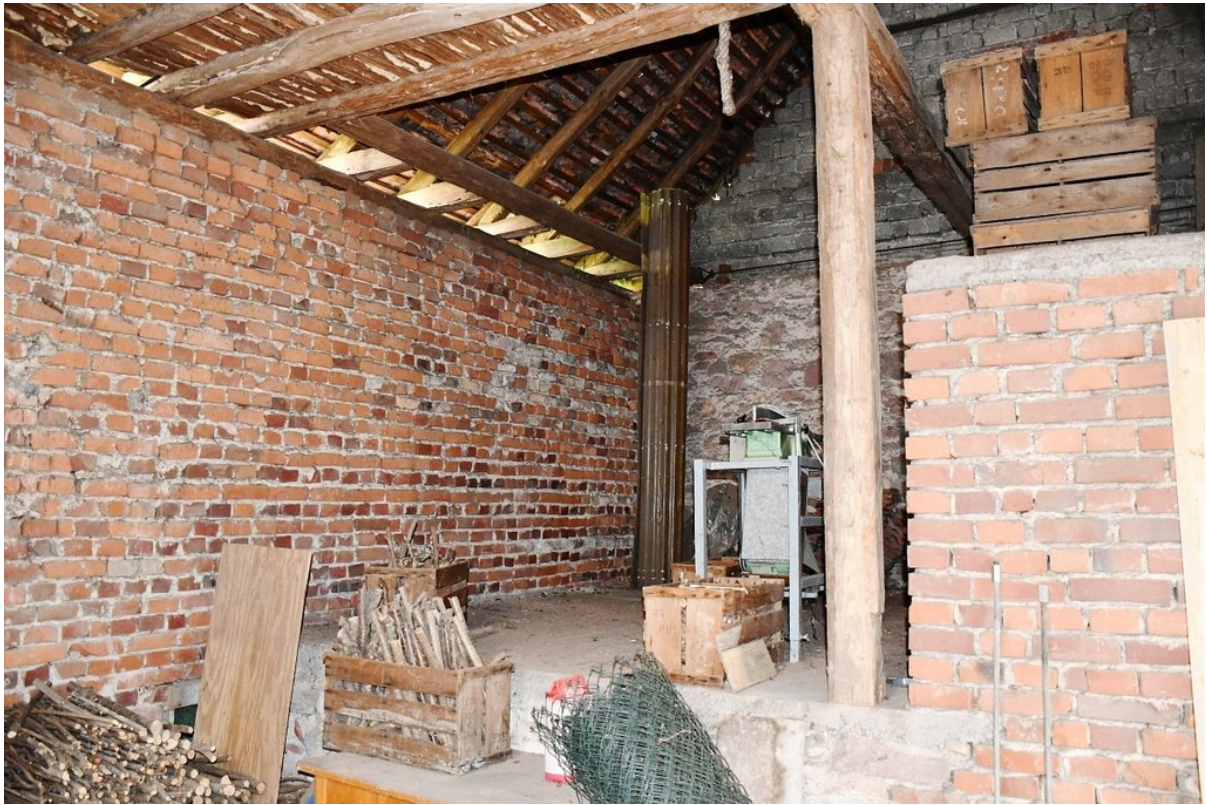
ausbaubare 2geschossige Scheun