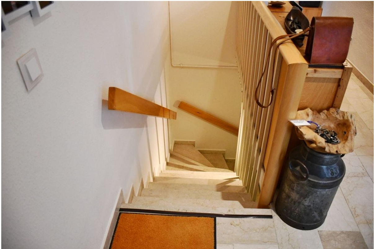
Treppe zum Untergeschoss