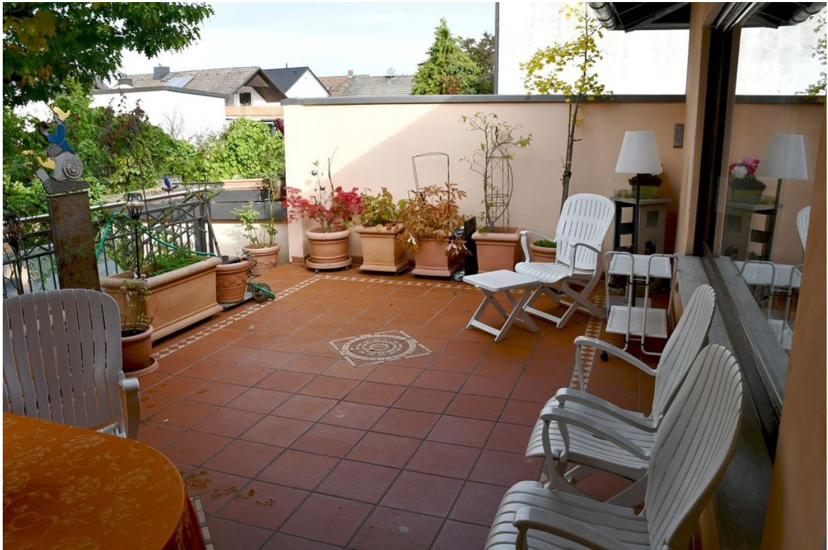
große teilüberdachte Terrasse.