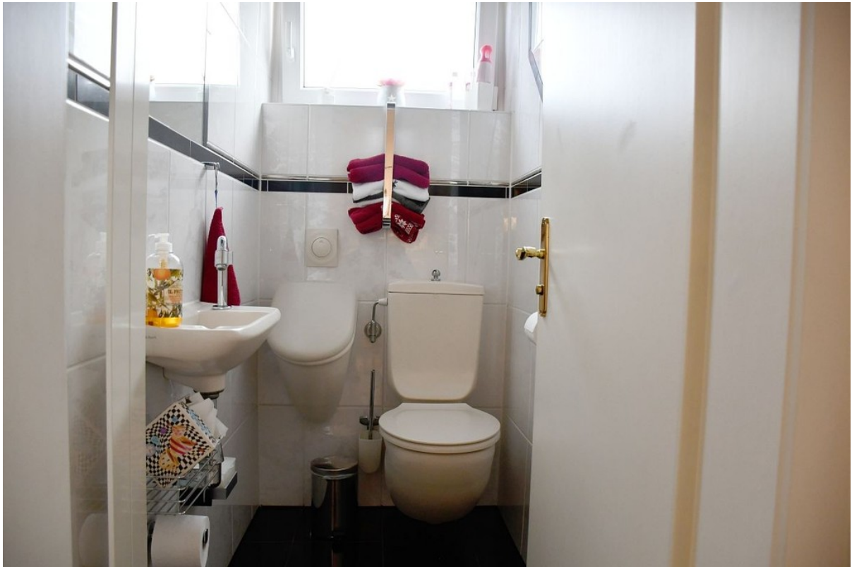
Gäste-WC mit Urinal