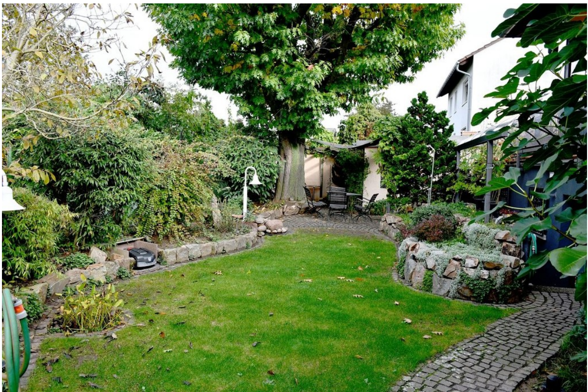
professionell angelegter Garten