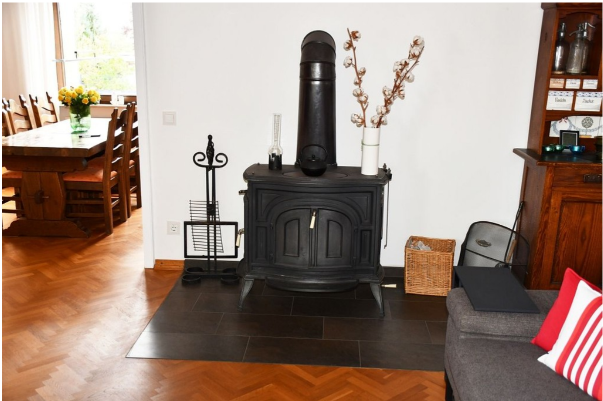
... mit hochwertigem Kaminofen