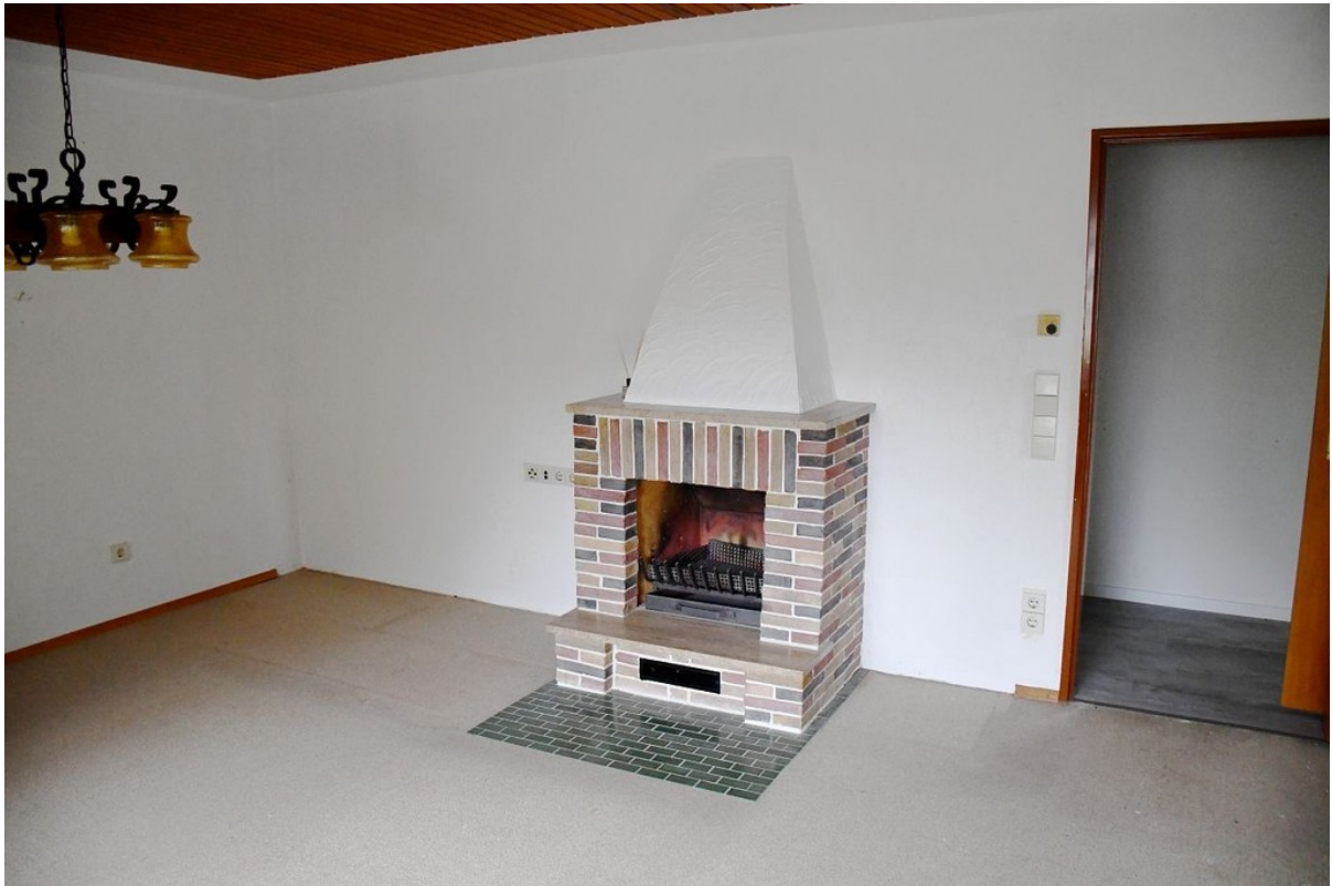
... mit gemütlichem Kamin