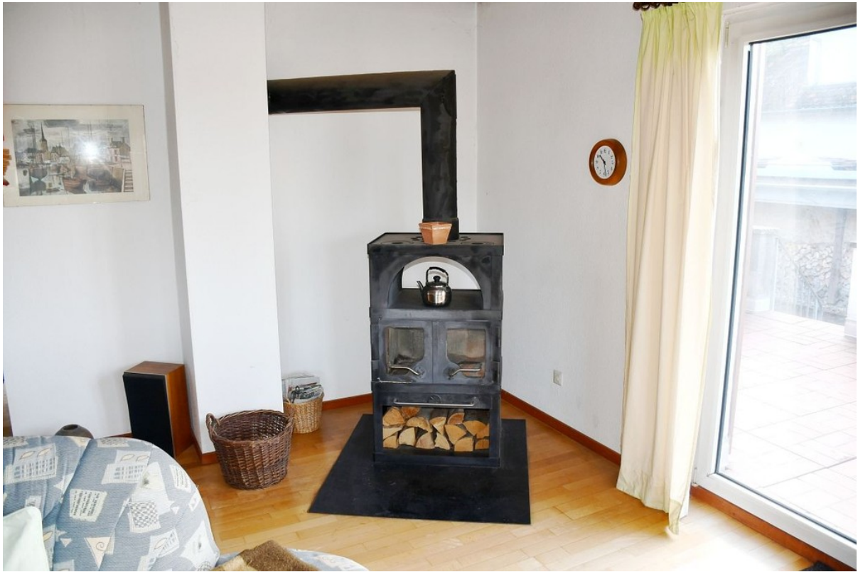
... mit gemütlichem Kaminofen