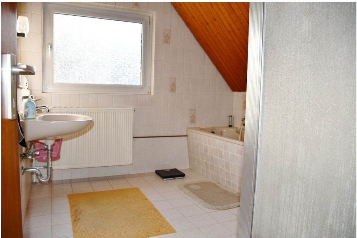
Tageslichtbad mit Wanne...