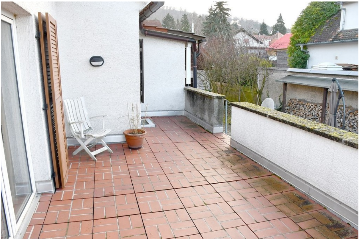
Sonnenterrasse mit Gartenzugan