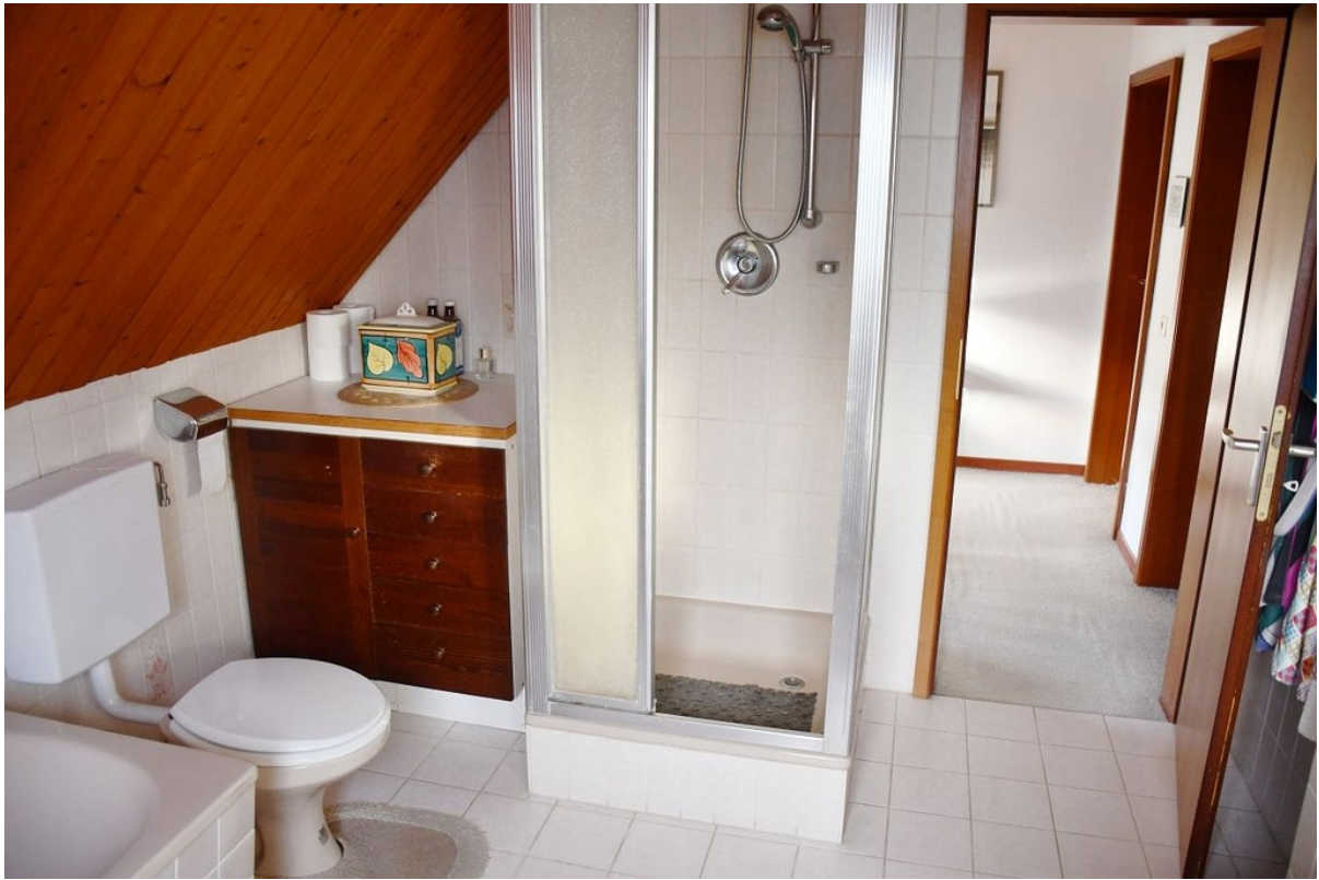
... und Dusche