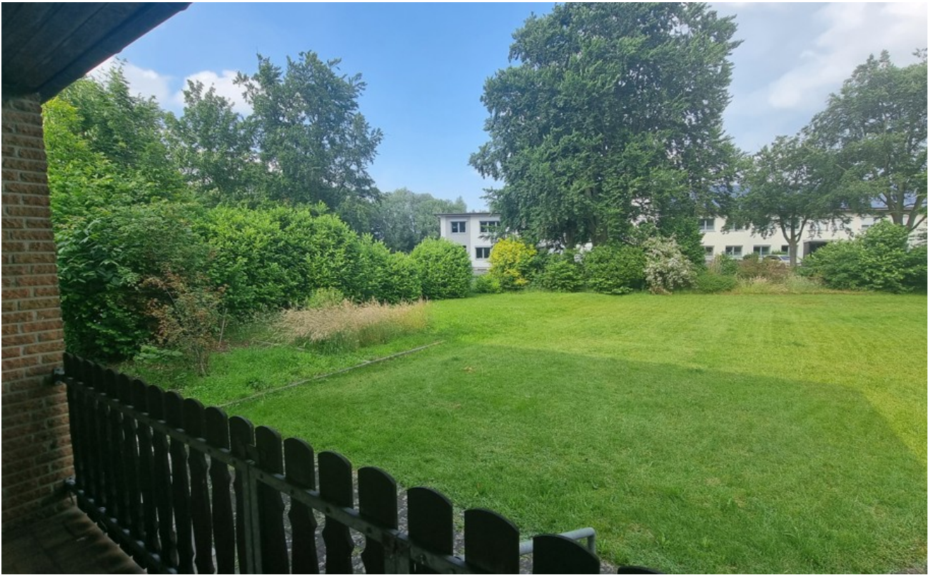
Ausblick in den Garten