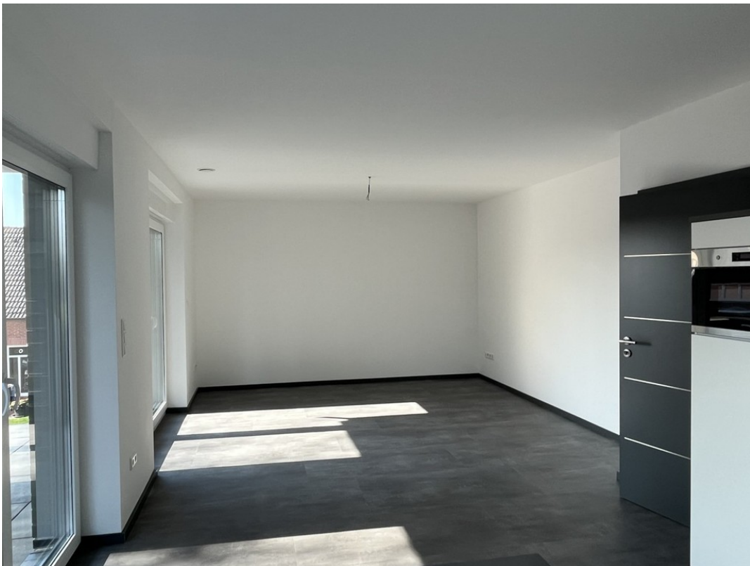
Wohnen - Beispiel