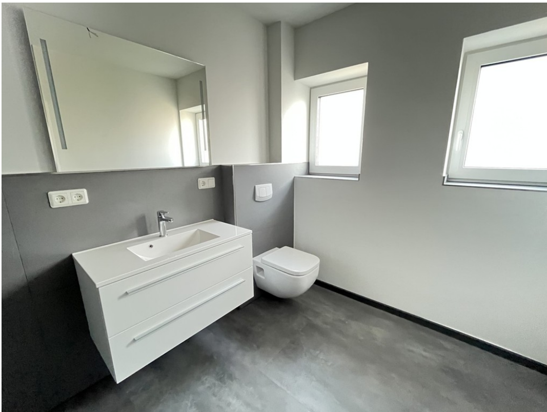
Bad mit Dusche - Beispiel