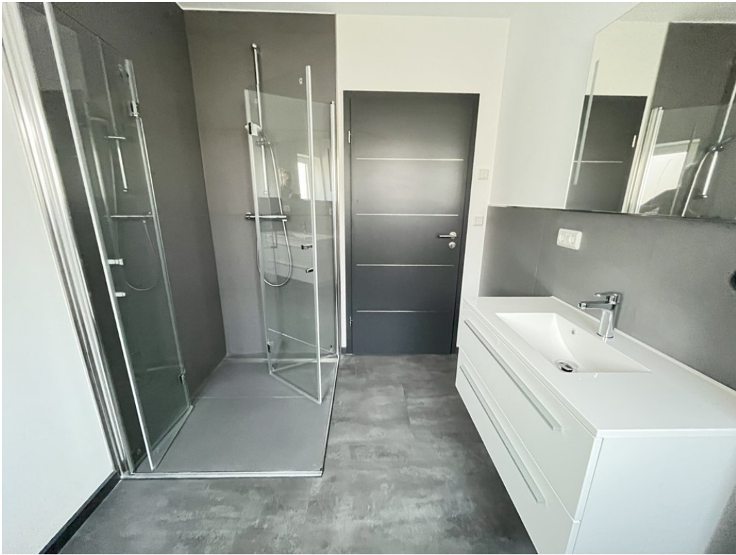
Bad mit Dusche - Beispiel