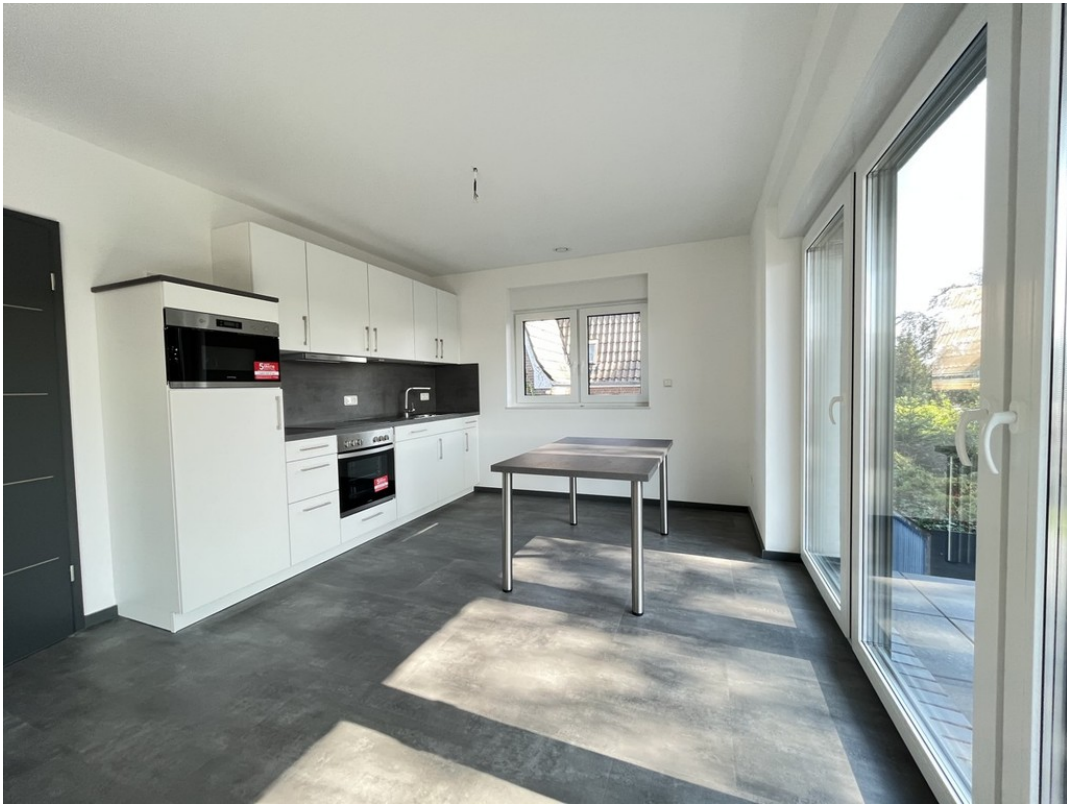
Einbauküche - Beispiel