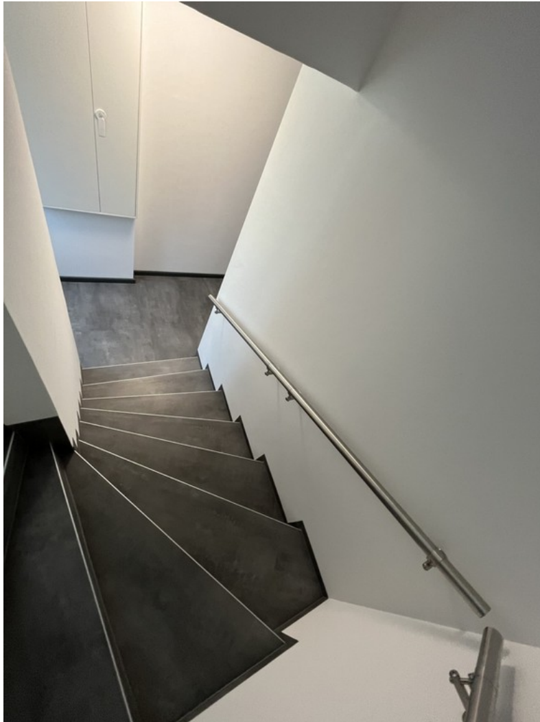
Treppe - Beispiel