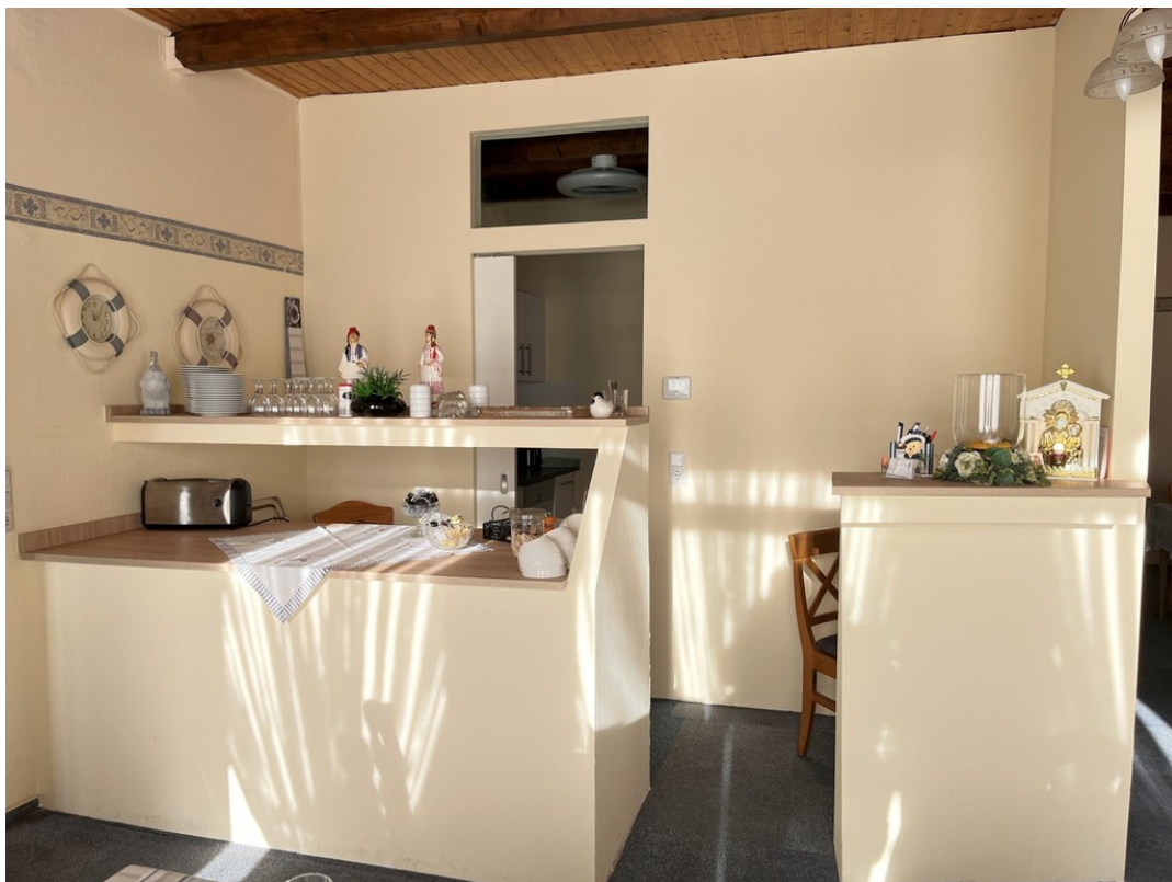
Tresen im Frühstücksraum