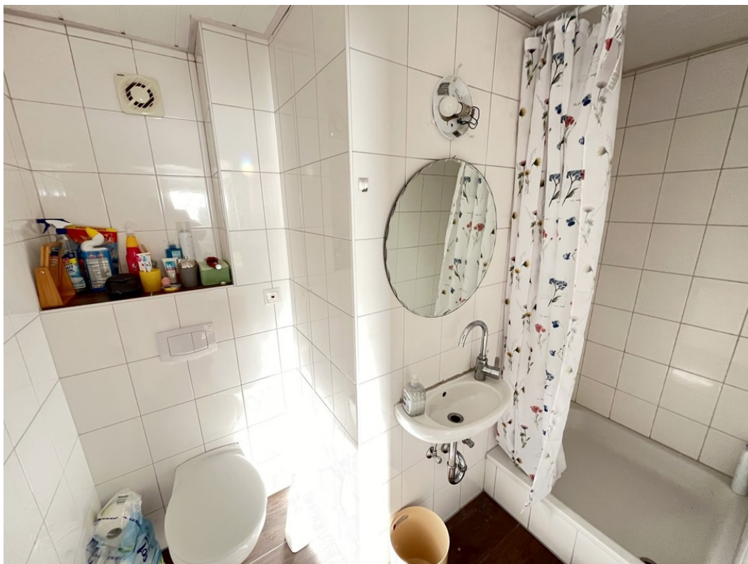
Betreiberwohnung - Bad