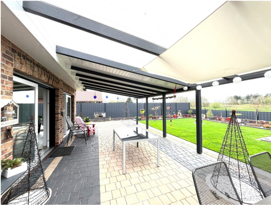
Überdachte Terrasse Bild 1