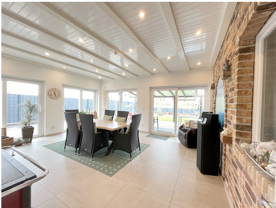
Wintergarten 3 fach Verglasung