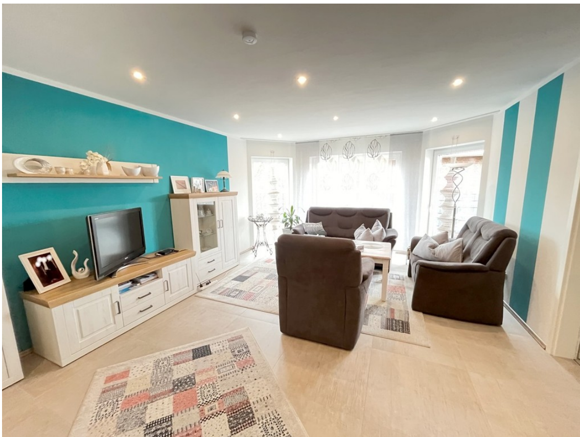
Wohnen Bild 2