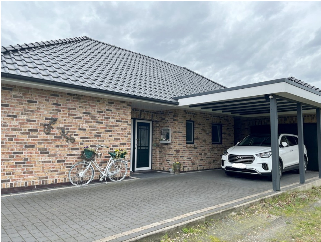
Carport und Garage