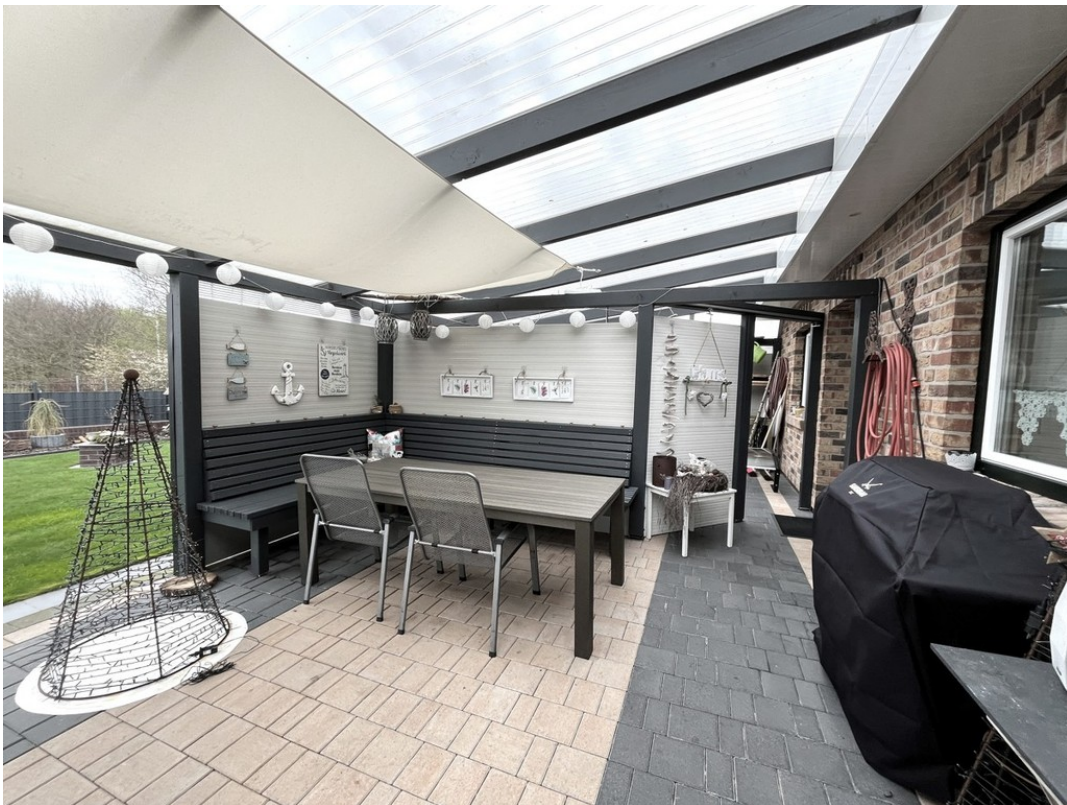
Überdachte Terrasse Bild 2