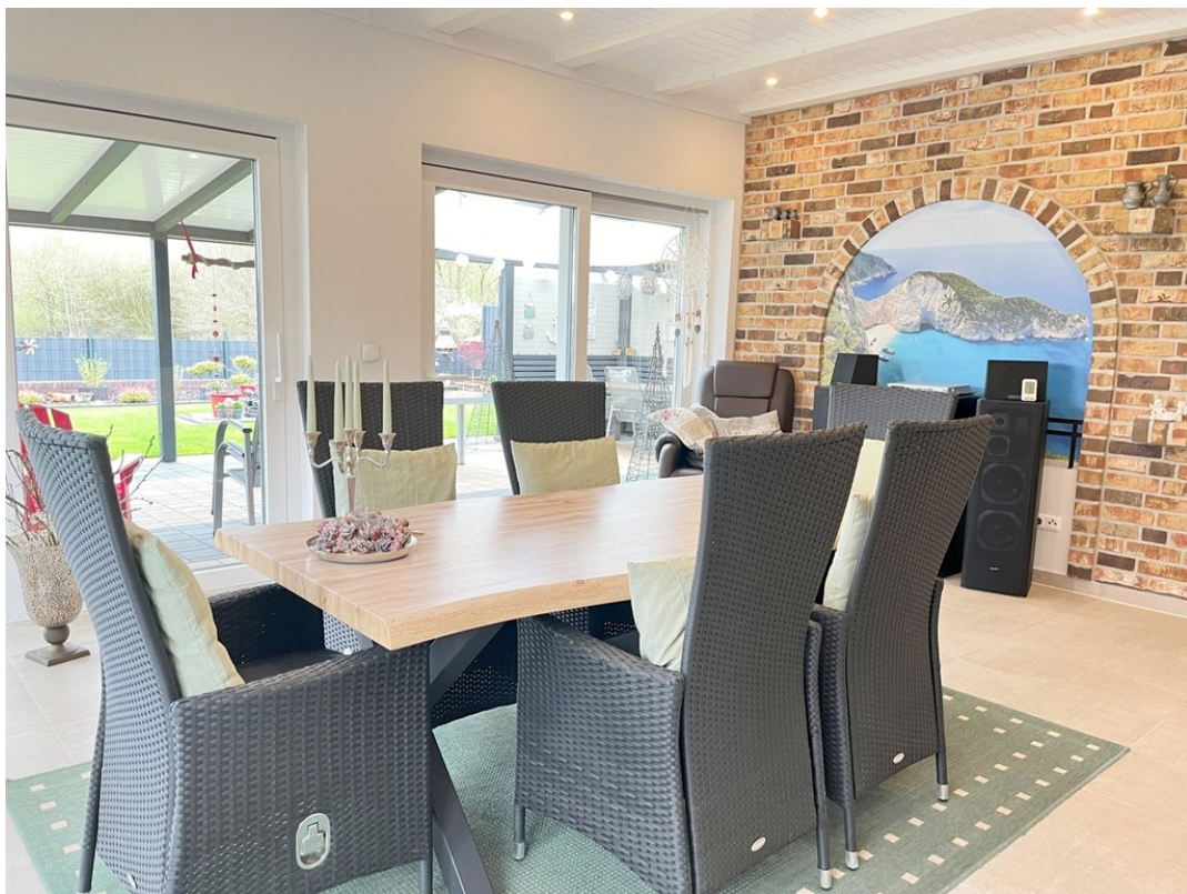
Wintergarten mit Kaminofen