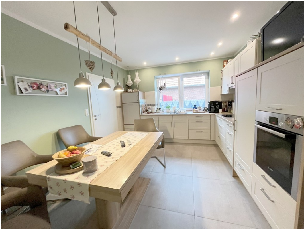
Kochen mit EBK