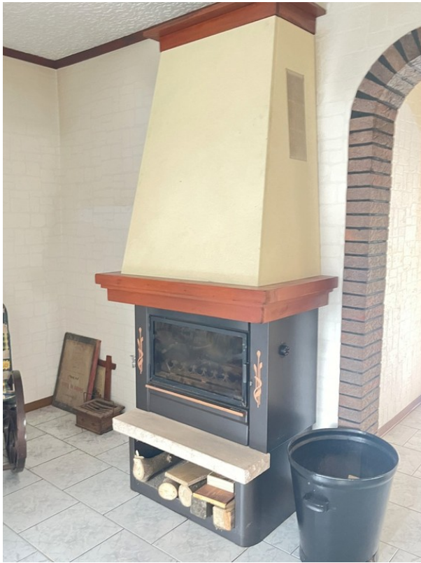
Kamin in der Diele