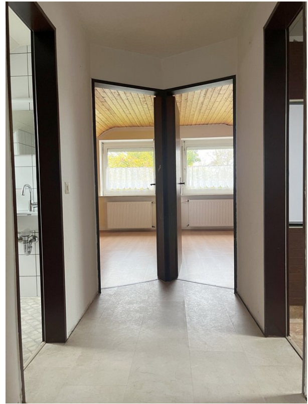
DG - Flur