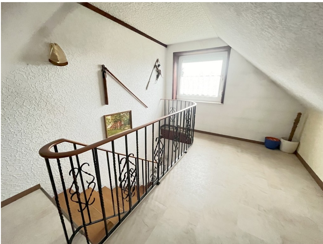
DG - Treppe