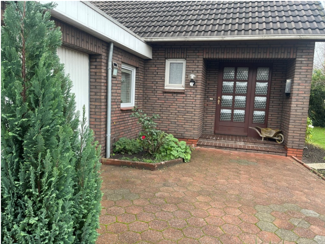
Eingang und Garage