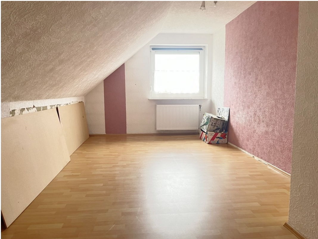
DG - Schlafen 1