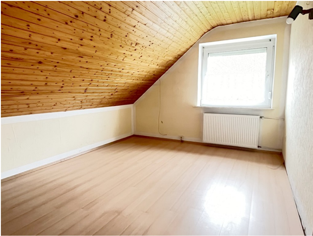
DG - Schlafen 3 / Wohnen