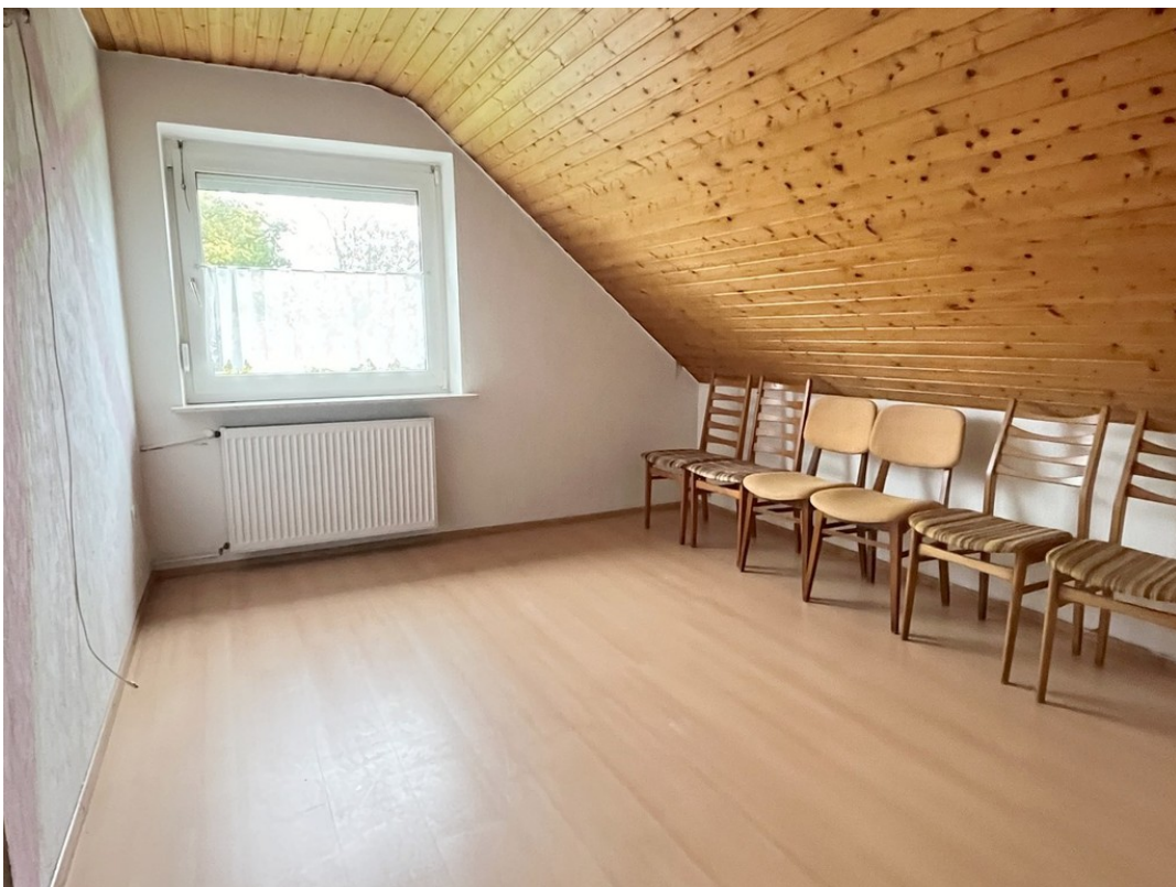
DG - Schlafen 2