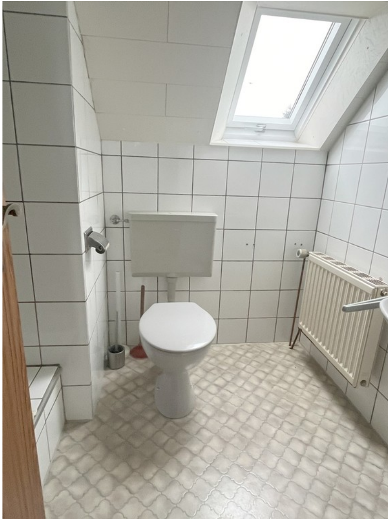
DG - Bad mit Dusche