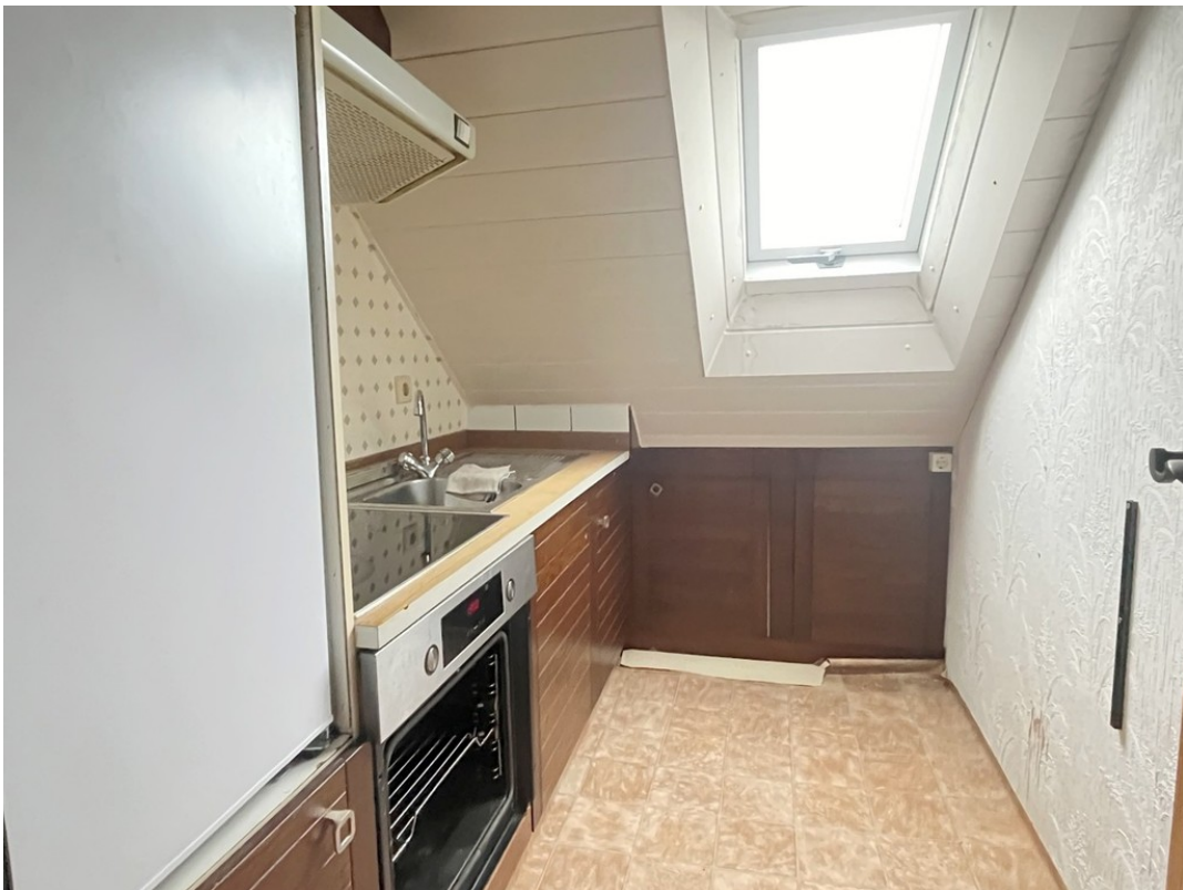
DG - Kochen