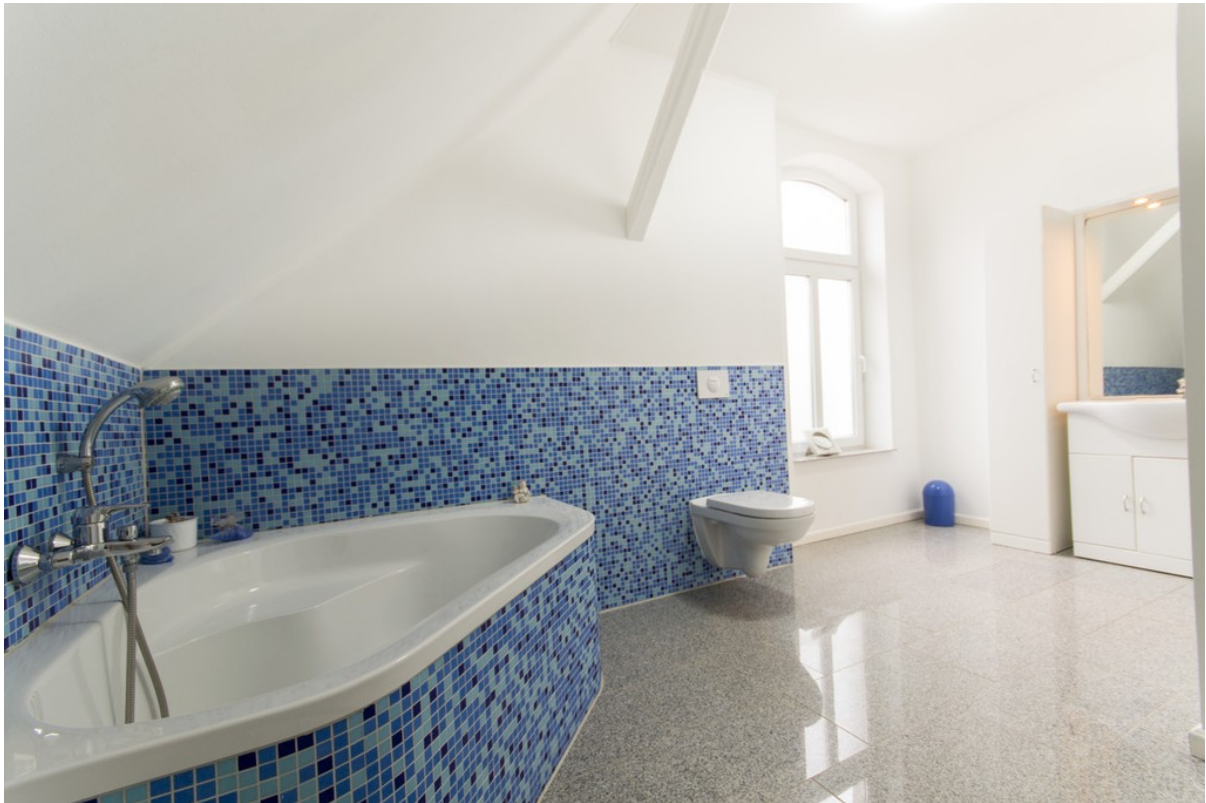
Bad mit Dusche, Wanne und WC