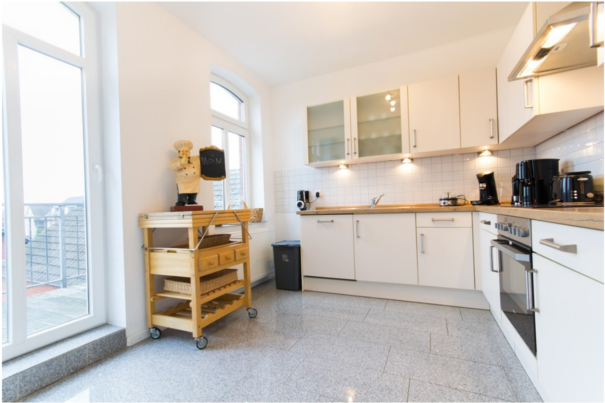
Kochen mit Einbauküche und Zug