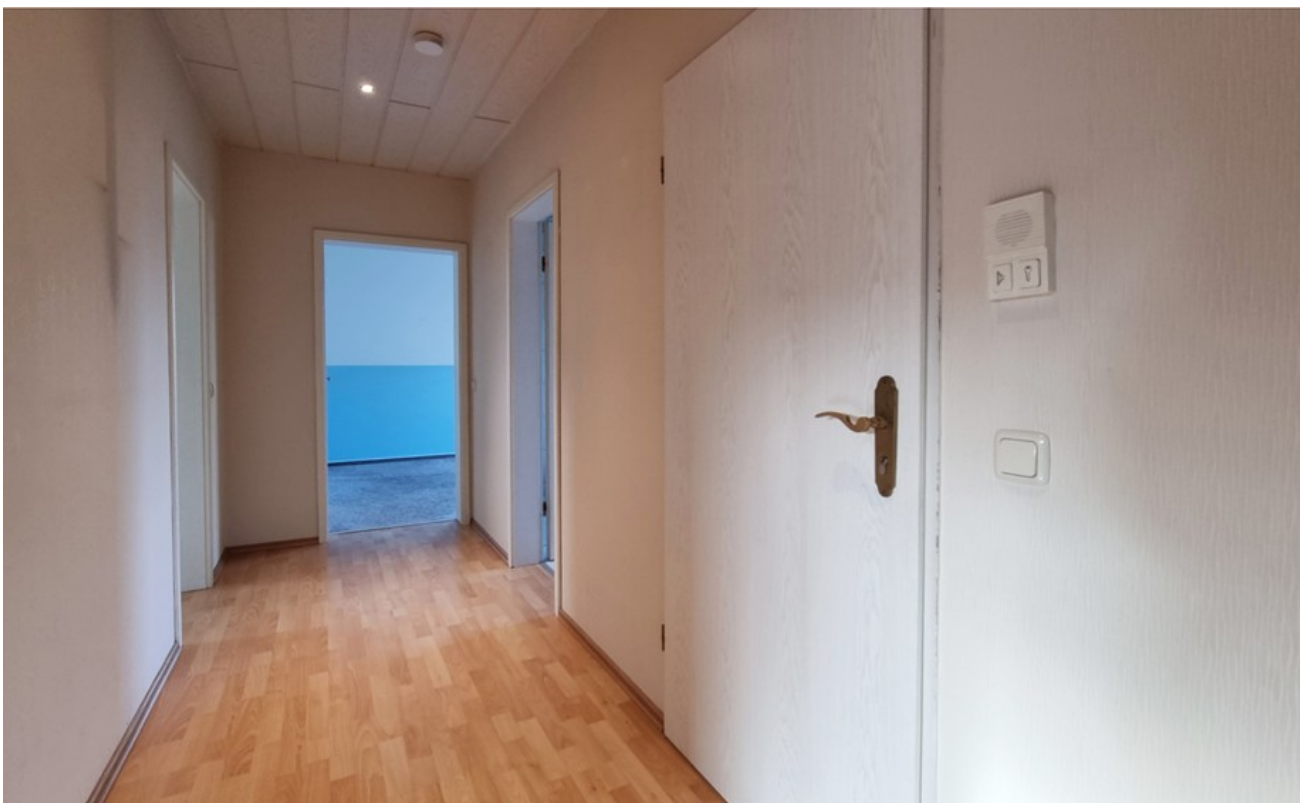
Flur (Archivbild baugleiche Wo