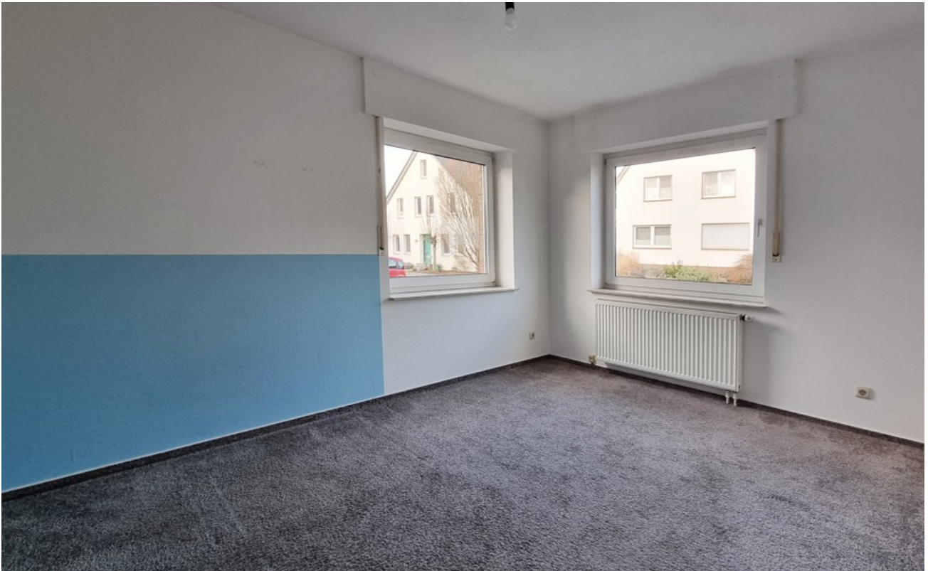
Kinderzimmer (Archivbild baugl)