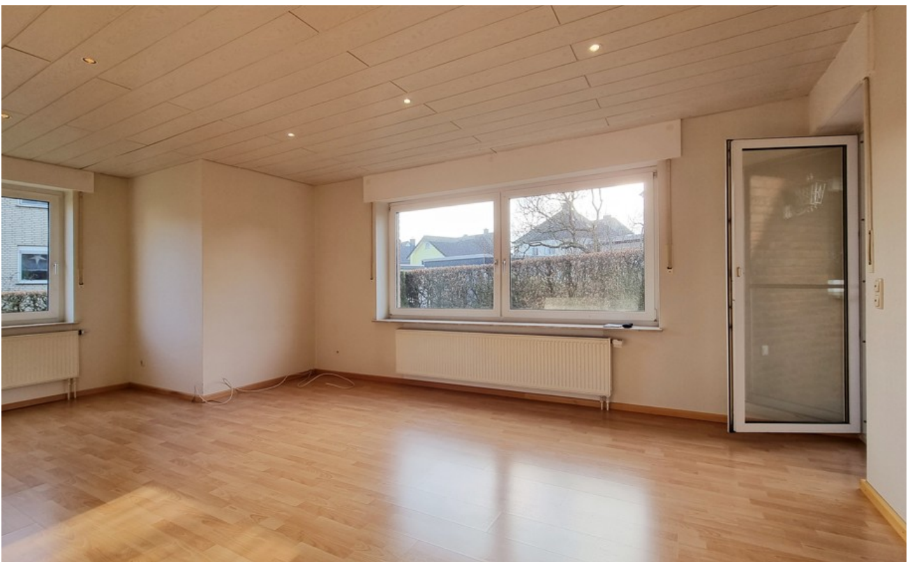
Wohnzimmer (Archivbild bauglei)