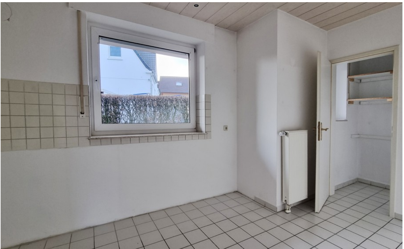
Küche (Archivbild baugleiche W