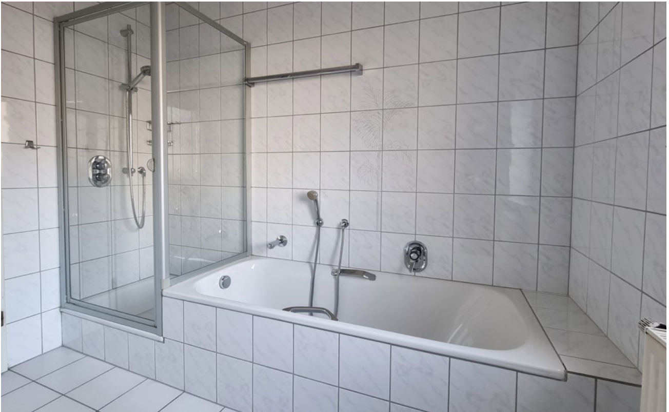
Bad (Archivbild baugleiche Woh