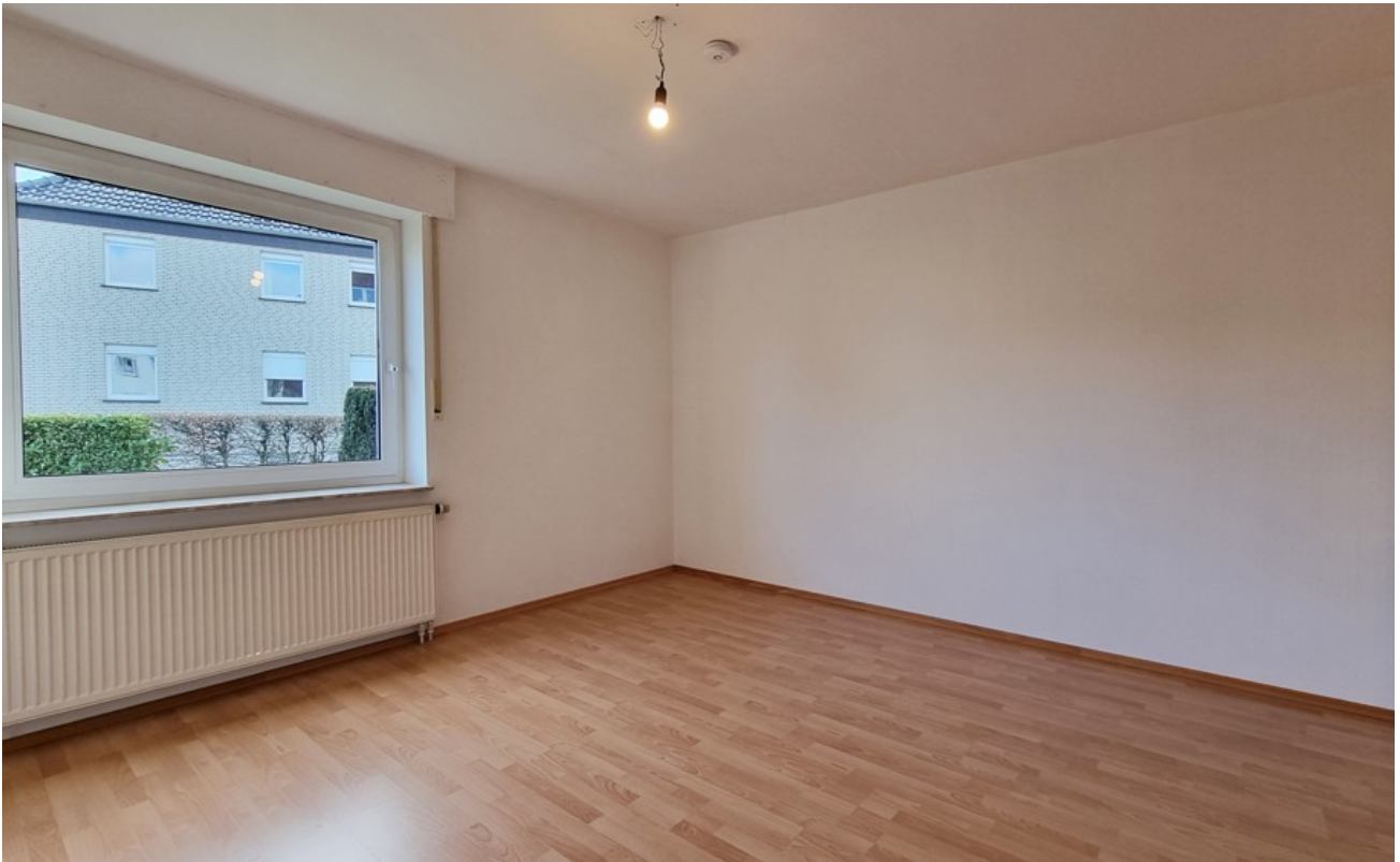
Schlafzimmer (Archivbild baugl)