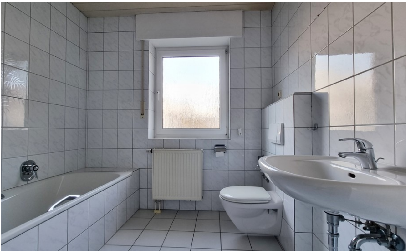
Bad (Archivbild baugleiche Woh)