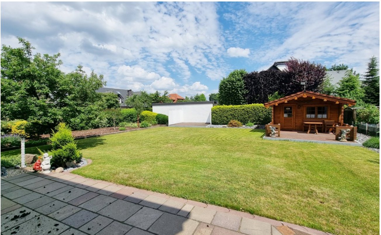
Blick von der Terrasse