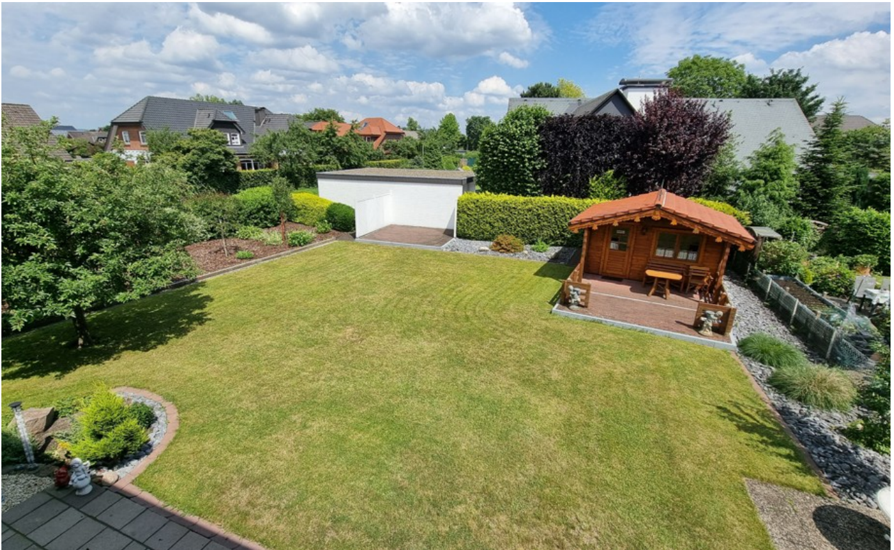
Blick vom Balkon in den Garten