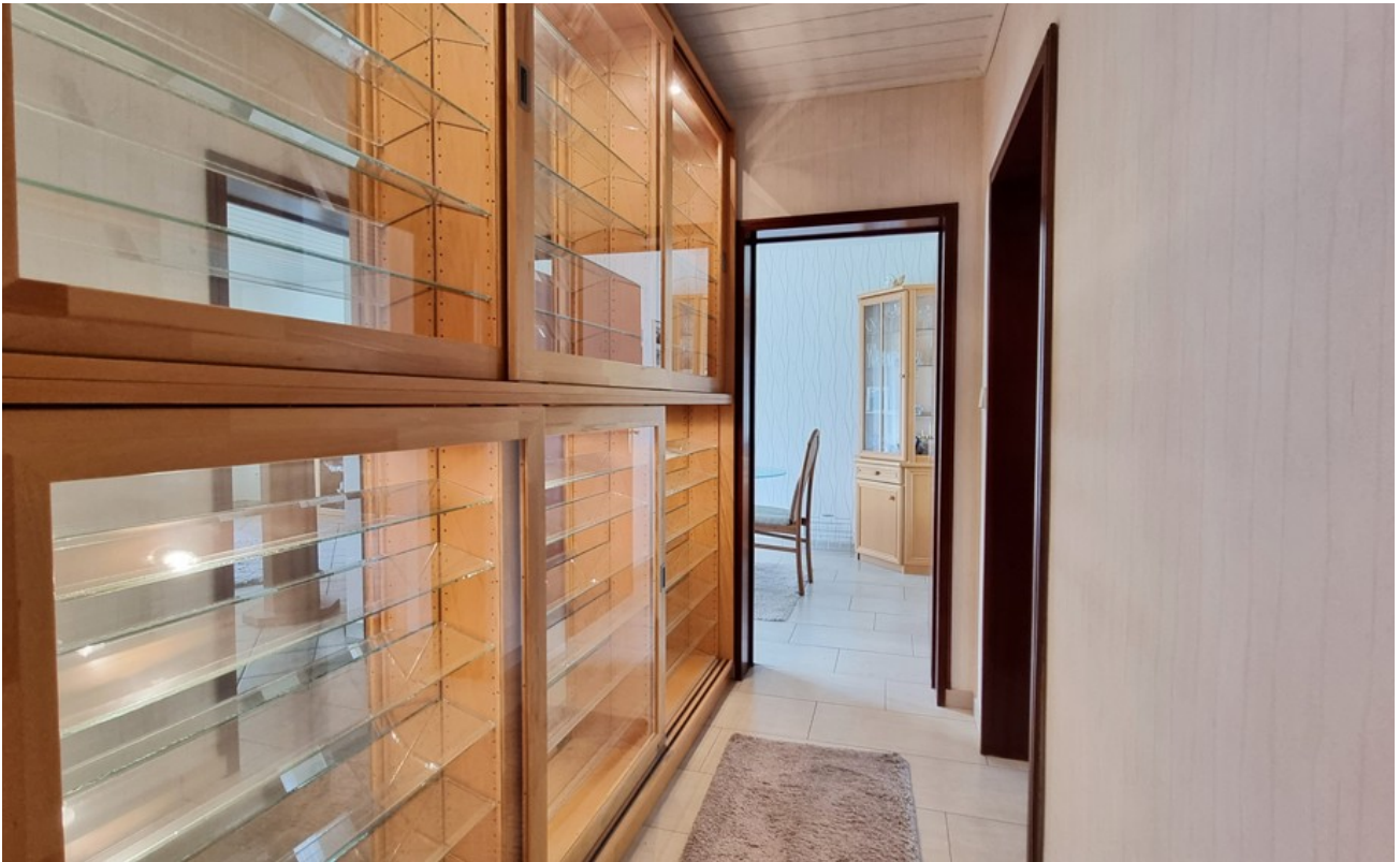
Flur mit Einbauschränk (EG)