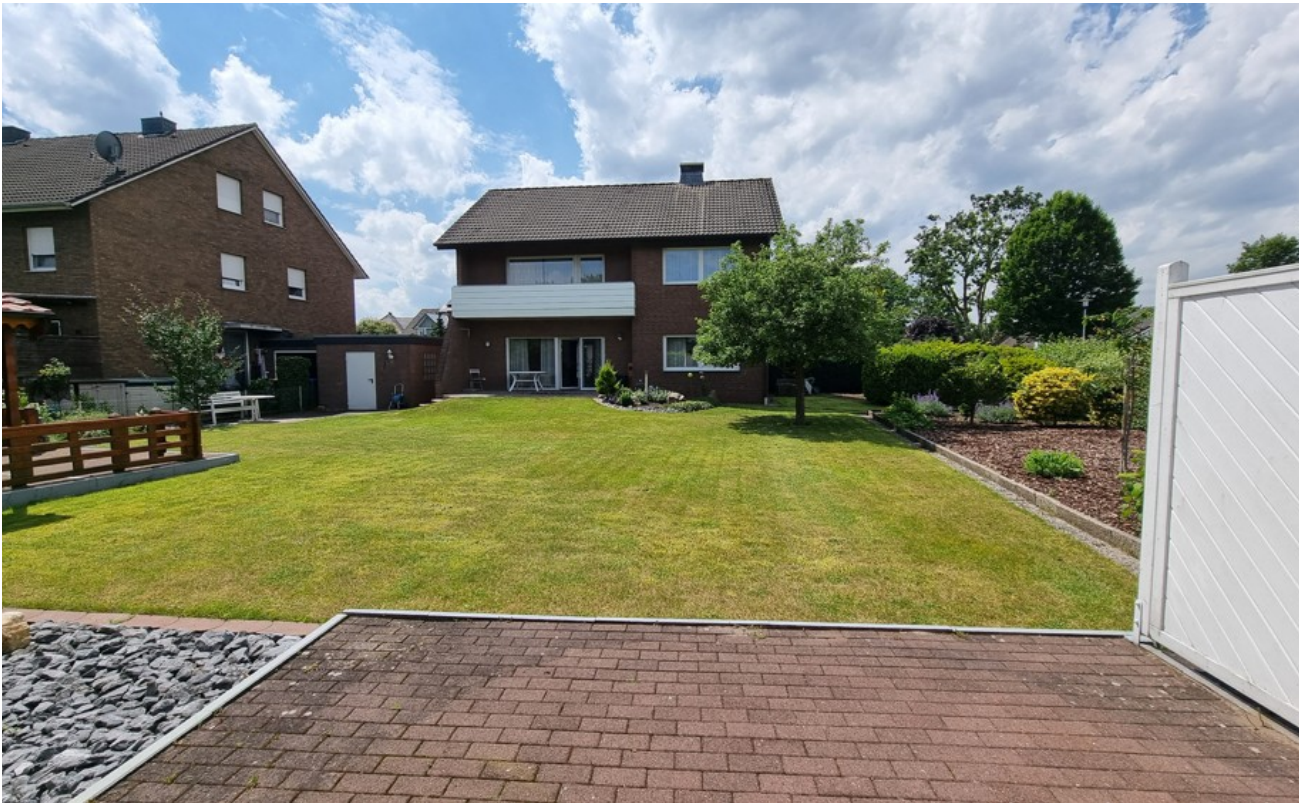
Blick vom Freisitz