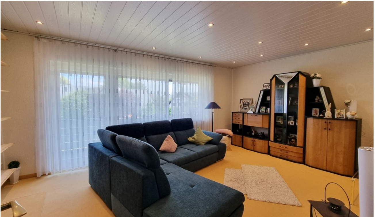
Schlafzimmer mit Balkon (OG)