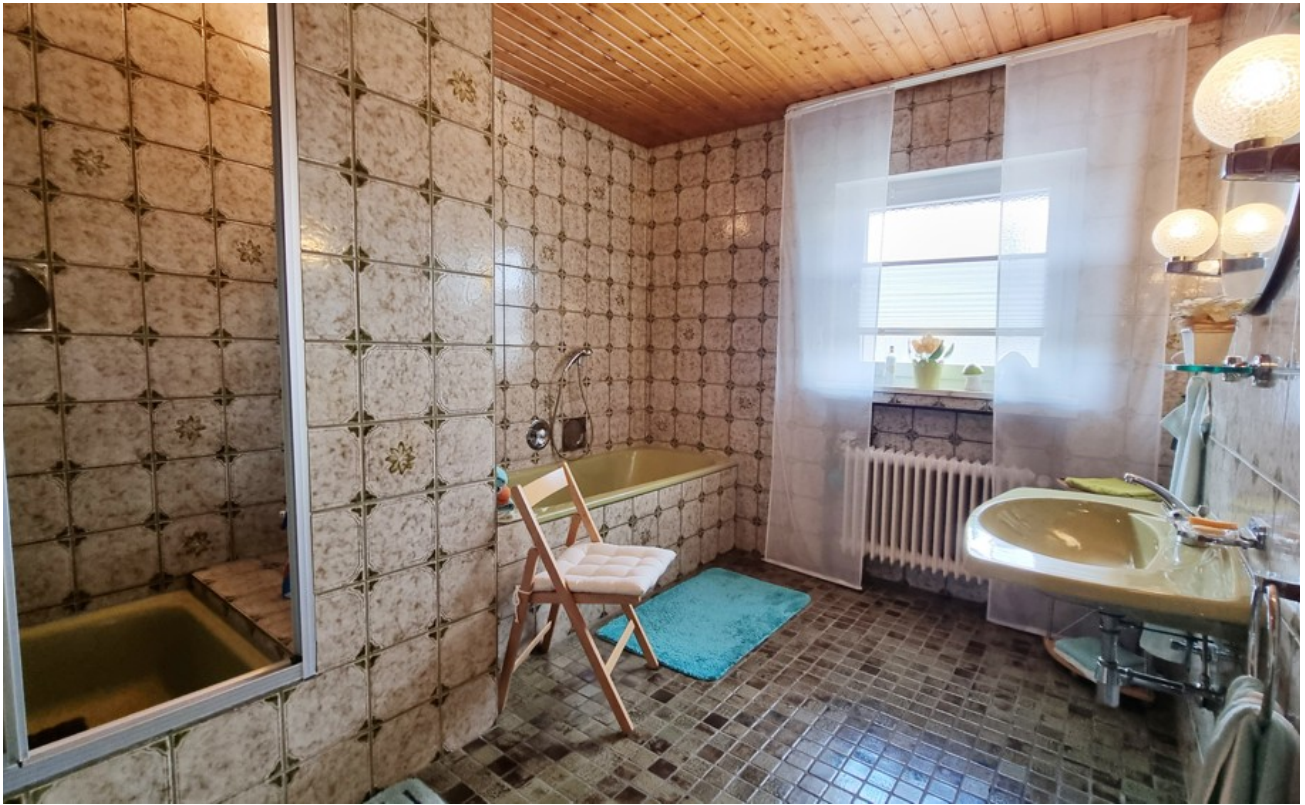
Bad mit Dusche (OG)