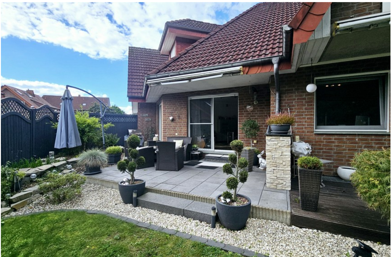
Blick auf die Terrasse