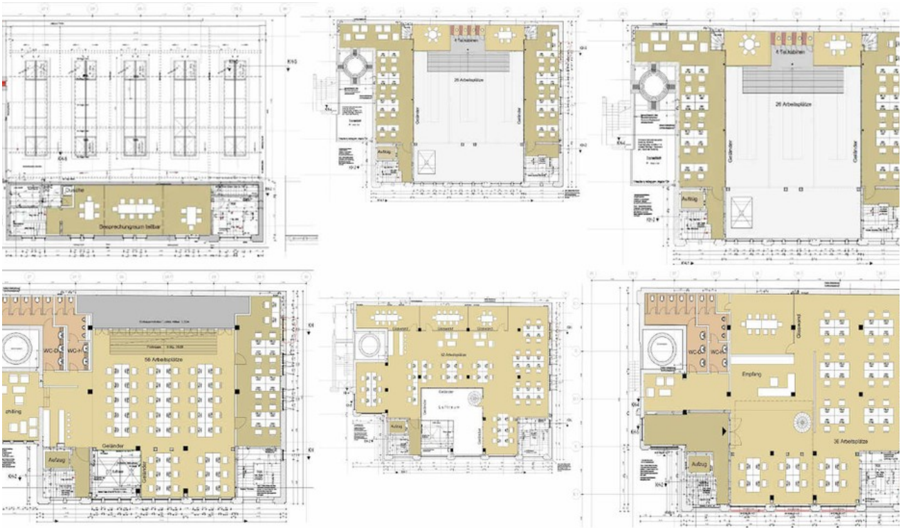
Grundriss | Plan