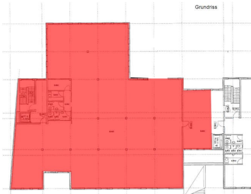
Grundriss | Plan