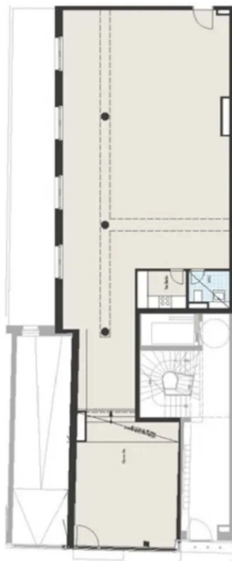
Grundriss | Plan