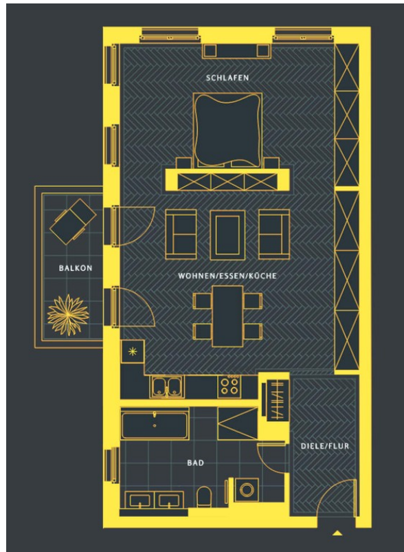
Grundriss | Plan