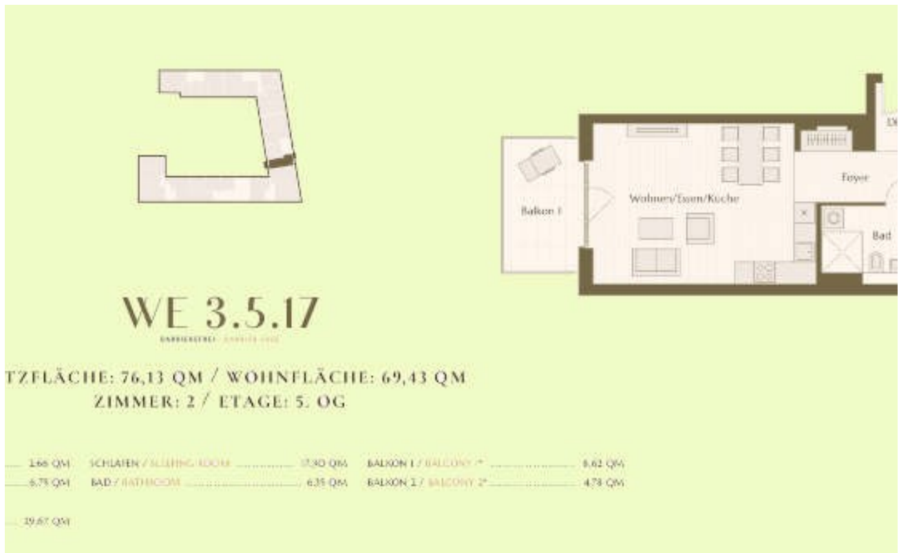
Grundriss | Plan