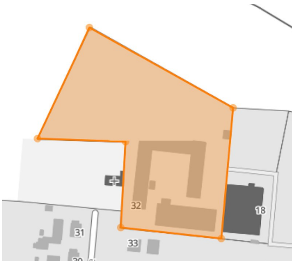
Grundriss | Plan