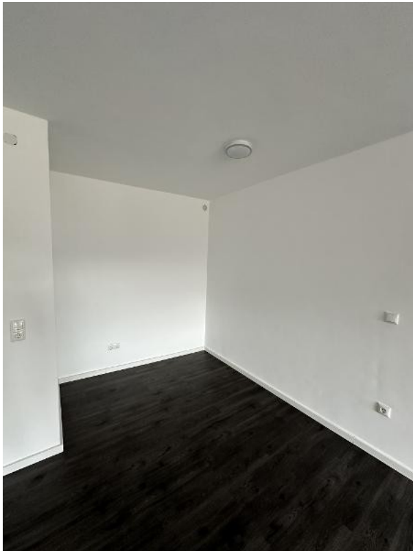
... mit Bett-/Schranknische