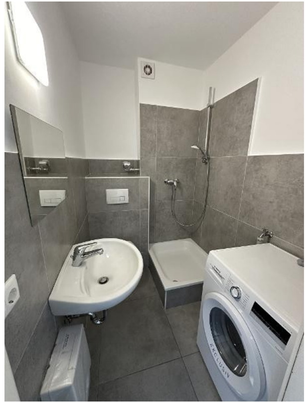
Modernes Bad mit Stelplatz für