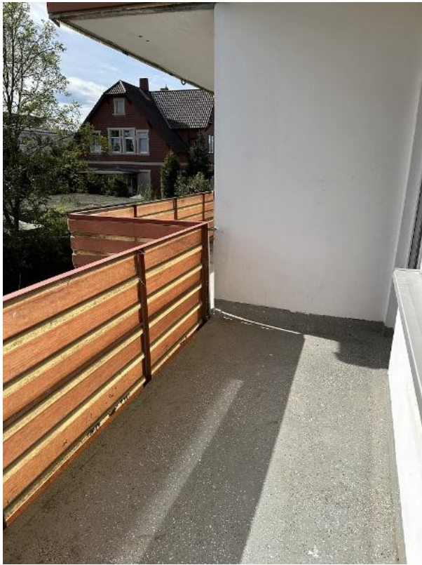
... und Platz zum Relaxen