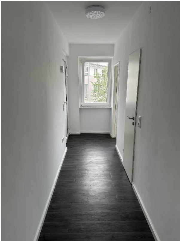
... alles mit Vinylboden