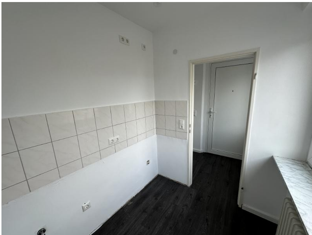
Von der Küche zum Flur