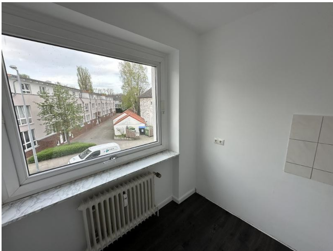
Beleuchtung des Flures zur Nor