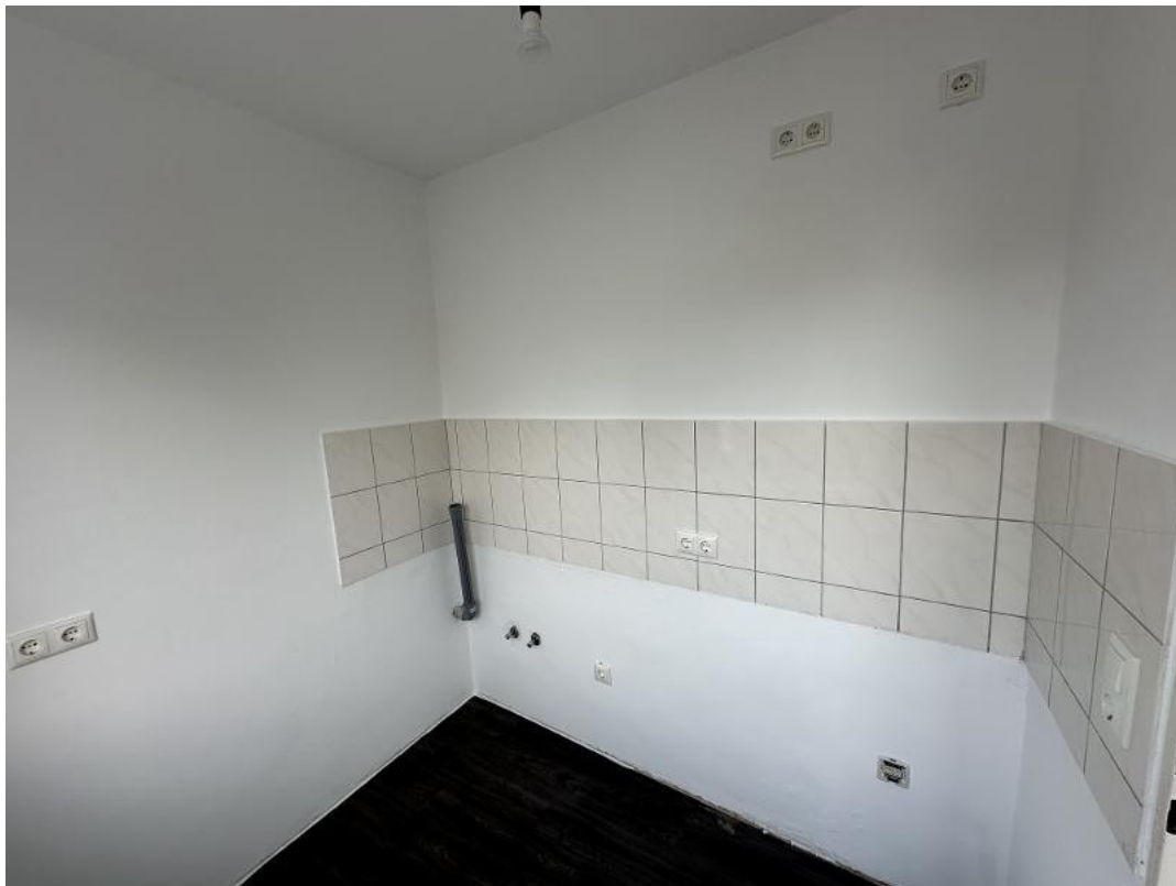
Küche mit optionaler Einbauküch