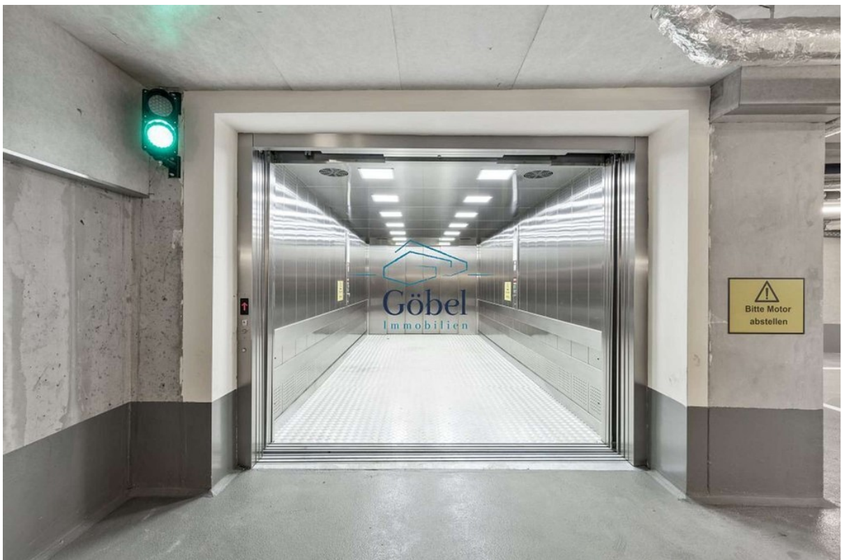
Tiefgarage - Aufzug