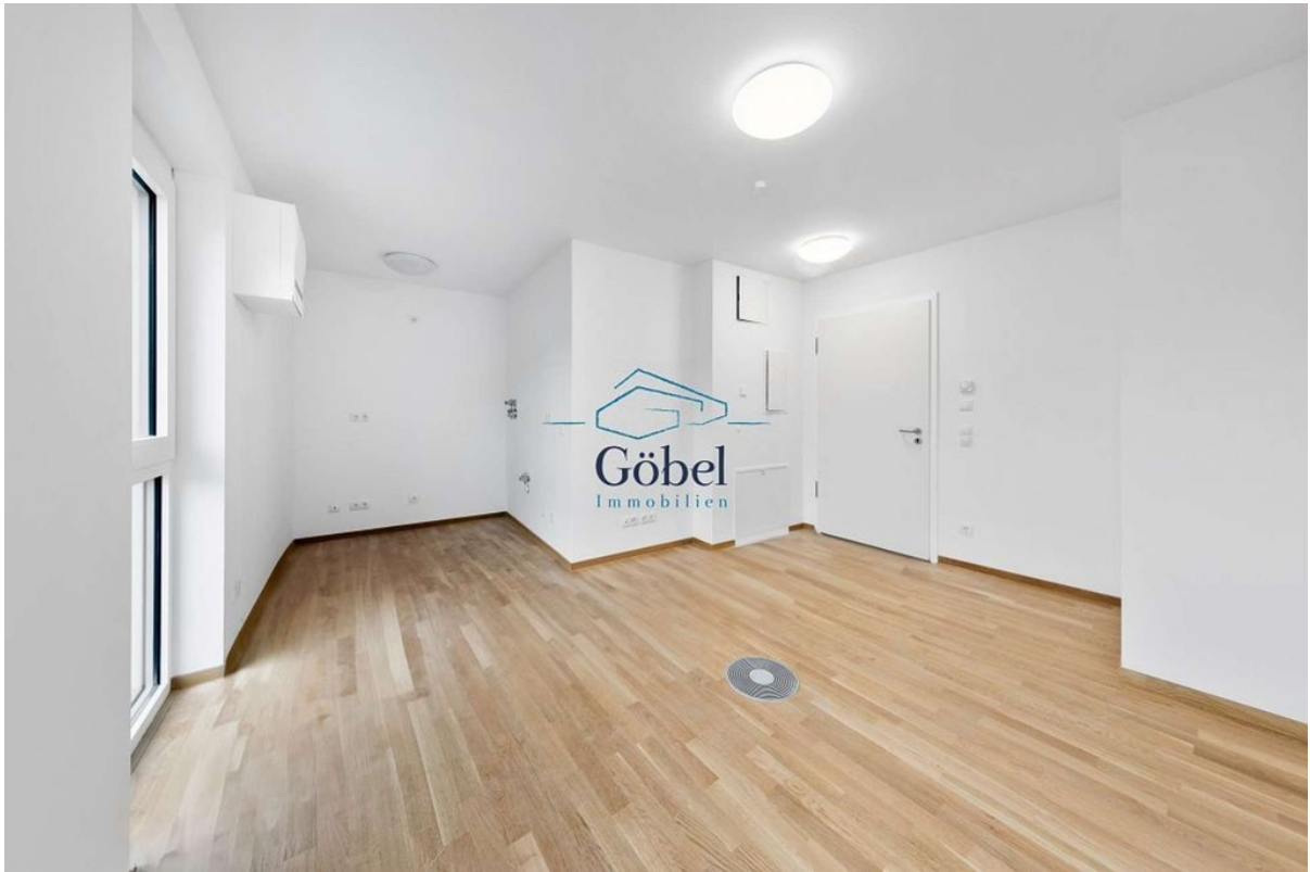
Büro 1.OG - 012