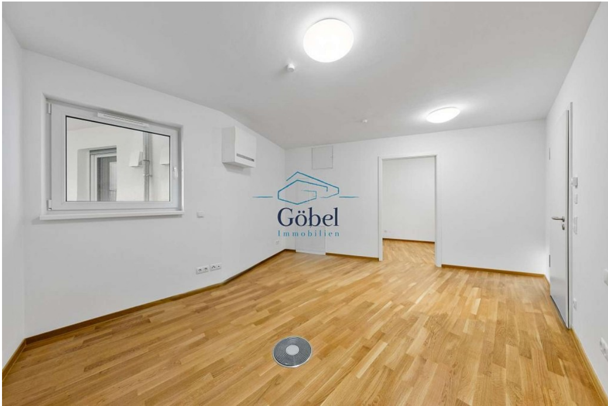
Büro 1.OG - 008