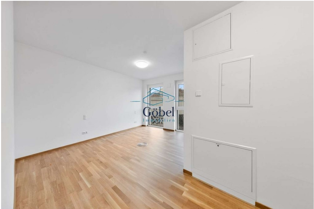
Büro 1.OG - 013