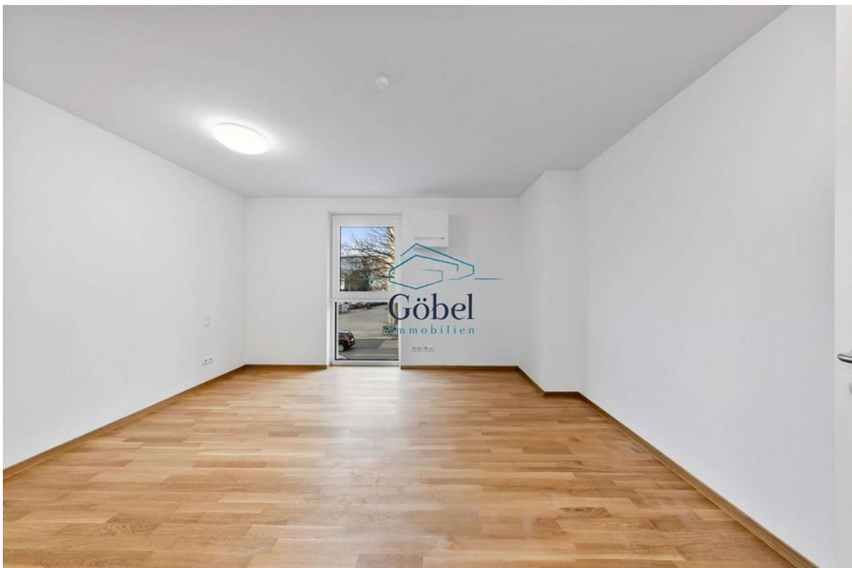
Büro 1.OG - 005