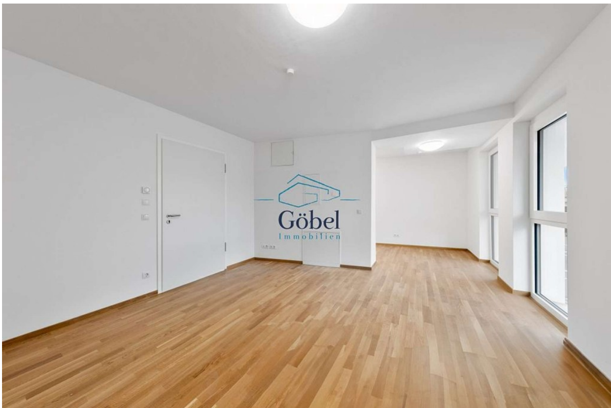
Büro 1.OG - 011