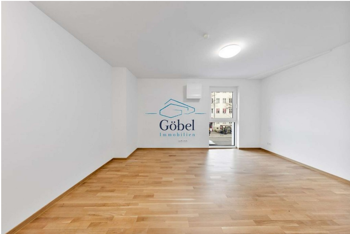
Büro 1.OG - 006