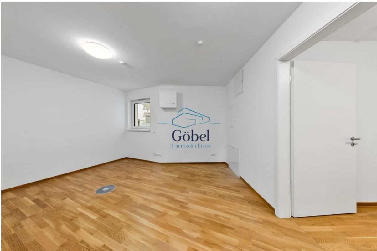
Büro 1.OG - 007