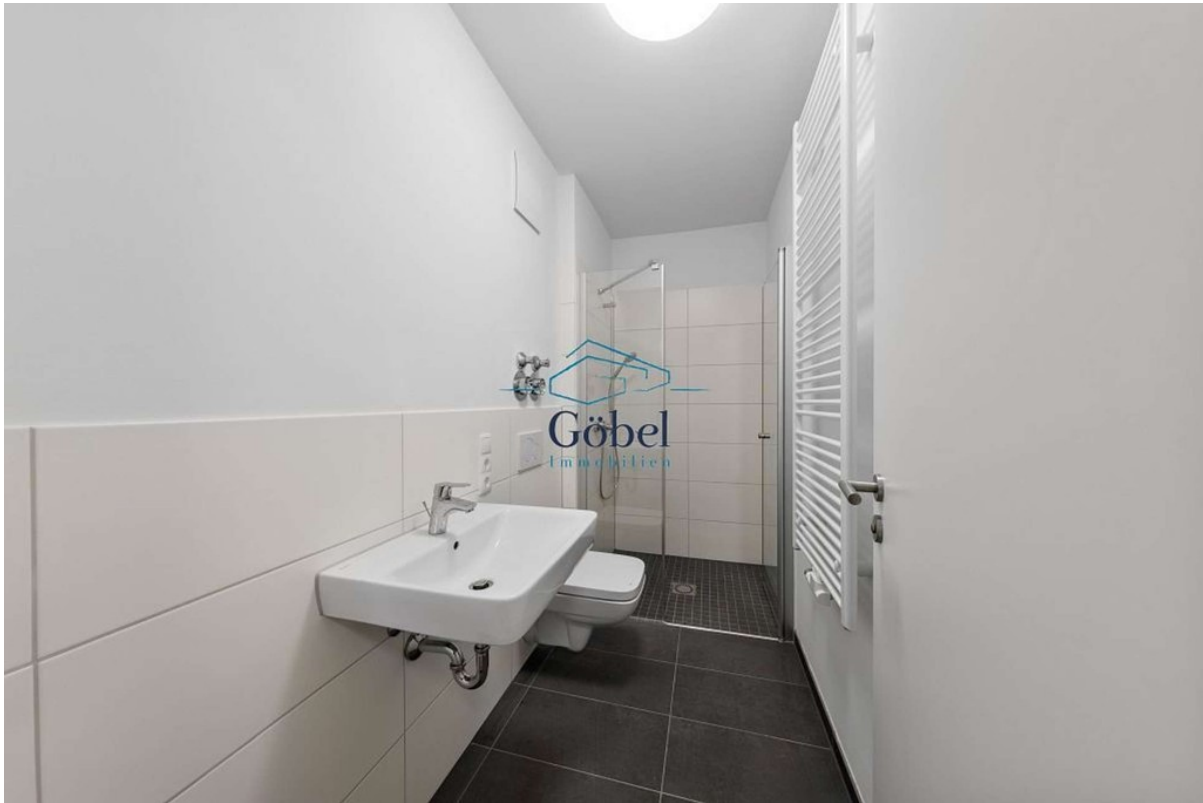
Büro 1.OG - 002