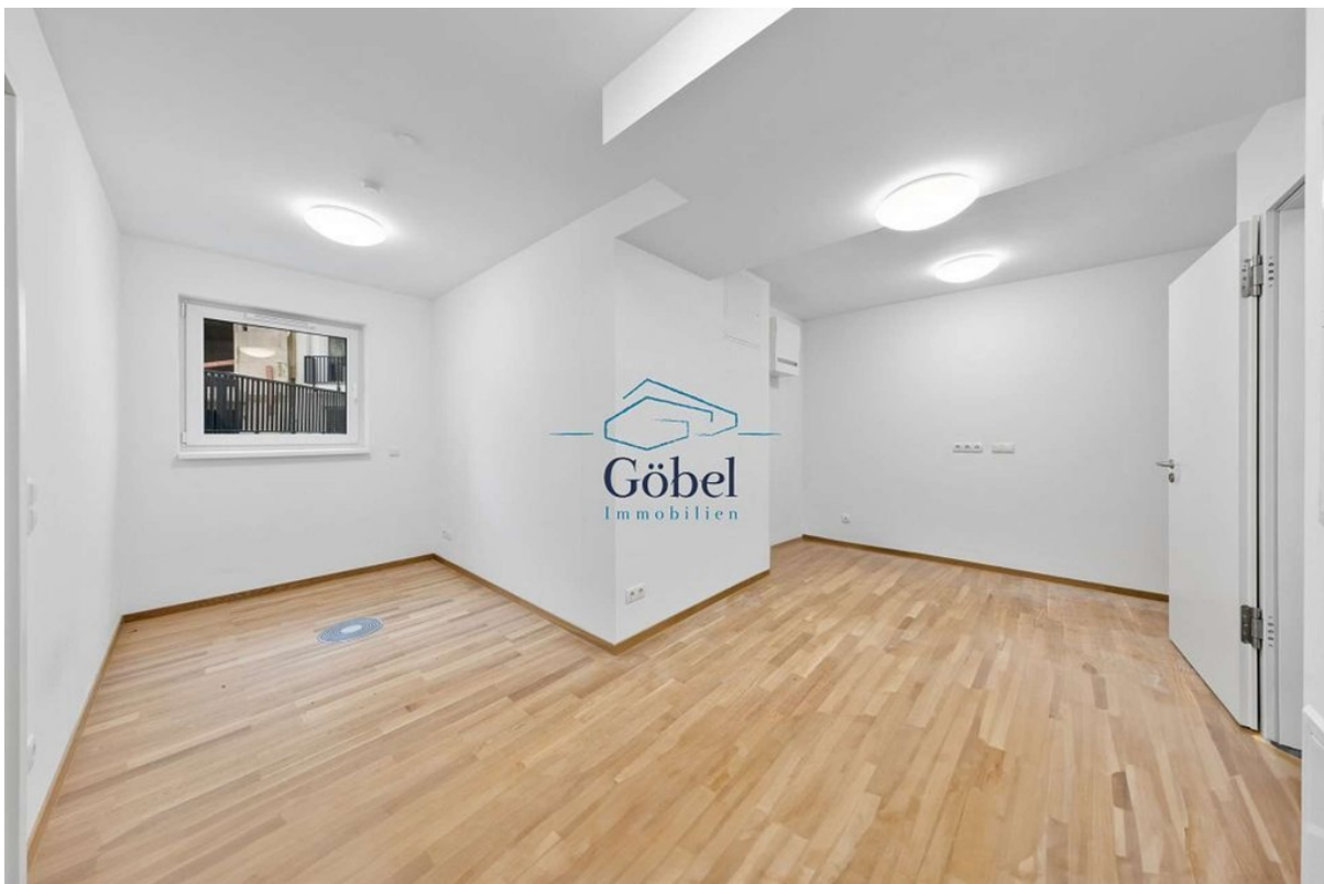
Büro 1.OG - 003