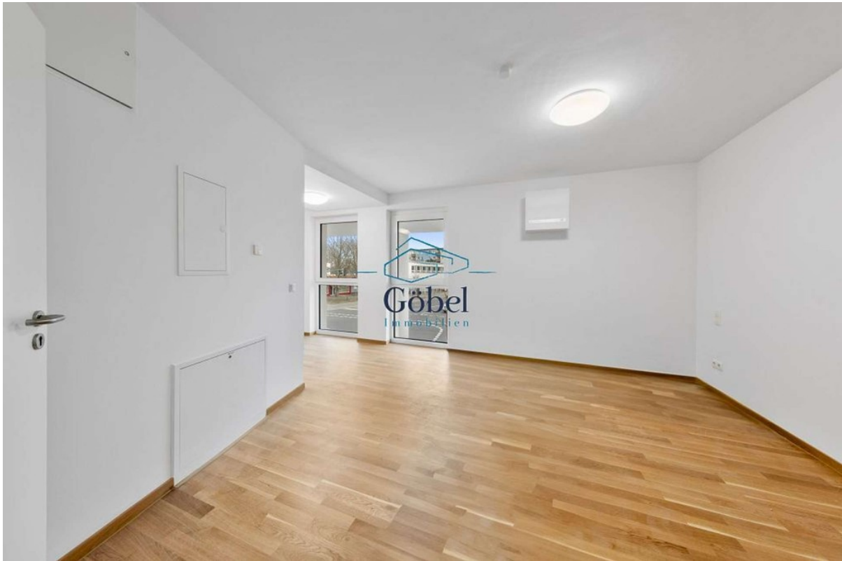
Büro 1.OG - 010