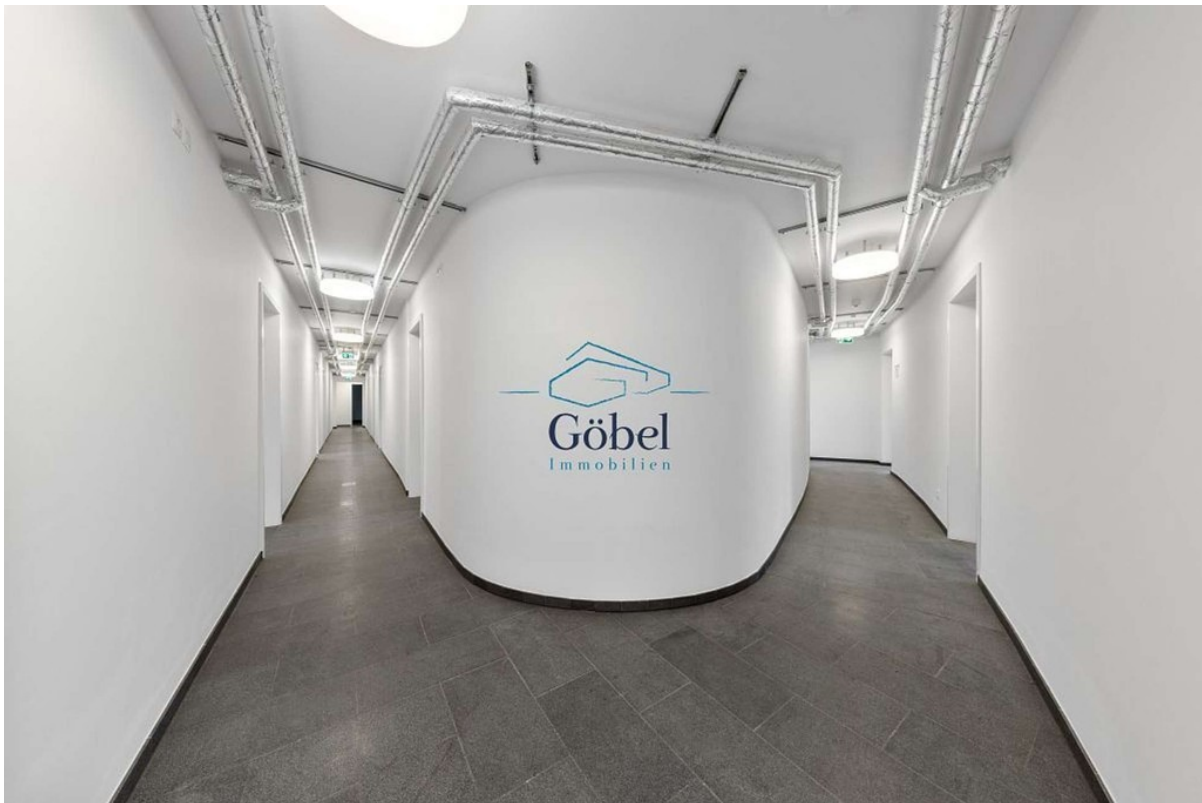
Büro 1.OG - 009