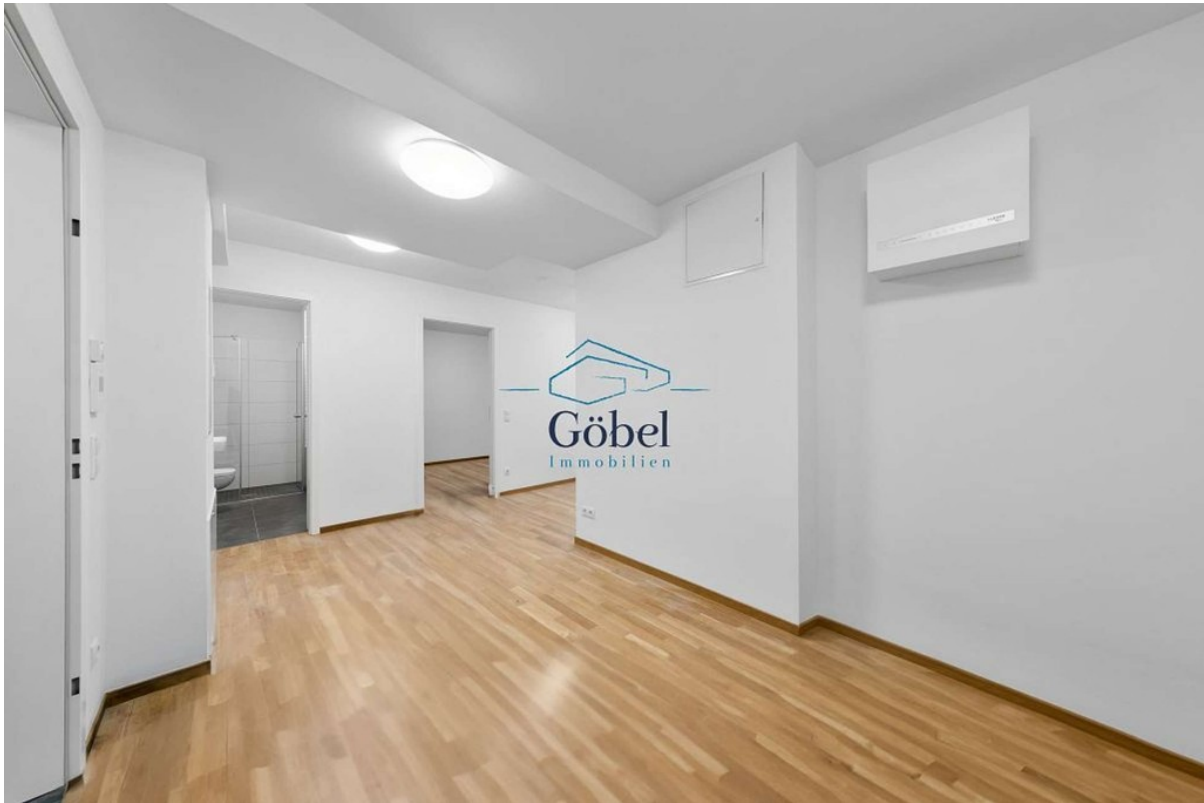
Büro 1.OG - 004