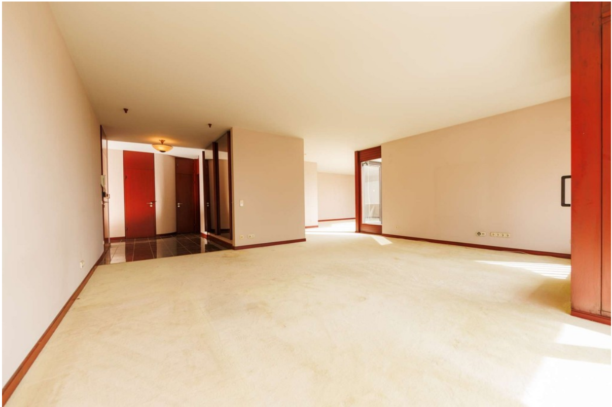
Blick auf den Eingangsbereich