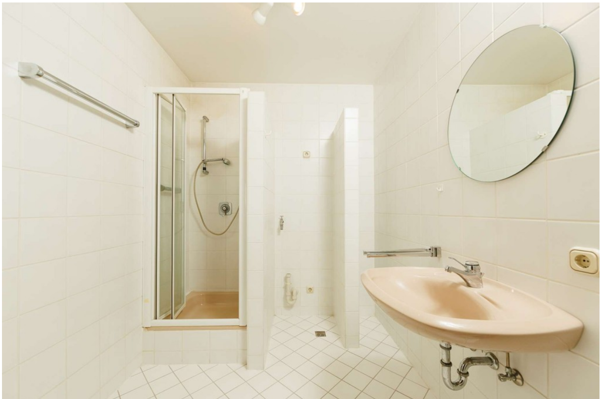
Duschbad mit Waschmaschinen un