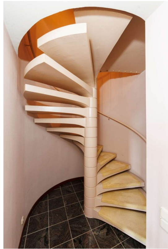
Treppe ins oberste Stockwerk