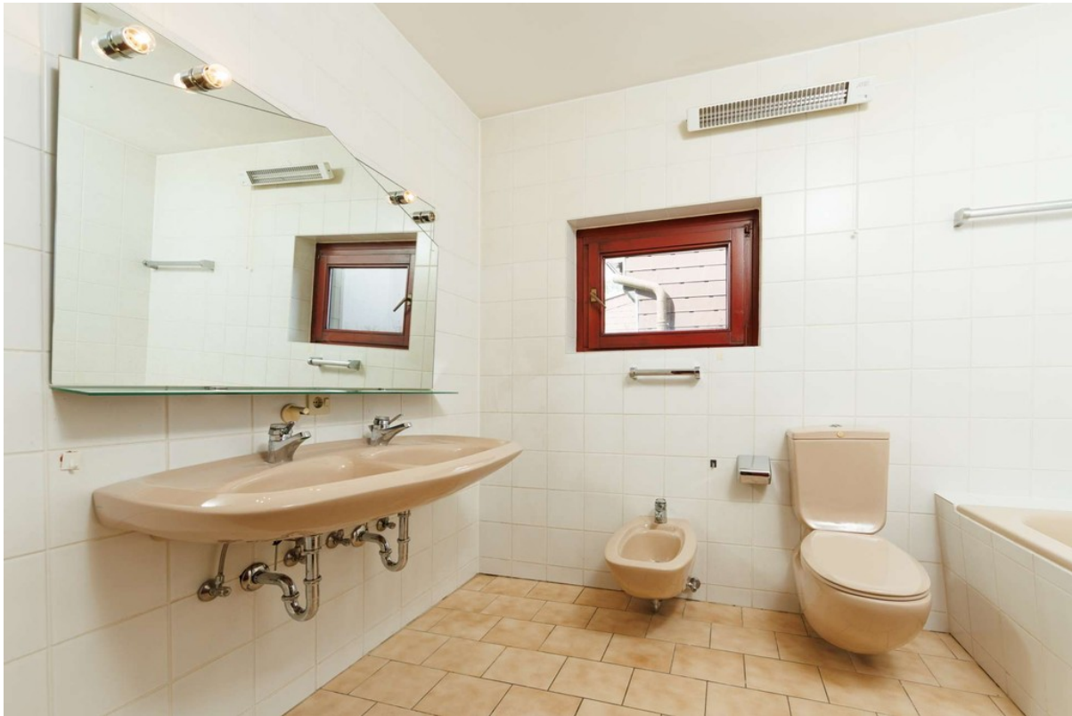
...sowie ein zweites Bad....