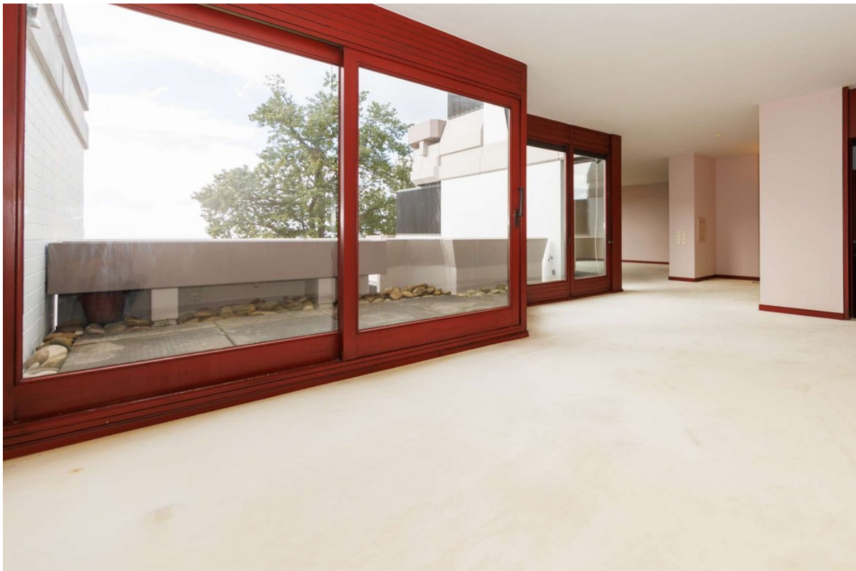
...Dank großer Panoramafenster