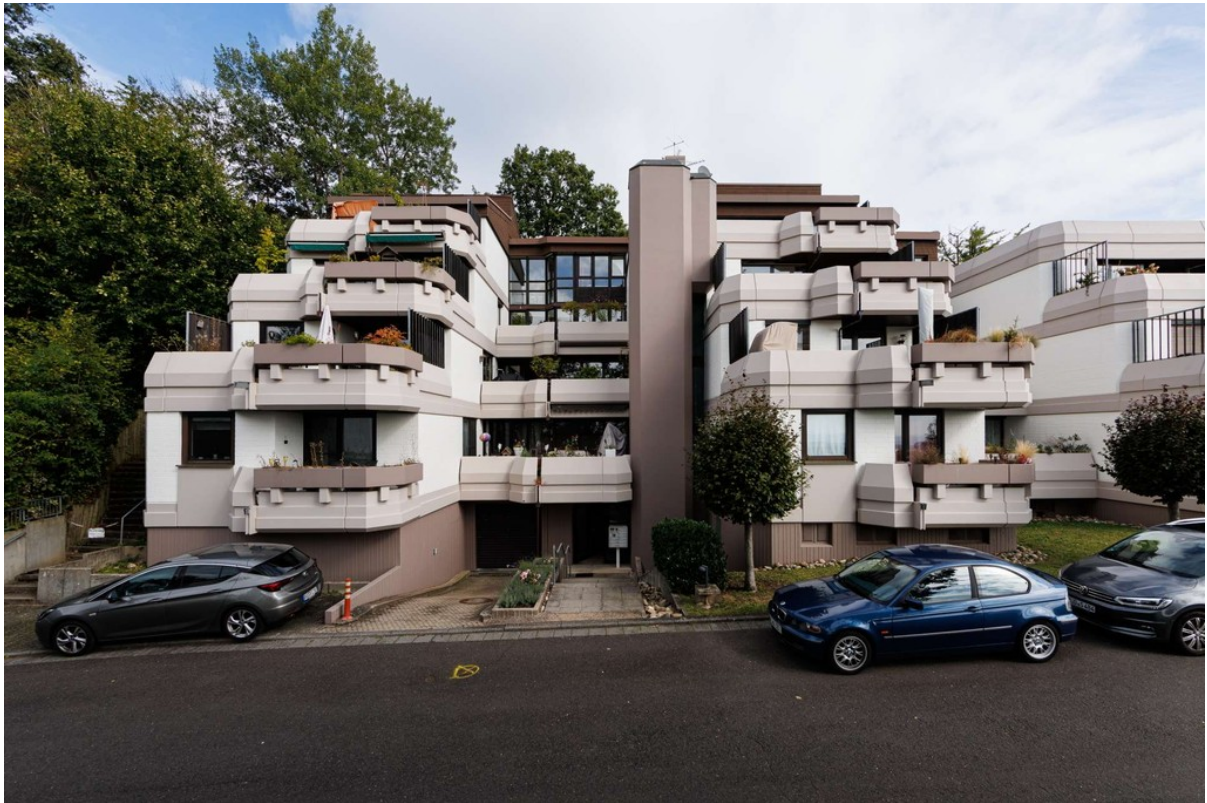
Eingangsbereich mit Zufahrt...