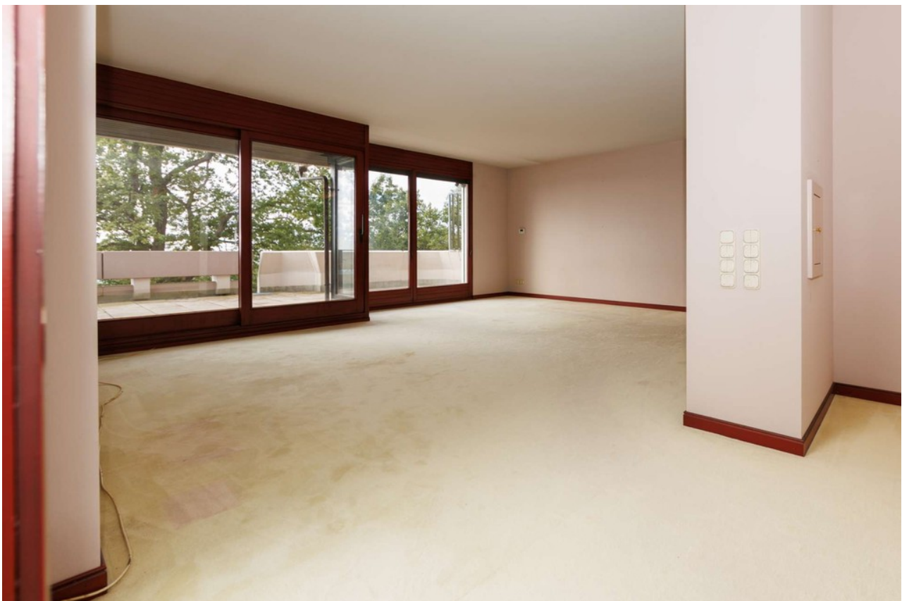
Helles, lichtdurchflutetes Wohn