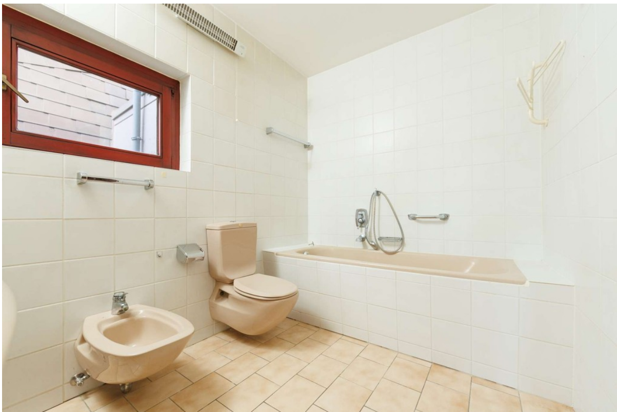
...mit Tageslicht und Wanne