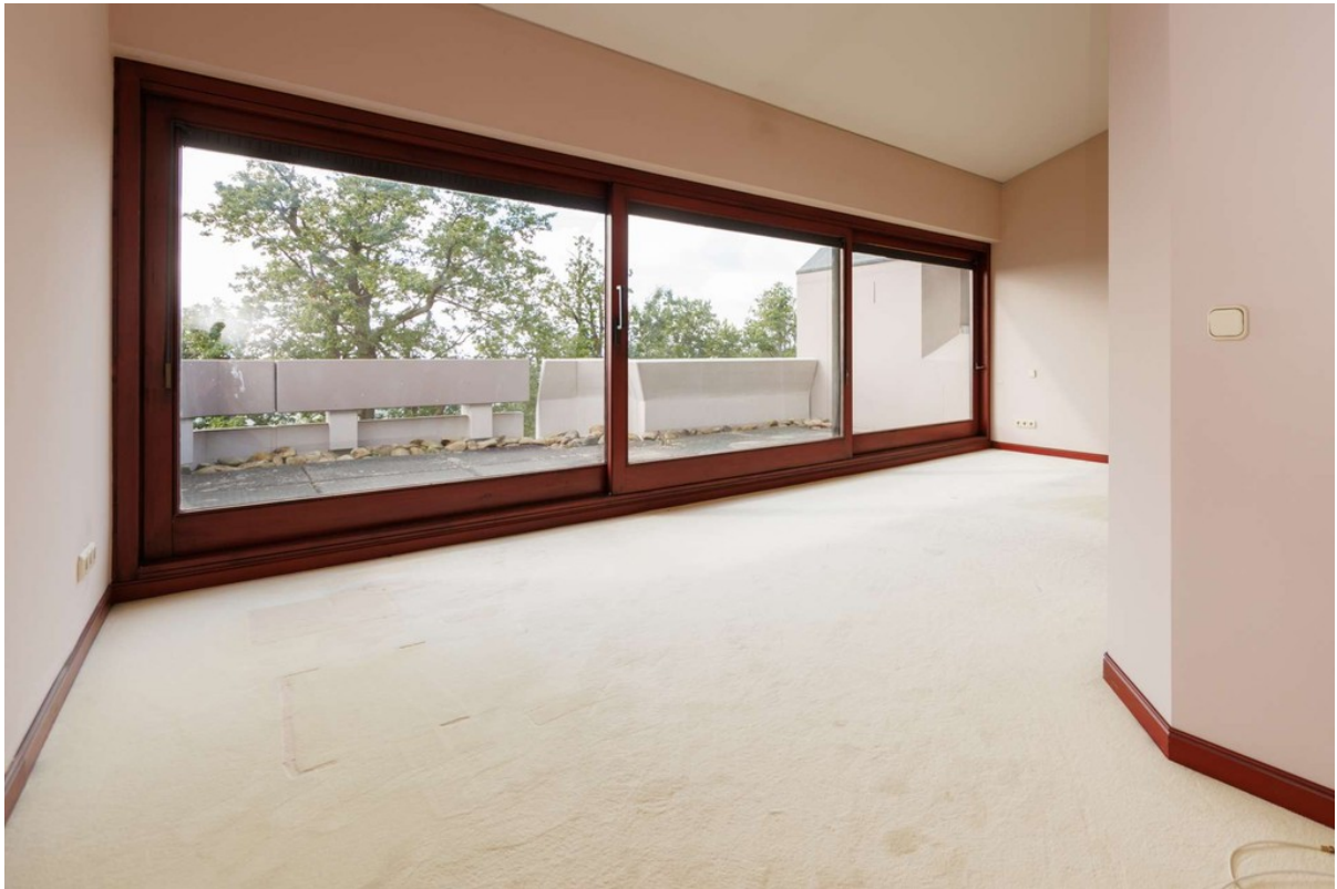
XL Schlafzimmer mit Traumblick