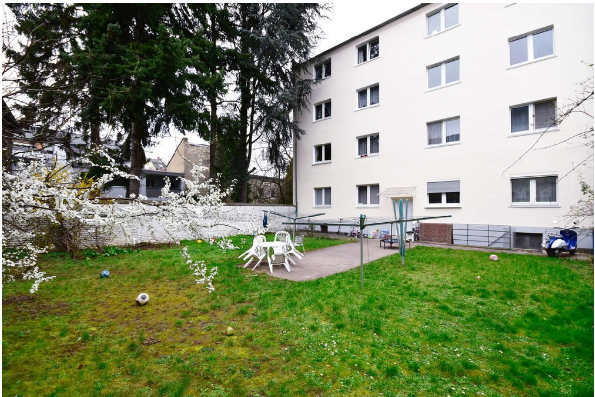
Großer Garten zur gemeinschaft