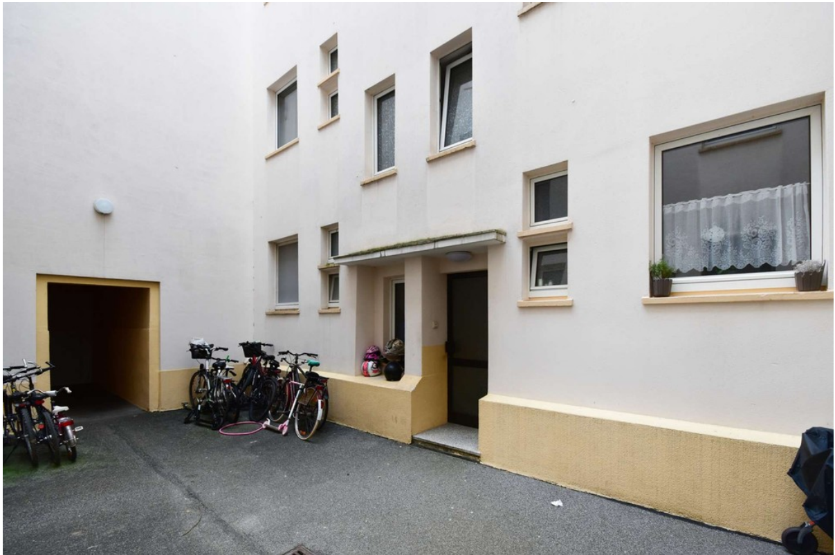
Eingangsbereich im ruhigen Hin