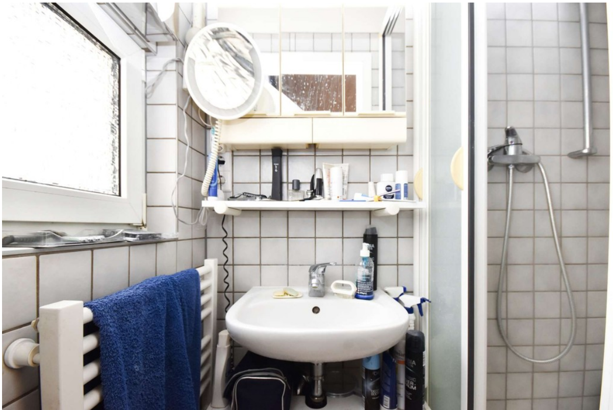
Duschbad mit Tageslicht - klei