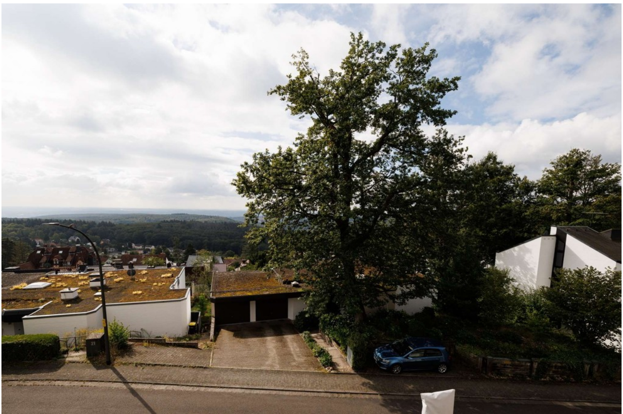
...mit traumhaften Südblick üb