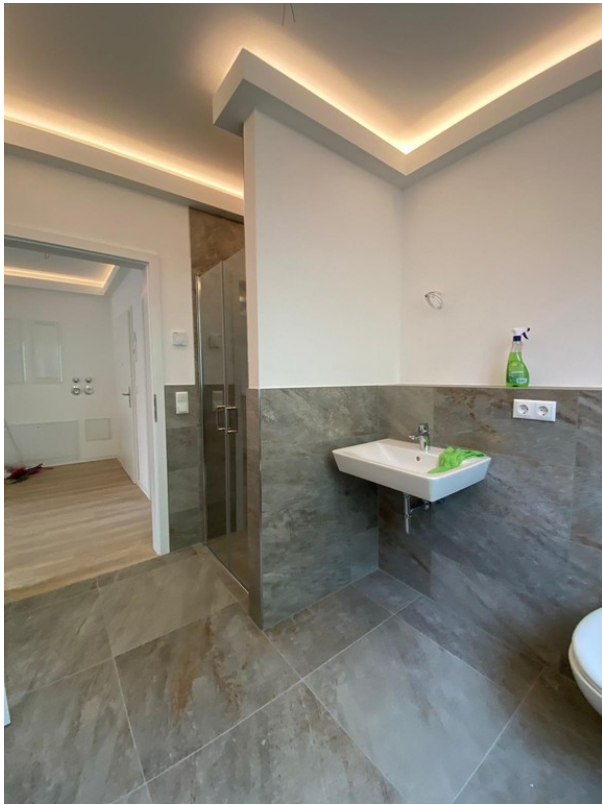
Bad mit Dusche