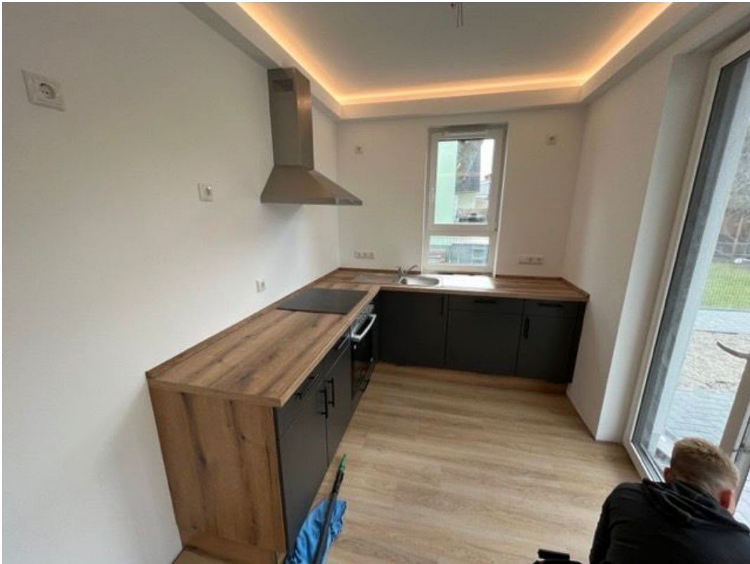
Küche(kann von Vormieter üubern