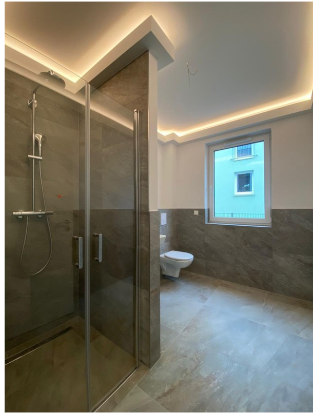
Bad mit Dusche