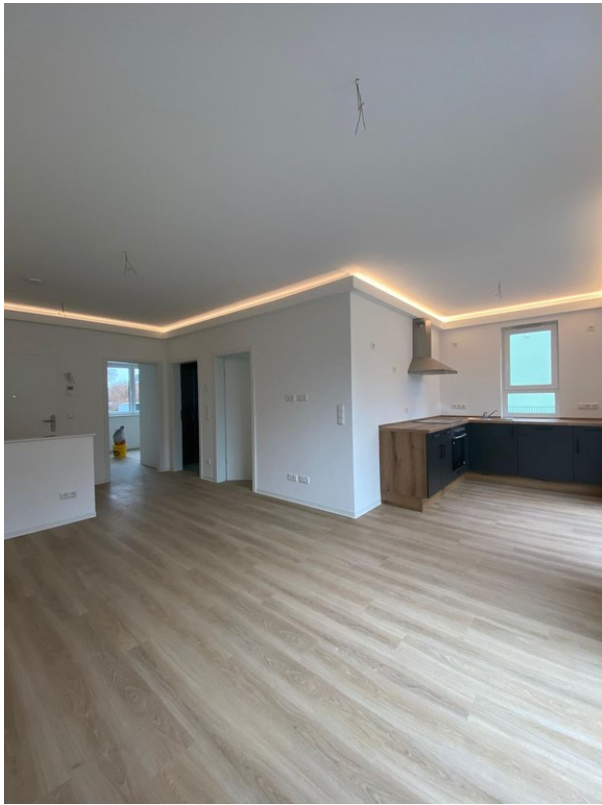
Wohnzimmer mit offener Küche