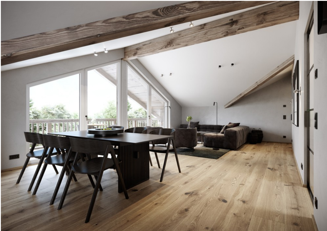
Penthouse mit Seeblick