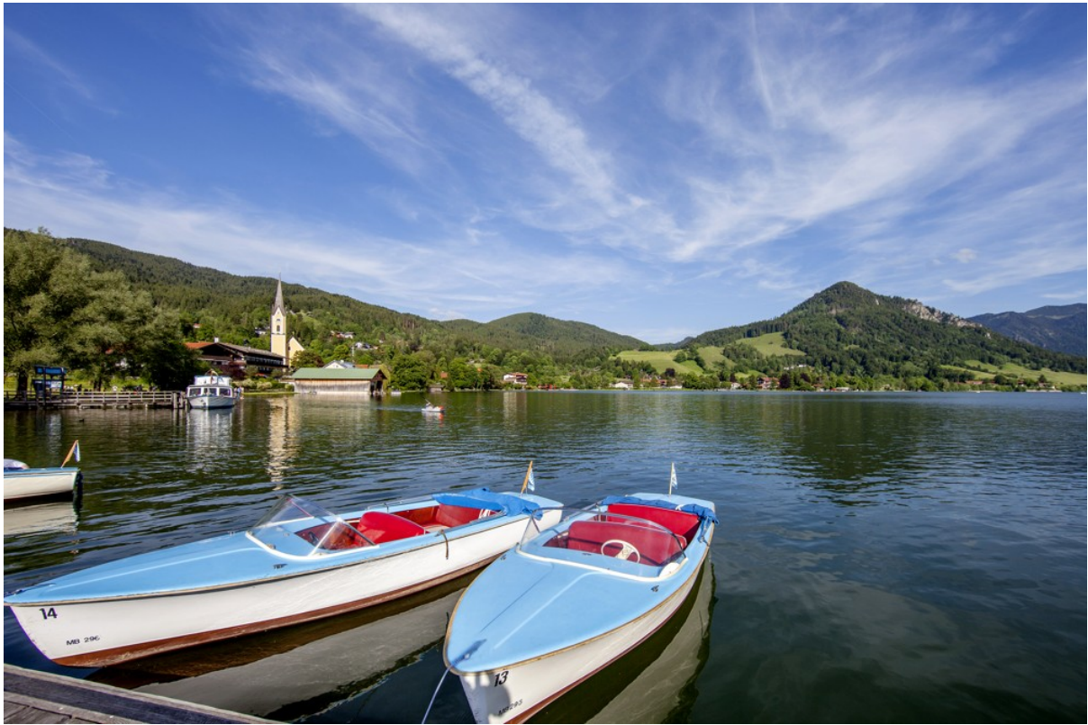
Zuhause am Schliersee