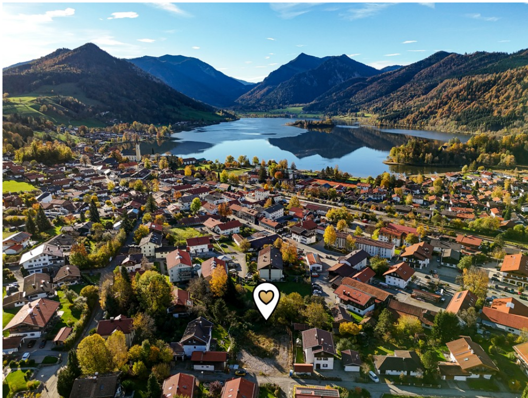
Alpen Immo Ortererstraße 5 Sch